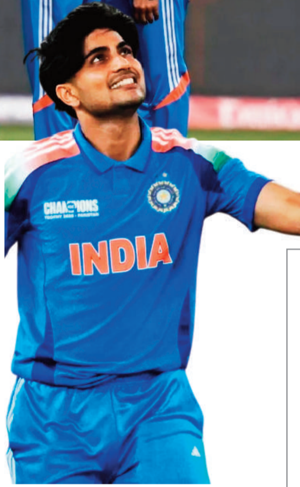
షమీ (5/53) మరోసారి ఐసీసీ టోర్నీలో సత్తా చాటాడు. ఐదు వికెట్లు ప్రదర్శించాడు. అతడితోపాటు హార్దిక్ 3, అక్షర్ పటేల్ 2 వికెట్లు తీశారు.

దుబాయ్: ఐసీసీ ఛాంపియన్స్ ట్రోఫీలో భారత్ శుభారంభం చేసింది. దుబాయ్ వేదికగా బంగ్లాదేశ్తో జరిగిన మ్యాచ్లో టీమ్ ఇండియా ఆరు వికెట్ల తేడాతో విజయం సాధించింది. తొలుత బ్యాటింగ్ చేసిన బంగ్లా 49.4 ఓవర్లలో 228 పరుగులకు ఆలౌట్ అయింది. అనంతరం లక్ష్మణ్ ఛేదనలో భారత్ 46.3 ఓవర్లలో నాలుగు వికెట్లను కోల్పోయి 231 పరుగులు చేసి విజయం సాధించింది. భారత్ ఓపెనర్ శుభ్ మన్ గిల్ (101ఐ) సెంచరీ బాదాడు. కెప్టెన్ ఇది 8వ శతకం కాగా.. ఐసీసీ ఛాంపియన్స్ ట్రోఫీలో తొలి సెంచరీ కావడం విశేషం.