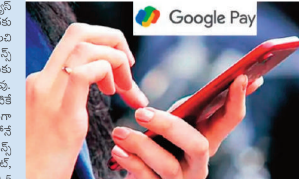
ఓ యూజర్ కు ఈ అనుభవం ఎదురైంది. ఓ డ్రగ్ మిడియా సంస్థ ఉదాహరణను ఉటంకించింది. తాను చెల్లించిన కరెంట్ బిల్లీపై

గూగుల్ కు చెందిన పేమెంట్ యాప్ గూగుల్ పే విద్యుత్, గ్యాస్ వంటి బిల్లీ పేమెంట్లపై ఛార్జీలు వసూలు చేస్తోంది. ఇప్పటివరకు ఇతర పేమెంట్ యాప్ లావాదేవీలపై ఎలాంటి ఫీజు విధించేది కాదు. ఇకనుంచి క్రెడిట్ కార్డు, డెబిట్ కార్డు ద్వారా చేసే లావాదేవీలపై కస్టమర్లకు ఫీజు రూపంలో స్వల్ప మొత్తంలో రుసుము వసూలుచేసేందుకు సిద్ధమైంది. యూపీఐ లావాదేవీలకు మాత్రం ఈ ఛార్జీలు వర్తించవు. ఇతర పేమెంట్ ప్లాట్ఫామ్లైన పేటీఎం, ఫోన్ పే సంస్థలు ఇప్పటికే ఇతర పేమెంట్ ఫీజును వసూలుచేస్తుండగా.. ఇన్నాక్షన్ ఉచితంగా అందించిన గూగుల్ పే సైతం ఇకనుంచి వాటి బాటలోనే నడవనుంది. గూగుల్ పే మొబైల్ రిచార్జీలపై రూ.3 కస్టమర్లకు ఫీజు రూపంలో గతేడాది నుంచి వసూలుచేస్తోంది. ఇకపై క్రెడిట్, డెబిట్ కార్డు ద్వారా చేసే విద్యుత్, గ్యాస్ బిల్లీ పేమెంట్లపై 0.5 శాతం నుంచి 1 శాతం వరకు ఛార్జీలు విధిస్తున్నట్లు తెలుస్తోంది. గూగుల్ పేలో ఇటీవల క్రెడిట్ కార్డు ద్వారా విద్యుత్ బిల్లు చెల్లించిన