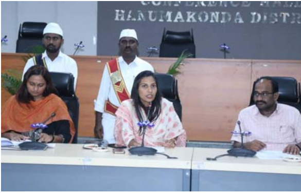
కమిటీ సభ్యులను భాగస్వామ్యం చేయాలన్నారు. గ్రామసభలోనే అర్హుల జాబితాను ప్రకటించాలన్నారు. ఈ సందర్భంగా గ్రామసభల నిర్వహణ ప్రక్రియకు సంబంధించి అధికారులకు కలెక్టర్ పలు సలహాలు, సూచనలు చేశారు.