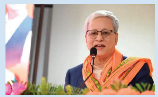
సైబరాబాద్, జనవరి 20 (తీవ్రార్ సూన్): పాఠశాల దశలోనే ట్రాఫిక్ రూల్స్ పై అవగాహన అవసరం అని తెలంగాణ గవర్నర్ జిష్ణు దేవ్ శర్మ తెలిపారు. రోడ్ సేఫ్టీ విషయంలో ప్రతి ఒక్కరూ బాధ్యతగా వ్యవహరించాలన్నారు. సింగిల్ లైన్, డబుల్ లైన్, వైవే రకరకాల రోడ్లు ఉంటాయని స్పష్టం చేసింది. అందులో ఏదీ తప్పిస్తే అదృష్ట విజయాల సాధనం వచ్చి పేరొచ్చారు. ఖాస్ రూమ్లో అనేక విషయాలు తెలుస్తాయని డాక్టర్, ఇంజనీర్ కావచ్చున్నారు. ట్రాఫిక్ రూల్స్ పై తెలంగాణలో అవైర్ నెస్ పాఠ్యాలు ఏర్పాటు చేయడం బాగుందని కిశాబు ఇచ్చారు. అలలతో అనేక అంశాలపై అవగాహన కలుగుతుందన్నారు. ఛట్టాల్తో సమాజంలో ఎలా బతకాలో ఒకరికి ఒకరు ఎలా సహాయం చేసుకోవాలో తెలుస్తుందన్నారు. పాలిటియన్ ఒక టోరింగ్ మీలో ఉన్న క్రియేటివిటీ ఇయటకు తీయండి అద్భుతమైన శాస్త్రవేత్తలు అవుతారని చెప్పారు. జై జవాన్, జై కిసాన్, జై విజ్ఞాన్. విద్యార్థి దశ నేర్చుకునే దశ ఈ దశలోనే సాంకేతిక, సామాజిక, ఆర్థిక అంశాలపై అవగాహన చేసుకోవాలని విద్యార్థులకు గవర్నర్ హితవు పలికారు.