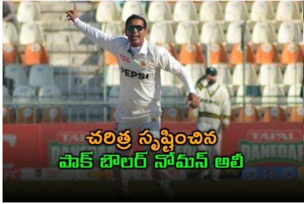
చలిత్ర సృష్టించిన పాక్ బౌలర్ నోమన్ అలీ

ముల్తాన్లో వెస్టిండీస్తో జరుగుతున్న రెండో టెస్టులో పాకిస్తాన్ స్పిన్నర్ నోమన్ అలీ చలిత్ర సృష్టించాడు. హ్యాట్రిక్ సాధించిన తొలి స్పిన్నర్ బౌలర్గా నోమన్ అలీ రికార్డుకెక్కాడు. పాక్ 1952లో తొలి టెస్టు మ్యాచ్ ఆడినప్పటి నుంచి ఇప్పటివరకు ఆ జట్టు తరపున ఇలా హ్యాట్రిక్ వికెట్లు తీసిన స్పిన్నర్ లేరు. నోమన్ అలీ వరుసగా మూడు బంతుల్లో జస్టిస్ గ్రీన్స్, బెవిన్ ఇమ్మాన్, కెవిన్ సింకెయిర్లల వికెట్లను పడగొట్టాడు. ఇక టాస్ గెలిచి మొదట బ్యాటింగ్కు దిగిన పర్యాటక జట్టును నోమన్ అలీ బెంబేలెత్తించాడు. దాంతో కేవలం 38 పరుగులకే 7 వికెట్లు కోల్పోయి విండీస్ పీకలలోతు కష్టాల్లో పడింది.