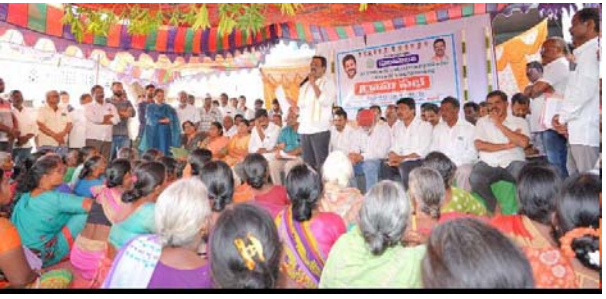
ఇళ్ల కోసం దరఖాస్తులు చేసుకోవాలని సూచించారు. ఎవరికైనా అర్హత ఉండి ఇతర ప్రభుత్వ పథకాలు రాకపోతే గ్రామ సభలో అప్లికేషన్లు పెట్టుకోవాలని ప్రజలకు విజ్ఞప్తి చేశారు. ఈ కార్యక్రమంలో కాంగ్రెస్ పార్టీ నాయకులు, కార్యకర్తలు మరియు అధికారులు, గ్రామస్థులు తదితరులు పాల్గొన్నారు.

దేవరకద్ర ఎమ్మెల్యే జి.మధుసూదన్ రెడ్డి దేవరకద్ర ప్రతినిధి, జనవరి 21 (తీవ్రార్ న్యూస్) మహబూబాద్ నగర్ జిల్లా అధికారుల మండలం కందూర్ గ్రామంలో నిర్వహించిన గ్రామ సభలో పాల్గొన్న దేవరకద్ర ఎమ్మెల్యే జి.మధుసూదన్ రెడ్డి, ఈ సందర్భంగా ఎమ్మెల్యే మాట్లాడుతూ అర్జులైన్ వారందరికీ సంక్షేమ పథకాలు అందించడం ప్రభుత్వ లక్ష్యమని తెలిపారు. జనవరి 26 నుంచి ప్రభుత్వం ప్రతిష్టాత్మకంగా అమలు చేయబోయే 4 పథకాలు (ఇందిరమ్మ ఇల్లు, రేషన్ కార్డులు, రైతు భరోసా, ఇందిరమ్మ ఆశ్రమ భరోసా) విషయంలో ప్రజలు ఎవ్వరూ అందోళన చెందవద్దని అర్జులకు తప్పకుండా పథకాలను వర్తింపజేస్తామన్నారు. నేటి నుంచి గ్రామాల్లో గ్రామ సభలు, వార్డు సభలు నిర్వహిస్తున్నందున అర్జులు అక్కడకు వెళ్లి అధికారుల సమక్షంలో రేషన్ కార్డులు, ఇందిరమ్మ