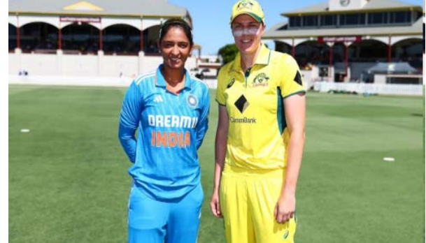
ఇన్నింగ్స్ను చక్కదిద్దండి. ఆ తర్వాత కెప్టెన్ తహియా %-% అన్నాబెల్ జోడి ఆరో వికెట్కు 122 పరుగుల భాగస్వామ్యం నిర్మించారు. చివరి ఓవర్లో అన్నాబెల్ రనౌట్ రూపంలో పెవిలియన్కు చేరింది. లేకపోతే మరోసారి ఆసిస్ 300 మార్కులు తాకేది.

హైదరాబాద్: ఆస్ట్రేలియాతో జరిగిన మూడో లేదా చివరి వన్డే మ్యాచ్ లో భారత మహిళా జట్టుకు 299 పరుగుల లక్ష్యం నిలిచింది. ముందుగా బ్యాటింగ్ చేసిన ఆసిస్ 50 ఓవర్లలో ఆరు వికెట్ల నష్టానికి 298 పరుగులు చేసింది. అన్నాబెల్ సదర్లాండ్ (110) సెంచరీ సాధించగా, కెప్టెన్ తహియా మెక్గ్రాథ్ (56 ల), ఆమ్మీ గార్డెనర్ (50) అర్ధ శతకాలతో మెరిచారు. భారత బౌలర్లలో అరంధతి రెడ్డి 4, డీప్ శర్మ ఒక వికెట్ తీశారు. ఇప్పటికే మూడు వన్డే సిరీస్ను 2-0 తేడాతో ఆసిస్ కైవసం చేసుకున్న విషయం విదితమే. టాన్ నెగ్గిన భారత్ బౌలింగ్ ఎంచుకుంది. ఆసిస్ ఓపెనర్లు ఫోయిట్ లిఫ్ఫీల్డ్ (25), జార్జియా వోల్ (26) దూకుడుగా ఇన్నింగ్స్ను ప్రారంభించారు. తొలి వికెట్కు 58 పరుగులు జోడించారు. ఈ సమయంలో విజయంపై అరంధతి రెడ్డి తొలి నలుగురు బ్యాటర్లను అవుట్ చేసింది. దీంతో ఒక్కసారిగా 78/4 స్కోరుకు ఆసిస్ పడిపోయింది. అయితే, ఆ తర్వాత భారత బౌలర్లు పట్టుపడిలేరారు. గార్డెనర్తో కలిసి అన్నాబెల్ 96 పరుగులు జోడించి