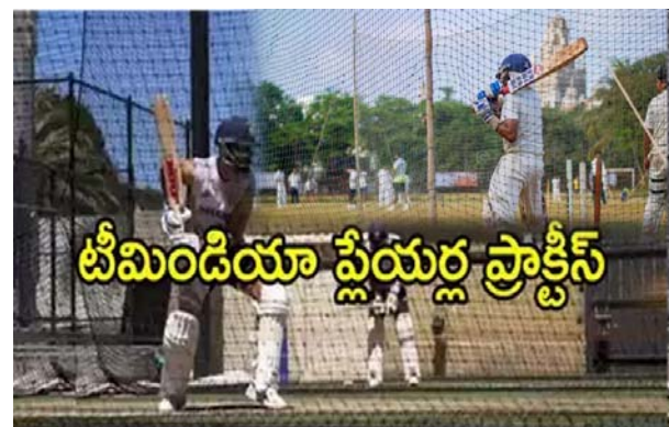
టీమిండియా వేయర్ల ప్రాక్టీస్

- నెట్స్లో భారత క్రికెటర్ల ప్రాక్టీస్ - 14 నుంచి ఆసిస్తో మూడో టెస్టు బోర్డర్ గవాస్కర్ ట్రోఫీ ఆసక్తికరంగా మారింది. పెర్ట్ బెస్టులో భారత్ 295 పరుగుల తేడాతో ఘన విజయం సాధించగా.. ఆడిలైడ్ టెస్టులో 10 వికెట్ల తేడాతో గెలుపొందిన ఆస్ట్రేలియా లెక్కు సమం చేసింది. ప్రపంచ క్రికెట్లో అగ్రజట్లు, సమష్టజట్ల సమరం ప్రస్తుతం 1-1తో రసకందాయంలో వదిలింది. న్యూడేచంలో వెనుకంజ వేసినా.. ఛంజకోవటం కంగారాలకు కొత్త విషయం. కానీ విదేశీ పర్యటనల్లో భారత్ వెనుకంజ వేసినా పుంజుకున్న సందర్భాలు ఎక్కువ. భారత్, ఆస్ట్రేలియా మూడో టెస్టు ఈ నెల 14 నుంచి బ్రీస్బేన్లో ఆరంభం కానుంది. 2018-19, 2020-21 పర్యటనల్లో ఆసిస్పై అసమాన విజయాలు సాధించి సిరీస్ సొంతం చేసుకున్న టీమ్ ఇండియా.. తాజా పర్యటనలో హాట్ ఫోమ్ కెప్టెన్లైనది. పింక్ బాల్ టెస్టు పరాజయం నుంచి బయటపడిన రోహిత్ శివన్.. మంగళవారం నెట్స్లో సాధన షురూ చేసింది.