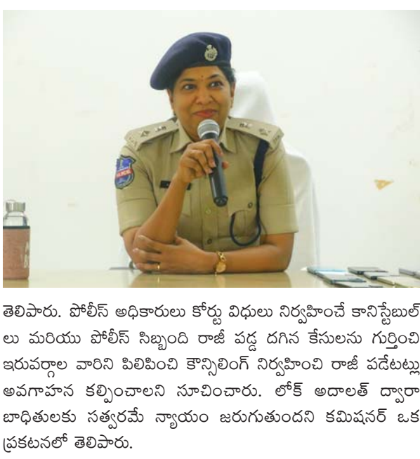
తెలిపారు. పోలీస్ అధికారులు కోర్టు విధులు నిర్వహించే కానిస్టేబుల్ లు మరియూ పోలీస్ సిబ్బంది రాజీ పడ దగిన కేసులను గుర్తించి ఇరువర్గాల వారిని పిలిచింది కానీ పర్షిని నిర్వహించి రాజీ పడటం అవకాశం కల్పించాలని సూచించారు. లోక్ అదాలత్ ద్వారా బాధితులకు సత్వరమే న్యాయం జరుగుతుందని కమిషనర్ ఒక ప్రకటనలో తెలిపారు.