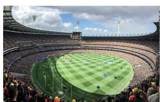
మ్యాచ్ మూడు రోజుల్లోనూ ముగిసింది ఈ మ్యాచ్కు రికార్డు స్థాయిలో 1,35,012 మంది ప్రేక్షకులు హాజరయ్యారు. కాగా, రెండు జట్ల మధ్య మూడో టెస్టు మ్యాచ్ డిసెంబర్ 14 నుంచి బ్రీస్బేన్లోని గబ్బా స్టేడియంలో జరుగుతుంది.

హాట్ కేకుల్లా అమ్ముడు పోయిన టిక్టెట్లు మెల్బోర్న్: భారత్ ఆస్ట్రేలియా జట్ల మధ్య డిసెంబర్ 26 నుంచి జరిగే బాక్సింగ్ డే టెస్టు మ్యాచ్కు ఫుల్ డిమాండ్ ఏర్పడింది. బోర్డర్ గవాస్కర్ ట్రోఫీలో భాగంగా మెల్బోర్న్ వేదికగా నాలుగో టెస్టు మ్యాచ్ జరుగుతుంది. ఈ మ్యాచ్కు 15 రోజుల సమయం ఉన్నప్పటికీ తొలి రోజుకు సంబంధించిన టిక్టెట్లన్నీ హాట్ కేకుల్లా అమ్ముడు పోయాయి. మొదటి రోజు ఆటకు సంబంధించిన టిక్టెట్లను విక్రయానికి పెట్టగా గంటల వ్యవధిలోనే అన్ని అమ్ముడై పోయాయి. ఈ విషయాన్ని క్రికెట్ ఆస్ట్రేలియా ట్వీట్ చేసింది. సిరీస్లో భాగంగా ఇరు జట్ల మధ్య ఇప్పటి వరకు రెండు టెస్టులు జరిగాయి. తొలి టెస్టులో టీమిండియా విజయం సాధించగా, ఆడిలైడ్లో జరిగిన రెండో మ్యాచ్లో ఆతిథ్య ఆస్ట్రేలియా జయతేజం ఎగర వేసింది. రెండో టెస్టు మ్యాచ్ డెన్టెట్ వర్షంలో నిర్వహించారు. ఈ