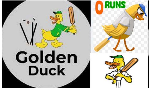
శర్మ(40), విరాట్ కోహ్లా(38), హర్షజన్ సింగ్(37), అనిల్ కుంభే(35), రోహిత్ శర్మ(34), సచిన్ టెండూల్కర్(34) సార్లు డకెట్ రూపంలో వెనుదిరిగారు.

హైదరాబాద్: క్రికెట్ పరిభాషలో ఎదుర్కొన్న తొలి బంతికి పరుగులేమీ చేయకుండా జైట్ అయితే గోల్డెన్ డకెట్ అంటారు. పరుగులేమీ చేయకుండా రెండో బంతికి జైట్ అయితే సిల్వర్ డకెట్, మూడో బంతికి జైట్ అయితే బ్రాజ్ డకెట్ అంటారు. ఒక్క బంతిని కూడా ఎదుర్కోకుండా రనౌట్ రూపంలో జైట్ అయితే డైమండ్ డకెట్ అంటారు. ఇండియా-ఆస్ట్రేలియా మధ్య జరుగుతున్న రెండో టెస్టులో యశస్వి జైన్ ఎదుర్కొన్న తొలి బంతికి జైట్ కావడంతో గోల్డెన్ డకెట్ తెరపైకి వచ్చింది. శ్రీలంక స్పిన్ బౌలర్ మురళీధరన్ 14 సార్లు గోల్డెన్ డకెట్ రూపంలో రికార్డు సృష్టించారు. లక్ష్మీ మలింగా(13), దినేష్ కార్తీక్(17), రోహిత్ శర్మ(16) సార్లు డకెట్ రూపంలో మైదానం వీడారు. శ్రీలంక బౌలర్ ముత్తయి మురళీధరన్ 59 సార్లు డకెట్ రూపంలో జైట్ తొలి స్టాంంలో ఉండగా వాల్డ్ కూడా 54 సార్లు డకెట్ అయి రెండో స్టాంంలో ఉన్నారు. భారత్ నుంచి బౌలర్ జహీర్ ఖాన్(44), ఇషాంత్