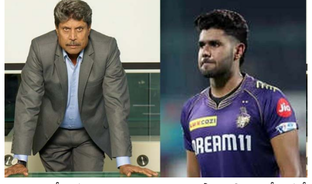
నిర్ణయాలు తీసుకుంటారని ఆశిస్తున్నానని తెలిపారు. బిసిసిఐ తీసుకునే నిర్ణయాలపై తాను జడ్జి చేయలేనని వివరణ ఇచ్చారు. అసలు ఇలాంటి విషయాలపై మనం మాట్లాడడం సరికాదని, టీమిండియా జట్టు మాజీ సహచరులే ఈ నిర్ణయాలు తీసుకోవడంతో పాటు ఎలాంటి ఇబ్బంది రాకుండా చూసుకుంటారని కపిల్ దేవ్ ఎద్దోవా చేశారు. గబ్బాటెస్టులో హార్మిత్ రాజాకు బదులుగా ఆకాష్ దీప్ తీసుకుంటే బాగుంటుందని మాజీ ఆటగాడు మంజ్రేకర్ సెలక్షన్ కమిటీకి సలహా ఇచ్చాడు.

హైదరాబాద్: రెండో టెస్టులో భారత జట్టు ఘోరంగా ఓడిపోవడంతో కెప్టెన్ రోహిత్ శర్మతో పాటు కోచ్ గంభీర్పై తీవ్ర విమర్శలు వస్తున్నాయి. బోర్డర్ గవాస్కర్ ట్రోఫీలో ఇద్దరు ఆటగాళ్లు అరంగేటం చేశారు. హైదరాబాద్ ఆటగాడు నితీష్ కుమార్ రెడ్డి బ్యాటింగ్లో వెర్రంపు వెరిపించాడు. కానీ అది ఓటమి నుంచి తప్పించలేకపోయాడు. నితీష్ కుమార్ రెడ్డిపై భారీ అంచనాలు ఉన్నాయి. బౌలింగ్లో రెండో వికెట్ల తీసి బ్యాటింగ్లో పర్యాయం చేసినా.. హార్మిత్ రాజా తొలి టెస్టులో రాజించినప్పటికీ రెండో టెస్టులో ఘోరంగా విఫలమయ్యాడు. దీంతో హార్మిత్ పై విమర్శలు వస్తున్నాయి. హార్మిత్ బదులు ఆకాష్ దీప్, ప్రసిద్ధ్ కృష్ణను తీసుకోవాలని డిమాండ్లు వస్తున్నాయి. హార్మిత్ కోల్తా నైట్ రైడర్స్ బౌలర్ కావడంతో జట్టులోకి తీసుకొని ఉంటారని క్రికెట్ అభిమానులు మండిపడుతున్నారు. విమర్శలపై టీమిండియా మాజీ కెప్టెన్ కపిల్ దేవ్ తనదైన శైలిలో చురకలందించాడు. టీమిండియాలో ఎవరు ఉండాలనేది కోచ్ ద్వారా నిర్ణయం తీసుకుంటారని, అది తన పని కాదన్నారు. తాను చెప్పినంత మాత్రాన జట్టులో పెద్దగా మార్పులు ఉండవచ్చు. ఇప్పటికైనా టీమిండియా జట్టు ఎంపికలో మంచి