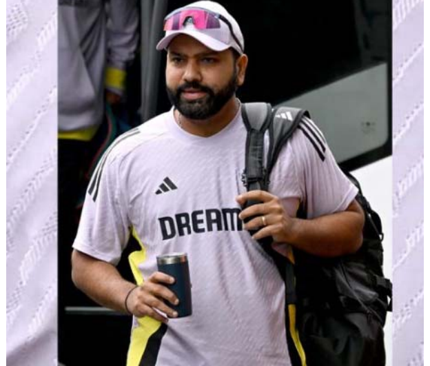
జట్టు ఓటమికి రోహిత్ పేలవమైన కెప్టెన్సీనే కారణమని భారత్తో పాటు ఆస్ట్రేలియా, ఇంగ్లండ్ తదితర దేశాలకు చెందిన మాజీ క్రికెటర్లు దుమ్మెత్తి పోస్తున్నారు. రోహిత్ కెప్టెన్సీలో పసలేదని, అతను సారథిగా పనికొరదని అతన్ని తప్పిస్తేనే జట్టుకు మేలు జరుగుతుందని వారు అభిప్రాయపడుతున్నారు. ఇంతకుముందు న్యూజిలాండ్తో సొంత గడ్డపై జరిగిన టెస్టు సిరీస్లోనూ రోహిత్ కెప్టెన్ గా ఘోరంగా విఫలమైన విషయాన్ని వారు గుర్తు చేస్తున్నారు. అతని సారథ్యంలో భారత్ ఎప్పుడూ లేని విధంగా న్యూజిలాండ్ చేతిలో వైట్ వాష్ కు గురైనది ఆరోపిస్తున్నారు. ఇదిలావుంటే బోర్డర్ గవాస్కర్ సిరీస్లో మిగిలిన మూడు టెస్టు మ్యాచ్లలో రోహిత్ కు సవాళ్లగా మారాయి. బ్యాటర్ గా, కెప్టెన్ గా జట్టుకు అండగా నిలువాలన్న పరిస్థితి అతనికి నెలకొంది. భవిష్యత్తులో సారథ్యాన్ని నిలుబెట్టకోవాలంటే బోర్డర్ గవాస్కర్ సిరీస్లో భారత్ ను విజేతగా నిలువడం తప్పింది రోహిత్ కు మరో మార్గం కనిపించడం లేదు.

బ్రీస్బేన్: బోర్డర్ గవాస్కర్ సిరీస్లో భాగంగా ఆడిలైడ్లో జరిగిన రెండో టెస్టులో టీమిండియా పది వికెట్ల తేడాతో ఘోర పరాజయం చవిచూసిన సంగతి తెలిసింది. ఇలాంటి స్థితిలో మిగిలిన మూడు టెస్టు మ్యాచ్లలో భారత జట్టుకు చావోరేవోగా మారింది. బుర్రా సారథ్యంలో మొదటి టెస్టులో బరిలోకి దిగిన టీమిండియా చారిత్రక విజయాన్ని సొంతం చేసుకుంది. కానీ రోహిత్ కెప్టెన్సీలో ఆడిలైడ్లో జరిగిన మ్యాచ్లో భారత్ ఘోర పరాజయం చవిచూసింది. జట్టు ను ముందుండి నడిపించడంలో రోహిత్ పూర్తి గా విఫలమయ్యాడు. కెప్టెన్ గా, బ్యాటర్ గా జట్టుపై ఏమాత్రం ప్రభావం చూపలేక పోయాడు.