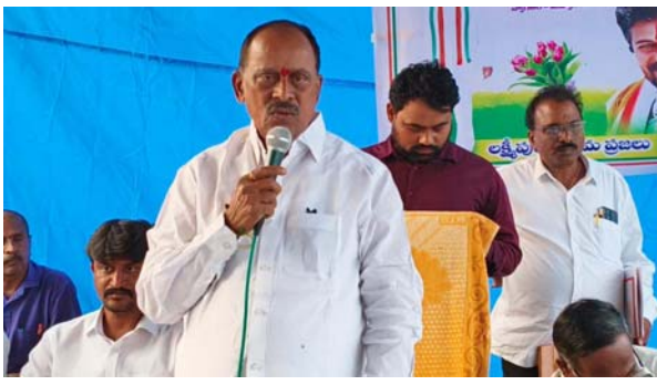
ఎన్ లో భాగంగా మండలానికి 1కోటి 90 లక్షలు మంజూరు చేయడం జరిగిందన్నారు. గత ప్రభుత్వం డబుల్ బెడ్ రూమ్ ఇండ్లు ఇస్తామని ఎన్నికల ముందు హడావుడి చేసి ప్రజలను మోసం చేసిందన్నారు. టీఆర్ఎస్ నాయకులు చేస్తున్న అబద్ధపు తప్పుడు ప్రచారాలను తిప్పి కొట్టాలని కాంగ్రెస్ నాయకులకు పిలుపునిచ్చారు.

పరకాల, నవంబర్ 26 (తీవ్రార్ న్యూస్): ప్రజా పాలన - ప్రజా విజయోత్సవాలలో భాగంగా మంగళవారం పరకాల మండల కేంద్రంలోని లక్ష్మీపురం గ్రామంలో 20 లక్షల రూపాయలతో ఈజీఎన్ఐ నిధులతో మంజూరైన గ్రామపంచాయతీ భవనమునకు పరకాల శాసనసభ్యులు రేవూరి ప్రకాష్ రెడ్డి శంకుస్థాపన చేశారు. ప్రజలకి భారత రాజ్యాంగ దినోత్సవ శుభాకాంక్షలు తెలిపారు. మన రాజ్యాంగాన్ని బైబిల్ ఖురాన్ భగవద్గీతతో గుర్తించడం జరుగుతుందన్నారు. అనంతరం గ్రామంలోని పారిశుద్ధ కాల్షికులకు ఘనంగా సన్మానించారు. ఈ సందర్భంగా ఎమ్మెల్యే మాట్లాడుతూ వివక్షత లేకుండా ప్రతి గ్రామానికి అవసరాన్ని బట్టి న్యాయం చేయడం జరుగుతుందన్నారు. ప్రాధాన్యత క్రమంలో ఆరు గ్యారెంట్ హామీలను అమలు చేయడం జరుగుతుందన్నారు. త్వరలో గ్రామసభలు నిర్వహించి అర్హత ఉన్న ప్రతి కుటుంబానికి ఇందిరమ్మ ఇండ్లు మంజూరయ్యేలా కృషి చేస్తానని తెలిపారు. కాంగ్రెస్ ప్రజా ప్రభుత్వం ప్రజా సమస్యల పరిష్కారానికి చిత్తశుద్ధితో పనిచేస్తుందని తెలిపారు. ఎన్ ఆర్ ఈ జి