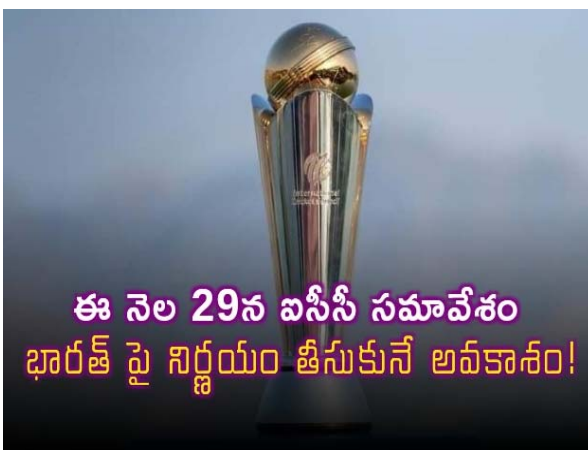
ఈ నెల 29న ఐసీసీ సమావేశం భారత్ పై నిర్ణయం తీసుకునే అవకాశం!

పాకిస్తాన్ వేదికగా వచ్చే ఏడాది ఛాంపియన్స్ ట్రోఫీ షెడ్యూల్, వేదికల ఖరారుపై చర్చించనున్న ఐసీసీ భారత్ పై ఐసీసీ ఎలాంటి నిర్ణయం తీసుకుంటుందన్న దానిపై సర్వత్రా ఆసక్తి మరీ కాన్ఫెడరేషన్ ఛాంపియన్స్ ట్రోఫీ జరగనున్న నేపథ్యంలో, నవంబరు 29న అంతర్జాతీయ క్రికెట్ మండలి (ఐసీసీ) సమావేశం కానుంది. వచ్చే ఏడాది పాకిస్తాన్ లో జరగనున్న ఛాంపియన్స్ ట్రోఫీ షెడ్యూల్, వేదికల ఖరారు గురించి ఈ సమావేశంలో చర్చించున్నారు. ఐసీసీ ఛాంపియన్స్ ట్రోఫీకి వేదికగా పాకిస్తాన్ ను గతంలోనే ఎంపిక చేశారు. అయితే ఈ టోర్నీలో పాల్గొనేందుకు పాకిస్తాన్ వెళ్లడం లేదని భారత్ స్పష్టం చేసింది. ఈ నేపథ్యంలో, ఈ నెల 29న జరిగే సమావేశంలో ఐసీసీ ఎలాంటి నిర్ణయం తీసుకుంటుందన్న దానిపై ఆసక్తి నెలకొంది.