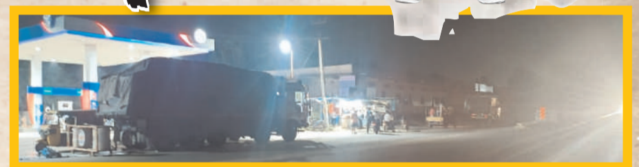
పాఠశాల పక్కనే ఉన్న పెట్రోల్ బంకు.. దాని ముందు మరియు పాఠశాల ముందు ఆగి ఉన్న హెబీ వాహికల్నే

ప్రమాదంలో " ప్రశ్నార్థకంగా" పిల్లల ఆరోగ్యం చుట్టూ రసాయనాల ఆదారిత పంటలు.. గాల్లో వ్యాప్తి గోడకు ఆనుకొని పెట్రోల్ బంక్.. ప్రమాదం ఏర్పడితే భారీ నష్టమే 50 మీటర్లలో వైన్స్ షాప్స్.. పక్కకే కళ్ళు ముందువాల పత్తి మిల్లు దూది పెంజలు, టింబర్ డిపోల చెక్కపాట్లు రోడ్డు పక్కనే స్టూల్ వ్యాన్లు.. ప్రమాదాలకు అవకాశం అనుమతులు ఇచ్చినదెవరం అధికారులూ.. అక్రమార్కులూ..? విద్యార్థుల ఆరోగ్యం దృశ్యా చర్యలు తప్పనిసరి : స్థానికులు