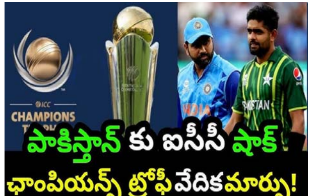
ఇంకా విడుదల కాలేదు. పాకిస్తాన్లోని లాహోర్, కరాచీ, రావల్పిండి వేదికగా మోగ టోర్నీ నిర్వహణకు ఓ వైపు పాకిస్తాన్ క్రికెట్ బోర్డు ఏర్పాట్లు చేస్తోంది. ట్రోఫీ టూర్ సైతం ఇప్పటికే మొదలైంది. అయినా, వేదికపై సభ్యుల దేశాలకు ఎటువంటి స్పష్టత లేదు. పాక్లో రాజకీయ అనిశ్చితి! పాకిస్తాన్ క్రికెట్ బోర్డు (పిసీబి) చైర్మన్ మోషిన్ నక్వీ అక్కడి ప్రభుత్వంలోనూ కీలక సభ్యుడు. కేబినెట్లో ఇంటియర్ మంత్రిగా బాధ్యతలు నిర్వహిస్తున్నారు. పాకిస్తాన్ మాజీ ప్రధానమంత్రి, క్రికెట్ జట్టు మాజీ కెప్టెన్ ఇమ్రాన్ ఖాన్ సారథ్యంలోని పీటీఐ పార్టీ ఇస్లామాబాద్లో భారీ ఎత్తున రాజకీయ నిరసన ప్రదర్శనలు చేపడుతోంది. దీంతో మోషిన్ నక్వీ పరిస్థితులు చక్కదిద్దేందుకు గత రెండు రోజులుగా ఇస్లామాబాద్లోనే ఉంటున్నారు. పాక్లో ఆడేందుకు భారత్ కు ఉన్న అభ్యంతరాలు లిఖితపూర్వకంగా అడిగిన పిసీబి. బిసీబినితో మాట్లాడేందుకు ఆసక్తి చూపించింది. కానీ భారత్ ప్రభుత్వం రోహిత్ శిఖన్ పాక్లో అడుగుపెట్టేందుకు అనుమతి ఇవ్వలేదు. ఇదే విషయాన్ని ఐసీసీకి బిసీబి తెలియజేసింది. వేదిక అంశంపై ఓటింగ్ నిర్వహిస్తే.. ఇతర సభ్యుల దేశాల భారత్ కు అనుకూలంగా వ్యవహరించేందుకు బిసీబిని పాపులు కదుపనుంది. జై పా తదుపరి చైర్మన్ కావడంతో సహజంగానే ఇతర దేశాల మద్దతు ఉండనుంది.

దుబాయి: ఐసీసీ 2025 ఛాంపియన్స్ ట్రోఫీ వేదికపై ఉత్పలం కొనసాగుతుంది. ఎట్టి పరిస్థితుల్లోనూ పాకిస్తాన్లో ఆడబోమని భారత క్రికెట్ నియంత్రణ మండలి (బిసీబి) తేల్చి చెప్పింది. హైబ్రిడ్ మోడల్లో టోర్నీ నిర్వహణకు పాకిస్తాన్ క్రికెట్ బోర్డు (పిసీబి) ఎంతమాత్రం సుముఖంగా లేదు. దీంతో ప్రతిష్టాత్మక ఈవెంట్ నిర్వహణ పట్టాల్సిందిగా అంతర్జాతీయ క్రికెట్ కౌన్సిల్ (ఐసీసీ) సరికొత్త ఆలోచన చేసింది. ఈ నెల 29న ఐసీసీ బోర్డు సమావేశం జరుగుతుంది. వర్చువల్ గా జరుగుతున్న ఈ సమావేశంలో ఛాంపియన్స్ ట్రోఫీ వేదికపై ఓ నిర్ణయం తీసుకోనున్నారు. ఓటింగ్ కు అవకాశం? ఐసీసీ బోర్డులో 12 మంది శాశ్వత సభ్యుల దేశాలు, అసోసియేట్ సభ్యుల దేశాల ప్రతినిధులు ముగ్గురు, స్వతంత్ర డైరెక్టర్, ఐసీసీ చైర్మన్ సహా సీఈవో ఉంటారు. ఐసీసీ చైర్మన్ హెనరీ గ్రెగ్ బార్డే అధ్యక్షత వహించనున్న చివరి సమావేశం ఇదే కానుంది. డిసెంబర్ 1న బిసీబిని కార్యదర్శి జై పా ఐసీసీ సూతన చైర్మన్ గా బాధ్యతలు స్వీకరించనున్నారు. ఛాంపియన్స్ ట్రోఫీ విషయంలో బిసీబిని హైబ్రిడ్ మోడల్ కోరుతుంది. భారత మ్యాచులను తప్ప వేదికపై నిర్వహించాలని కోరుతోంది. అందుకు పాకిస్తాన్ ససీమిరా అంటోంది. భారత్ కూడా పాక్లోనే ఆడాలని పట్టుబడుతోంది. ఛాంపియన్స్ ట్రోఫీ వూర్తిగా పాక్లో జరగాలా? హైబ్రిడ్ మోడల్లో జరగాలా? అనే అంశంపై ఐసీసీ సభ్యుల దేశాలను ఓటింగ్ కు ఆడిగి అవకాశం ఉంది. ఓటింగ్లో మెజార్టీ ఆధారంగా ఛాంపియన్స్ ట్రోఫీ వేదిక మార్పుపై నిర్ణయం తీసుకోనుంది. షెడ్యూల్ అలస్యం ఛాంపియన్స్ ట్రోఫీలో ఎనిమిది జట్లు పోటీపడుతున్నాయి. 2025 ఫిబ్రవరి 19 నుంచి మార్చి వరకు ఈ టోర్నీ జరుగుతుంది. కనీసం 100 రోజుల ముంగిట గ్లోబల్ టోర్నీ షెడ్యూల్ విడుదల చేయటం ఐసీసీకి సంప్రదాయంగా వస్తోంది. 2025 ఛాంపియన్స్ ట్రోఫీ షెడ్యూల్