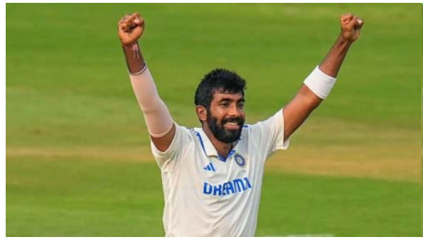
మెరుగయింది. ప్రస్తుతం జైస్వాల్ 825 పాయింట్లతో రెండో ర్యాంక్లో కొనసాగుతున్నాడు. నెం.01 బ్యాట్లర్ జో రూట్ 903 పాయింట్లతో అగ్రస్థానంలో ఉన్నాడు. ఇక పెర్ట్ మ్యాచ్లోనే సెంచరీ బాదిన భారత సీనియర్ బ్యాట్లర్ విరాట్ కోహ్లా టెస్టు ర్యాంకింగ్లో 13వ స్థానానికి చేరుకున్నాడు. అటు టెస్టు అలెండర్లో రవీంద్ర జడేజా, రవిచంద్రన్ అశ్విన్ వరుసగా ఒకటి, రెండు స్థానాల్లో ఉన్నారు. ఈ ఇద్దరూ పెర్ట్ టెస్టులో బెంచ్ పరిమితమైనా తమ ర్యాంకులను కోల్పోలేదు.

- పెర్ట్ టెస్టులో 8 వికెట్లతో రాణించిన జస్త్ బుమ్రా - ఈ ప్రదర్శన కారణంగానే ర్యాంకింగ్లో అగ్రస్థానం - కగిసో రబాద, హేజిల్వుడ్ను దాటేసి టాప్ ర్యాంక్ - బ్యాట్లర్ల ర్యాంకింగ్లో యశస్వి జైస్వాల్కు రెండో ర్యాంక్ ఐసీసీ బుధవారం విడుదల చేసిన టెస్టు ర్యాంకింగ్లో భారత స్టార్ పేసర్ జస్త్ బుమ్రా అగ్రస్థానంలో నిలిచాడు. పెర్ట్ టెస్టులో 8 వికెట్లు తీసి భారత్కు 295 పరుగుల తేడాతో బంపర్ వికెట్లని అందించాడీ ఫాస్ట్ బౌలర్. ఈ అద్భుత ప్రదర్శన కారణంగానే బుమ్రా నెం.01 బౌలర్గా నిలిచాడు. కగిసో రబాద, జోష్ హేజిల్వుడ్ను దాటేసి టాప్ ర్యాంక్కు దూసుకెళ్లాడు. అటు టెస్టు బ్యాట్లర్ల ర్యాంకింగ్లో భారీ సెంచరీతో అలరించిన యశస్వి జైస్వాల్ కెరీర్ బెస్ట్ ర్యాంక్ సాధించాడు. మనోడు ఏకంగా రెండో స్థానం వైచనం చేసుకున్నాడు. పెర్ట్ టెస్టులో 161 పరుగులు చేయడంతో జైస్వాల్ ర్యాంక్