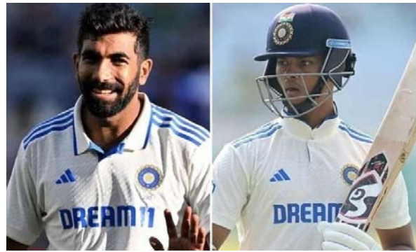
బుమ్రా 8 వికెట్లతో రాణించారు.

ICC టెస్టు ర్యాంకింగ్ లో టీమిండియా స్టార్ పేసర్ జస్త్ బుమ్రా సత్తా చాటాడు. మరోసారి నంబర్ బౌలర్ గా నిలిచాడు. బుధవారం ఐసీసీ టెస్టు ర్యాంకింగ్ ప్రకటించింది. ఈ జాబితాలో భారత ఆటగాళ్లు తమ ర్యాంకులను భారీగా మెరుగుపర్చుకున్నారు. బ్యాటింగ్లో యువ ఓపెనర్ యశస్వి జైస్వాల్ రెండో స్థానానికి దూసుకెళ్లాడు. ఇక, పంత్ 6వ స్థానం, విరాట్ కోహ్లా 13వ స్థానంలో నిలిచారు. బౌలింగ్ విభాగంలో బుమ్రా మళ్లీ అగ్రస్థానానికి చేరుకున్నాడు. అశ్విన్ 4, జడేజా 7వ స్థానం పొందారు. అల్ రౌండర్లలో జడేజా తొలి స్థానం, అశ్విన్ రెండో స్థానంలో, అక్షర్ పటేల్ ఏడో స్థానంలో నిలిచారు. కాగా, బోర్డర్ గవాస్కర్ ట్రోఫీలో భాగంగా ఇటీవల పెర్ట్ వేదికగా ఆస్ట్రేలియాతో జరిగిన తొలి టెస్టులో జైస్వాల్, కోహ్లా సెంచరీలు చేయగా,