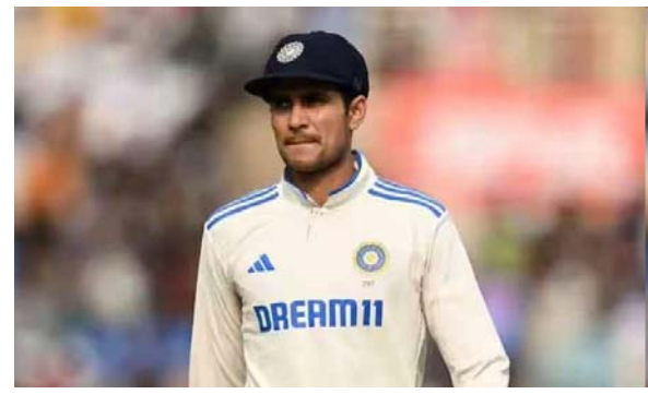
కాగా, తొలి టెస్టులో భారత్ అదరగొట్టింది. ఆసీన్ ను చిత్తు చేసి ఘన విజయం సాధించిన సంగతి తెలిసిందే.

బోర్డర్ గవాస్కర్ ట్రోఫీలో భాగంగా ఆసీన్ పర్యటనలో ఉన్న టీమిండియా.. ఆతిథ్య జట్టుతో రెండో టెస్టు డిసెంబర్ 6 నుంచి ప్రారంభం కానుంది. అయితే, రెండో టెస్టుకు కూడా భారత బ్యాట్స్ మెన్ శుభ్ మన్ గిల్ దూరం కానున్నట్లు తెలుస్తోంది. ఈ సీరీస్ కు ప్రారంభానికి ముందు ప్రాక్టీస్ మ్యాచ్ లో గిల్ గాయపడ్డాడు. దీంతో అతను తొలి టెస్టు ఆడలేడు. ఇంకా గాయం నుంచి కోలుకోకపోవడంతో గిల్ రెండో టెస్టుకూ అందుబాటులోకి వచ్చే అవకాశం లేదని నమావారం. గాయం వూర్తిగా నయం కావాలంటే.. మరో రెండు వారాల పాటు విశ్రాంతి తీసుకోవాలని గిల్ కు వైద్యులు సూచించినట్లు సమాచారం. దీంతో అడిలైడ్ టెస్టుకు గిల్ దూరం కానున్నట్లు క్రికెట్ పర్సనల్ చెబుతున్నాయి.