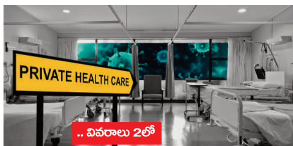
.. వివరాలు 2లో

కొత్తగా ఏర్పాటుయ్యే హాస్పిటల్స్ కు ఈ టర్నిఫ్ వర్తింపు పడకలు వారీగా ఫీజులు నిర్ణయించాలని ఆలోచన