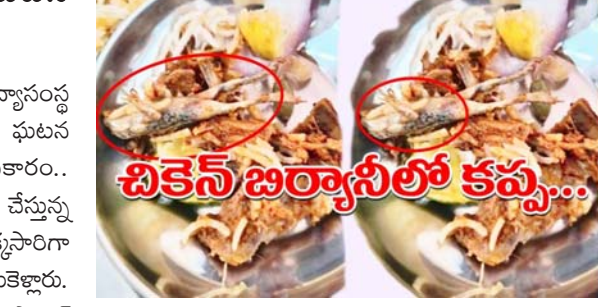
చికెన్ బిర్యానీలో కప్ప..

- గచ్చిబౌలిలోని ప్రభుత్వ డ్రిఫుల్ బట్టీ కాలేజీలో ఘటన - ఆలస్యంగా వెలుగులోకి.. మియాపూర్: రంగారెడ్డి జిల్లా గచ్చిబౌలిలోని ప్రభుత్వ డ్రిఫుల్ బట్టీ విద్యాసంస్థ మెన్ లో విద్యార్థులు తినే చికెన్ బిర్యానీలో కప్ప దర్శనమిచ్చింది. ఈ ఘటన ఆలస్యంగా వెలుగులోకి వచ్చింది. విద్యార్థులు తెలిపిన వివరాల ప్రకారం.. ఐటెంట్ లోని విద్యార్థులు ఈ నెల 16వ తేదీన కాలేజీలోని మెన్ లో భోజనం చేస్తున్న సమయంలో బిర్యానీలో కప్ప కనిపించింది. దాంతో విద్యార్థులు ఒకసారిగా షాకేకు గురయ్యారు. వెంటనే ఈ విషయాన్ని కాలేజీ అధికారుల దృష్టికి తీసుకెళ్లారు. వారి నుంచి ఎలాంటి స్పందన లేకపోవడంతో విద్యార్థులు ఈ విషయాన్ని సోషల్ మీడియాలో పోస్టు చేయడంతో అనలు విషయం వెలుగులోకి వచ్చింది. ప్రతిష్టాత్మక ఐటెంట్ లో విద్యార్థులకు ఇలా కల్పి ఆహారం అందించడం పట్ల విమర్శలు వెల్లువెత్తుతున్నాయి. బాధ్యులపై చర్యలు తీసుకోవాలని పలు విద్యార్థి సంఘాల నాయకులు డిమాండ్ చేశారు.