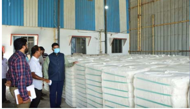
రూ.7,521గా ప్రభుత్వం గిట్టుబాటు ధరను ప్రకటించింది బ్యాంకు ఖాతాను ఆధార్ నెంబర్తో లింక్ చేసుకోవాలని దళారులని నమ్మి మోసపోవద్దని సీసీబి కేంద్రాల్లో పత్తి విక్రయాల చేసుకోవాలన్నారు. పత్తి కొనుగోళ్లకు రైతుల ఆధార్ ప్రామాణికమని, రైతులందరు తమ బ్యాంకు ఖాతాలను ఆధార్ తో అనుసంధానం చేసుకునే విధంగా వ్యవసాయ శాఖ, మార్కెటింగ్ శాఖ అధికారులు రైతులకు అవగాహన కల్పించాలన్నారు. రైతులకు పత్తి తేమ, నిబంధన ల పైన అధికారులు విస్తృత ప్రచారం చేయాలన్నారు.

జనగామ జిల్లా, అక్టోబర్ 19 (తీనాద్రి న్యూస్): శనివారం నెల్లూరులోని శ్రీ రామలింగ జీన్సింగ్ మిల్లను సందర్శించి అక్కడ జరుగుతున్న పత్తి కొనుగోలు ప్రక్రియను కలెక్టర్ షేక్ రిజ్వాన్ బాషా పరిశీలించారు. ఈ సందర్భంగా కలెక్టర్ మాట్లాడుతూ పత్తి రైతులకు ఇబ్బందులు లేకుండా సజావుగా కొనుగోళ్లు జరగాలన్నారు. పత్తి కొనుగోలు కి సంబంధించి పత్తి మిల్లుల్లో చేసిన ఏర్పాట్లను, తీసుకుంటున్న జాగ్రత్త చర్యల గురించి సీసీబి, మార్కెటింగ్ శాఖ అధికారులను కలెక్టర్ అడిగి తెలుసుకున్నారు. ప్రతి పత్తి మిల్లులో ఎప్పటికప్పుడు తూకం యంత్రాల పని తీరును పరిశీలించుకోవాలని, అన్ని ప్రమాదాలు జరుగుకుండా అధికారులు తగు జాగ్రత్త చర్యలు తీసుకోవాలన్నారు. పోలీస్, రవాణా అధికారులు ట్రాఫిక్ ఇబ్బందులు తలెత్తకుండా జిన్సింగ్ మిల్లల వద్ద తగు ఏర్పాట్లు చేయాలని ఆదేశించారు. పత్తి కొనుగోలు కేంద్రాల వద్ద రైతులకు తాగునీరు, నీడ వంటి సదుపాయాలు కల్పించాలని సూచించారు. రైతులు తమ ఆధార్ నెంబర్ను ఎన్కోల్ చేసుకొని పత్తి విక్రయాలు చేసుకోవాలన్నారు.