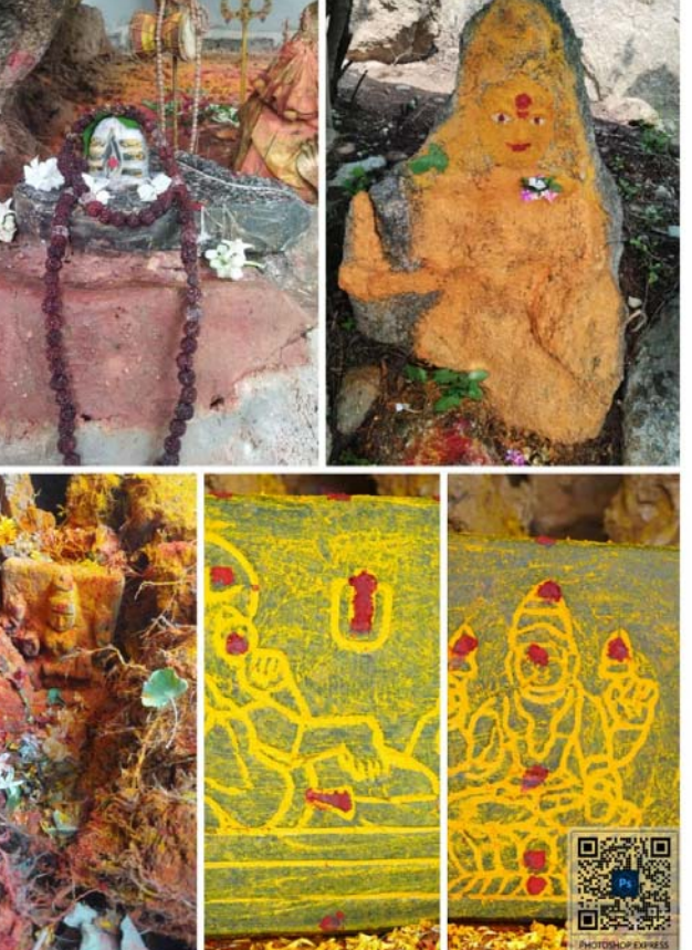
జరిగింది. విష్ణుమూర్తి లక్ష్మీదేవి వెలసిన విషయం తెలిసి గండేపల్లి, నేరేడుచర్ల, మాజూర్లగల్ మండలాల నుండి భక్తులు అధిక సంఖ్యలో దర్శనం కోసం పాల్గొంటున్నారు.