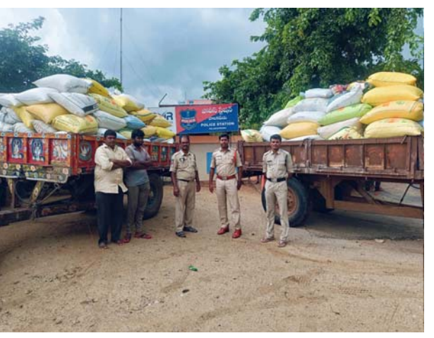
సమోదా చేసి దర్యాప్తు చేస్తున్నామని తెలిపారు.