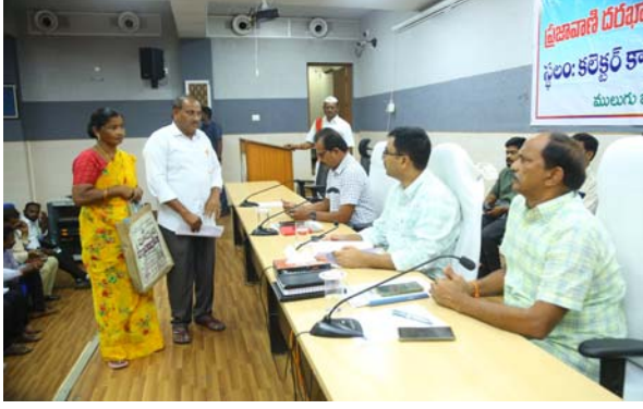
డి ఎం డి సి ఎస్ ఓ రాం పతి, డి.సి.ఓ. సర్దార్ సింగ్, ఎస్సీ కార్పొరేషన్ ఈ డి తుల రవి, డి ఈ ఓ పాణిని, సి పి ఓ ప్రకాష్, ఇతర అధికారులు, తదితరులు పాల్గొన్నారు.

- ప్రజావాణికి 26 దరఖాస్తులు - జిల్లా కలెక్టర్ దివాకర టి.ఎన్ ములుగు జిల్లా, అక్టోబర్ 07 (తీనూర్ న్యూస్): ప్రజా సమస్యల సత్కర్షణ పరిష్కారం కోసం ప్రజావాణి కార్యక్రమం నిర్వహిస్తున్నట్లు జిల్లా కలెక్టర్ దివాకర టి.ఎన్. తెలిపారు. సోమవారం కలెక్టర్ టి సమావేశ మందిరంలో నిర్వహించిన ప్రజావాణి కార్యక్రమంలో వివిధ ప్రాంతాలకు చెందిన 26 మంది దరఖాస్తు దారుల వద్ద నుండి అదనపు కలెక్టర్లు సి హెచ్ మహేందర్ జి, సంపత్ రావు లతో కలిసి స్వీకరించారు. అట్టి దరఖాస్తులను సత్కర్షణ పరిష్కారాలను సంబంధిత అధికారులకు ఆదేశించారు. ప్రజావాణి కార్యక్రమంలో 26 దరఖాస్తులు రాగా 13 భూ సమస్యలకు సంబంధించినవి 2 ఉపాధి కల్పించుటకు, 3 లోన్లు మంజూరు కోరుతూ, 8 ఇతరములు వచ్చినవని వారు తెలిపారు. ఈ కార్యక్రమంలో డి సి ఎస్ ఓ షహ పైసల్ హుస్సేన్,