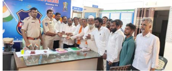
ప్రత్యేక అభినందనలు తెలిపారు. ఈ సందర్భంగా సీబి మరియు ఎసిబిల మాట్లాడుతూ ప్రతి గ్రామాలలో సీసీ కెమెరాల ఏర్పాటు చేసుకోవాలని ఒక్కో సీసీ కెమెరా 100 మంది పోలీసులతో సమాన మని శాంతి భద్రతలు కల్పిస్తుందని ఈ సందర్భంగా వారు అన్నారు.