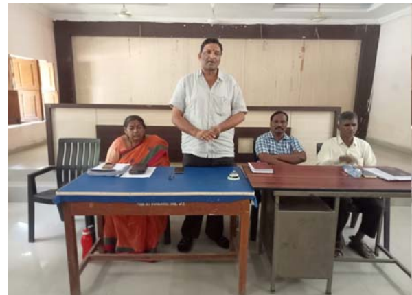
పంచాయతీ కార్యదర్శులు తదితరులు పాల్గొన్నారు.