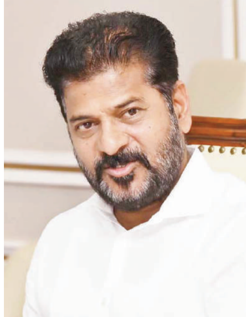
తెలంగాణ ఉద్యమంలో ఆయనది కీలక పాత్ర. ఆయన లేకుండా ఉద్యమాన్ని చూడలేం. అందుకే తొలి ప్రాధాన్యం ఆయనకే ఉంటుందని అంటున్నారు. అలాగే ఆయనకు కీలకమైన విద్యారంగాన్ని కేటాయించే అవకాశం ఉంది.

మొదటి పేజీ తరువాయి ఢిల్లీ పర్యటనకు ప్రాధాన్యం ఉండనుంది. త్వరలోనే ఈ పత్రియ మరూ కానుందని అంటున్నారు. ఈ మేరకు ముహూర్తం ఖారెందనే సందేహాలకు ఔసనే సమాధానం వస్తోంది. సీఎం రేవంత్ రెడ్డి ఢిల్లీకి వెళ్లనున్న నేపథ్యంలో ఈ ఊహాగానాలు మరింత జోరందుకున్నాయి.