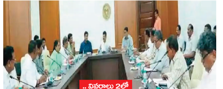
వివరాలు 2 లో

ప్రాణ నష్టం, ఆస్తి నష్టం తీవ్రతను తగ్గించేందుకు చర్యలు మంత్రి పాంగులేటి శ్రీనివాస్ వెల్లడి