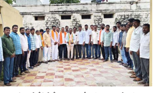
ఎత్తున బిజెపి పార్టీకి పార్టీ సభ్యత్వాలు తీసుకురావాలని, స్థానిక సంస్థల ఎన్నికల గెలుపే లక్ష్యంగా కార్యకర్తలు పని చేయాలని, తమ వంతు కర్తవ్యంతో బాత్ స్థాయి విజెంట్లు బాతులను బలోపేతం చేసే విధంగా పనిచేయాలని వలు సూచన సలహాలను తెలియజేశారు. ఇట్టి కార్యక్రమంలో బిజెపి పార్టీ రాష్ట్ర నాయకులు జిల్లా నాయకులు, మండల అధ్యక్షులు, బాత్ అధ్యక్షులు, కార్యకర్తలు తదితరులు పాల్గొన్నారు.