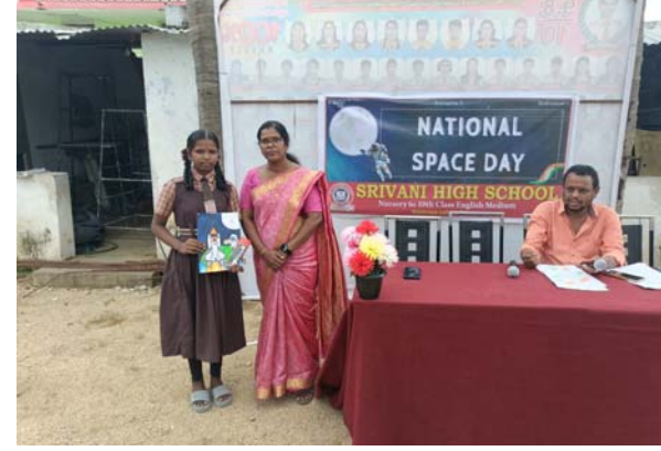
విద్యార్థులు తదితరులు పాల్గొన్నారు.

ఆత్మకూరు, ఆగస్టు 23 (తీనూర్ న్యూస్): వనపర్తి జిల్లా ఆత్మకూరు పట్టణ కేంద్రంలోని స్థానిక శ్రీవాణి హైస్కూల్లో శుక్రవారం మొదటి నేషనల్ స్పేస్ డే ను ఘనంగా నిర్వహించారు. ఇట్టి కార్యక్రమంలో భాగంగా గత సంవత్సరం ఇన్స్ ఠా ప్రవేశ్తలు పంపిన చంద్రయన్ 3 విజయవంతంగా చంద్రునిపై ఆగస్టు 23 2023 తేదీన చేరడంతో భారత ప్రభుత్వం ఆగస్టు 23న నేషనల్ స్పేస్ డే ప్రకటించిన సందర్భంగా మొట్టమొదటి నేషనల్ స్పేస్ డే ను శ్రీవాణి హై స్కూల్ పాఠశాల విద్యార్థిని విద్యార్థులు ఘనంగా నిర్వహించారు. ఈ కార్యక్రమంలో పాఠశాల విద్యార్థులకు డ్రాయింగ్ పోటీలు నిర్వహించారు. ఇట్టి పోటీలో 30 మంది విద్యార్థులు పాల్గొని విద్యార్థులు ప్రదర్శించిన చిత్రాలను సేకరించి మంచి ప్రతిభను ఘనపరిచిన విద్యార్థికి పాఠశాల ప్రిన్సిపల్ బహుమతులతో అభినందించారు. ఈ కార్యక్రమంలో ప్రిన్సిపాల్ ఉపాధ్యాయులు తల్లిదండ్రులు విద్యార్థిని