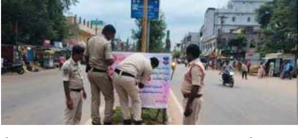
చేయటం - జరిమానా విధించటం జరుగుతుందని తెలియజేస్తున్నాము.