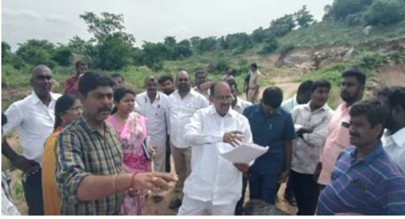
భవనాలను తిరిగి వాడకంలోకి తెచ్చి ప్రభుత్వ కార్యాలయాల ఏర్పాటుకు అనుగుణంగా వాడుకోవాలన్నారు.

దామెర, ఆగస్టు 16 (తీనూర్ న్యూస్): ప్రభుత్వ భూములను, ఆస్తులను గుర్తించి ప్రజా ప్రయోజనాలకు ఉపయోగపడేలా కృషి చేస్తానని పరకాల శాసనసభ్యులు రేపూరి ప్రకాష్ రెడ్డి అన్నారు. దామెర మండల కేంద్రంలో గల ప్రభుత్వ భూములను శుక్రవారం అధికారులతో కలిసి పరకాల శాసనసభ్యులు రేపూరి ప్రకాష్ రెడ్డి పరిశీలించారు. గత పాలకుల నిర్లక్ష్యం వలన కొన్ని ఆస్తులు భూములు విధ్వంసానికి గురైనదని, వాటిని తిరిగి ఉపయోగించేలా చర్యలు చేపట్టాలని అధికారులను ఆదేశించారు. ప్రభుత్వ భూములను గుర్తించి, నూతన ప్రభుత్వ కార్యాలయాల నిర్మాణాలకు అనుగుణంగా నివేదికలు తయారు చేయాలన్నారు. ల్యదల్ల గ్రామ సమీపంలో నిరుపయోగంగా ఉన్న