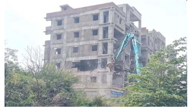
సుమారు 51 అక్రమ నిర్మాణాలను తొలగించారు. ప్రభుత్వ స్థలాల్లో నిర్మాణాలు చేపడితే, చెరువు కట్టలకు పాల్పడితే ఊరకొమ్మని హైద్రా కమిషనర్ ఏపీ రంగనాథ్ వార్నింగ్ ఇచ్చారు.

హైదరాబాద్: నగరంలో అక్రమ నిర్మాణాలపై హైద్రా(హైదరాబాద్ డిజాస్టర్ రెస్పాన్స్ అండ్ ఆపెట్స్ మానిటరింగ్ అండ్ ప్రొటెక్షన్) కోర్టు రుఖిపిస్తోంది. బాచుపల్లి ఎర్రకుంట పరిధిలో అక్రమ నిర్మాణాల కూల్చివేతలు చేపట్టారు. హైద్రా కమిషనర్ రంగనాథ్ ఆదేశాల మేరకు చర్యలు ప్రారంభించారు. నిబంధనలకు విరుద్ధంగా నిర్మిస్తున్న భవనాలను నేలమట్టం చేస్తున్నారు. ఉదయం నుంచి కూల్చివేతలు కొనసాగుతున్నాయి. కాగా, నగరంలో అక్రమణలకు సంబంధించి ప్రజల నుంచి పెద్ద సంఖ్యలో హైద్రాకు ఫిర్యాదులు వస్తున్నాయి. ఈ క్రమంలో నగర శివారులో చెరువులు అక్రమించి నిర్మాణాలు చేపట్టిన కట్టడాలపై హైద్రా అధికారులు దృష్టి సారించారు. కుత్బుల్లాపూర్ నియోజకవర్గంలోని గాజులూరాపూర్, దేవదర్ననగర్లలో హైద్రా ఆధ్వర్యంలో గతవారం అక్రమ నిర్మాణాలను కూల్చివేసిన సంగతి తెలిసింది. 329, 342 సర్వే సంబద్ధంలోని ప్రభుత్వ భూముల్లో వెలిసిన