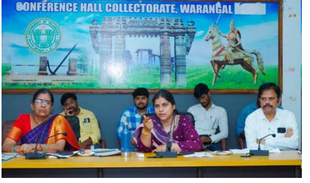
హోమియో, సిద్ధ, యోగ, నేచురోపతి వంటి అన్ని ఆస్పత్రులు, క్లినిక్కులు కూడా తప్పనిసరిగా రిజిస్ట్రేషన్ చేయించుకోవాలని టేనిస్ పేనాలిటీ, సీజ్ చేయడం, అటువంటి క్లినిక్కులు, ఆసుపత్రులపై చట్టప్రకారం కఠిన చర్యలు తీసుకోవటానికి తెలిపారు.