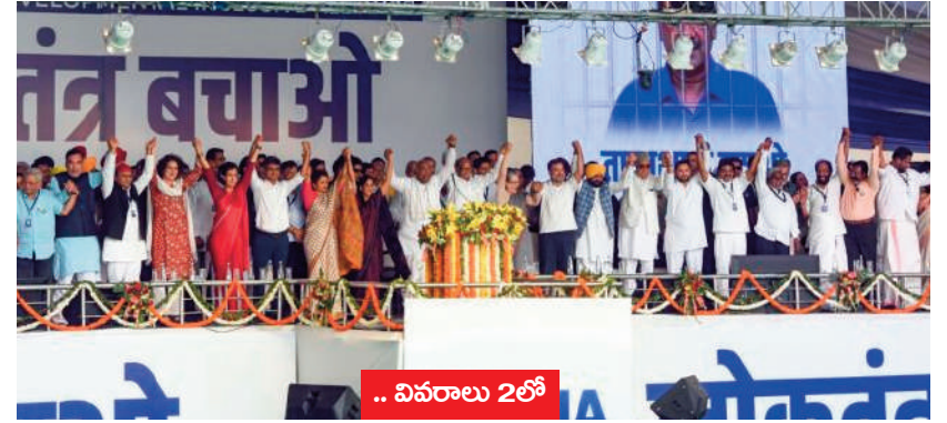
.. వివరాలు 2లో

జంతర్ మంతర్ వద్ద ఇండియా కూటమి అధ్యక్షులలో ర్యాలీ