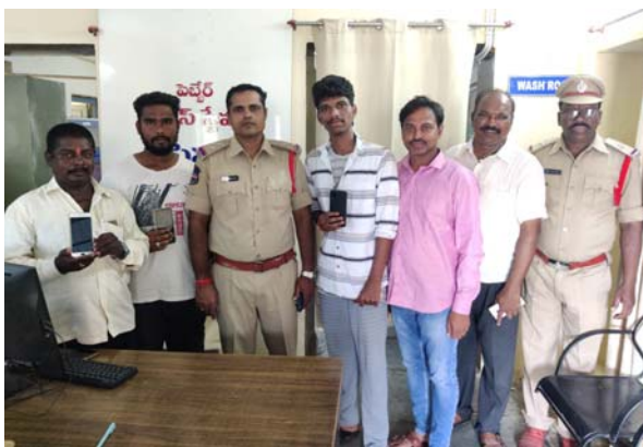
పయోగపడిందని తిరిగి మొబైల్ ను ఎన్ఐ చేతుల మీదుగా తీసుకోవడంతో వారికి ప్రత్యేకంగా ధన్యవాదాలు తెలియజేశారు.

పెట్టేరు, జూలై 30 (తీనూర్ న్యూస్): పెట్టేరు మండల పోలీస్ స్టేషన్ పరిధిలోని మండల కేంద్రానికి చెందిన ముగ్గురు వ్యక్తులు పోగొట్టుకున్న మొబైల్ ఫోన్లను మంగళవారం బాధితులకు ఎన్ఐ హరిప్రసాద్ రెడ్డి అందజేశారు. ఎన్ఐ తెలిపిన వివరాల ప్రకారం పట్టణ కేంద్రానికి చెందిన ముగ్గురు వ్యక్తులు దాదాపు కొన్ని రోజుల క్రితం వారి మొబైల్ ఫోన్ పోగొట్టుకున్నారు. బాధితులు సీఈఐఆర్ పోర్టల్ ద్వారా ఫిర్యాదు చేయగా వారి మొబైల్ ఫోన్ ను గుర్తించి దాన్ని స్వాధీనం చేసుకుని బాధితులకు పోలీస్ స్టేషన్ లో అప్పగించినట్లు ఆయన తెలిపారు. ఎవరైనా సెల్ ఫోన్ పోగొట్టుకున్నట్లయితే వివరాలను సీఈఐఆర్ పోర్టల్ నమోదు చేస్తే ఫోన్లను గుర్తించడానికి అవకాశం ఉంటుంది. అంతేకాకుండా ఎవరికైనా మొబైల్ ఫోన్ల దొంగిలడి వాటిని వెంటనే పోలీస్ స్టేషన్ లో అందించాలని ఎన్ఐ హరిప్రసాద్ రెడ్డి కోరారు. మొబైల్ టిడిఎ తమ చేతికి వచ్చినందుకు సీఈఐఆర్ పోర్టల్ చాలా ఉ