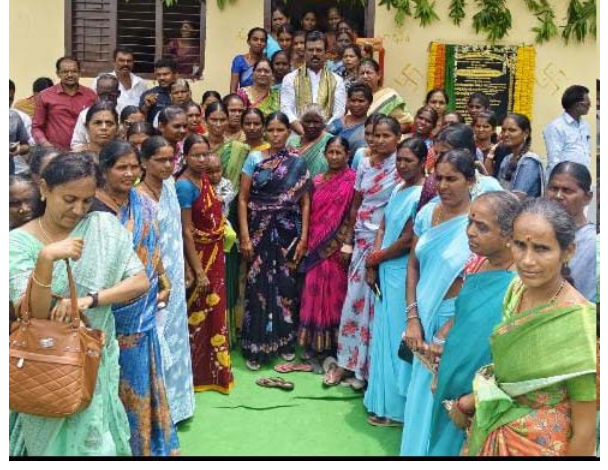
మహబూబ్ నగర్ జిల్లా ప్రతినిధి, జూలై 02(తీవ్రార్ న్యూస్): గ్రామీణ మహిళలు పారిశ్రామిక వేత్తలుగా ఎదగాలిని, ప్రజాపాలన ప్రభుత్వంలో మహిళా సంఘాలకు పెద్ద పీట వేస్తామని, మహిళా సంక్షేమం కాంగ్రెస్ తోనే సాధ్యమని దేవరకల్ల ఎమ్మెల్యే జి.మధుసూదన్ రెడ్డి అన్నారు. వనపర్తి జిల్లా మదనాపూరం మండల కేంద్రంలో మహిళా సమాఖ్య భవనాన్ని అధికారులు, మహిళా సోదరీమణులతో కలిసి ప్రారంభించిన దేవరకల్ల ఎమ్మెల్యే జి.మధుసూదన్ రెడ్డి, అనంతరం దంతసూరు ఫంక్షన్ హాల్ లో మండల కాంగ్రెస్ పార్టీ అధ్యక్షుడు నాగన్న అధ్యక్షులలో