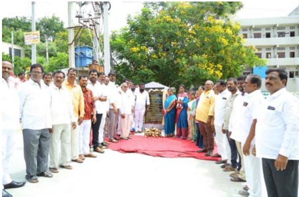
సంబంధిత ప్రభుత్వ అధికారులు, మండల ప్రజాప్రతినిధులు, మాజీ ప్రజాప్రతినిధులు, ఆయా గ్రామాల పెద్దలు, కాంగ్రెస్ పార్టీ నాయకులు, కార్యకర్తలు, తదితరులు పాల్గొన్నారు.