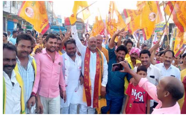
కార్యకర్తలు అభిమానులు మహిళలు అధిక సంఖ్యలో పాల్గొన్నారు.