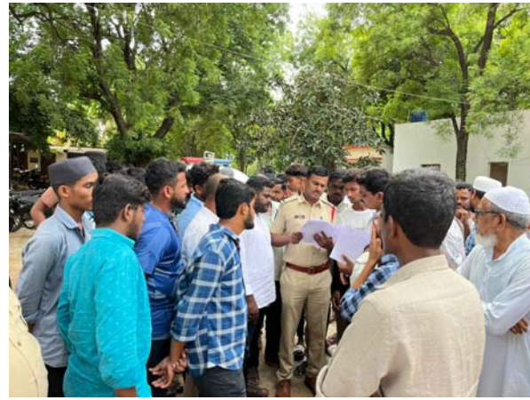
అత్యుక్తార్, జూన్ 29(తీనాద్రి న్యూస్): సోషల్ మీడియాలో తప్పుడు వార్తలు ప్రచారం చేసిన వ్యక్తిపై కేసు నమోదు చేయాలని పోలీసులకి పిర్యాదు చేసిన ఘటన వనపర్తి జిల్లా, అత్యుక్తారు మండల కేంద్రంలో చోటుచేసుకుంది. అత్యుక్తార్ పట్టణానికి చెందిన ఎంపీ నమద్ అత్యుక్తారు తాజా వార్త గ్రూపులో మత విద్వేషాలు మతకలహాలు

- చేస్తున్న వ్యక్తిపై కేసు నమోదు చేయాలని పోలీసులకి పిర్యాదు