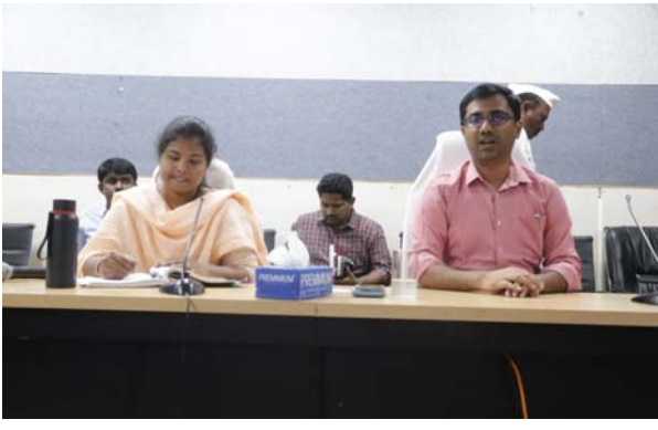
పొలాలను దృష్టిలో ఉంచుకుని ఎలాంటి పంటలు వేస్తే రైతులకు అధిక దిగుబడి వస్తుందో అనే విషయాలను కూడా తెలుసుకోవాలని సూచించారు. ఈ కార్యక్రమంలో తాడ్యాయి, ఏటూరు నాగారం, కన్యాయిగూడెం, మంగపేట, వాజేడు, వెంకటాపురం, మండలాల మండల సెప్టెంబర్ అఫీసర్ లు, ఎంపీటీవోలు, ఎంఈఓ లు, ప్రాథమిక ఆరోగ్య కేంద్రాల మెడికల్ అఫీసర్స్ తదితరులు పాల్గొన్నారు.