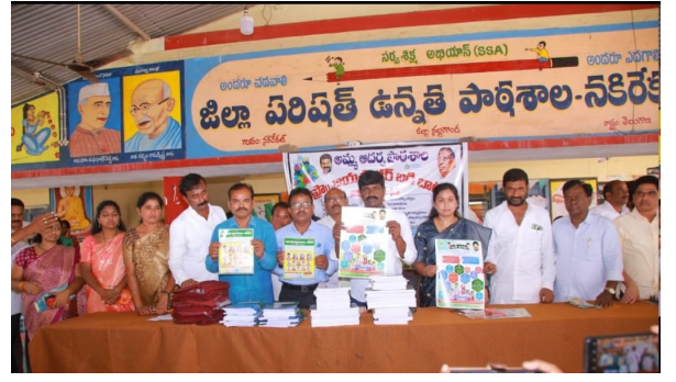
ఉపాధ్యాయ బృందాలు, విద్యార్థులు, తదితరులు పాల్గొన్నారు.