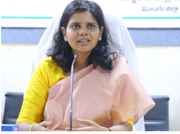
ఎవరైనా ఉల్లంఘించిన వారిపై కఠిన చర్యలు తీసుకోబడతాయని కలెక్టర్ తెలిపారు.