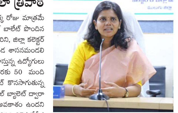
ములుగు, మే 24 (తీవ్రార్ న్యూస్): పోస్టల్ బాలేట్ వినియోగానికి ఒక్క రోజు మాత్రమే మిగిలి ఉందని, ఓటు హక్కు ప్రాధాన్యతను దృష్టిలో ఉంచుకుని పోస్టల్ బాలేట్ పొందిన ప్రతి ఒక్కరు ఓటు హక్కు వినియోగించుకోవాలని జిల్లా ఎన్నికల అధికారిని, జిల్లా కలెక్టర్ ఇలా త్రిపాఠి నేడు ఒక ప్రకటనలో తెలిపారు.

ములుగు, మే 24 (తీవ్రార్ న్యూస్): పోస్టల్ బాలేట్ వినియోగానికి ఒక్క రోజు మాత్రమే మిగిలి ఉందని, ఓటు హక్కు ప్రాధాన్యతను దృష్టిలో ఉంచుకుని పోస్టల్ బాలేట్ పొందిన ప్రతి ఒక్కరు ఓటు హక్కు వినియోగించుకోవాలని జిల్లా ఎన్నికల అధికారిని, జిల్లా కలెక్టర్ ఇలా త్రిపాఠి నేడు ఒక ప్రకటనలో తెలిపారు. వరంగల్ ఖమ్మం నల్గొండ శాసనమండలి పట్టణాల్లో ఉప ఎన్నికల సందర్భంగా ములుగు జిల్లాలో విధులు నిర్వహిస్తున్న ఉద్యోగులు కలెక్టరేట్ లో ఎన్నికల పేపర్ ఫెసిలిటీస్ సెంటర్ నందు శుక్రవారం వరకు 50 మంది పోస్టల్ బాలేట్ వినియోగించుకున్నట్లు తెలిపారు. శనివారం కూడా కలెక్టరేట్ కొనసాగుతున్న ములుగు జిల్లా పరిధిలో ఎన్నికల విధులు కేటాయించిన సిబ్బందికి పోస్టల్ బ్యాలెట్ ద్వారా ఓటు వేసే అవకాశం కల్పించామని అన్నారు. శనివారం ఒక్క రోజే అవకాశం ఉందని తప్పనిసరిగా ఓటు వేయాలని అన్నారు. పోస్టల్ బాలేట్ పొందిన ఓటరు తిరిగి 27వ తేదీన జరుగనున్న పోలింగ్ ప్రక్రియలో ఓటు హక్కు వినియోగానికి అవకాశం లేదని తెలిపారు. జిల్లాలోని శాఖల వారిగా అధికారులు పోస్ట్ చేసి సిబ్బంది ఓటు హక్కు వినియోగించుకునే విధంగా కృషి చేయాలని అన్నారు. ఉదయం 9 గంటల నుండి సాయంత్రం 5 గంటల వరకు ఓటు హక్కు వినియోగానికి సమయం ఉన్నట్లు కలెక్టర్ తెలిపారు.