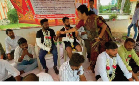
బాధితుల సర్వకా సాగృహిస్తున్నట్లు వినిపింది. వీసీపై సీట్ల కేటాయింపులో అక్రమ.. అవినీతి ఆరోపణలు వీసీపై సీట్ల కేటాయింపులోనూ అక్రమాలకు పాల్పడినట్లు అరోపణలు ఉన్నాయి. అనర్దులకు సీట్లు కేటాయింపారని గతంలో విద్యార్థి