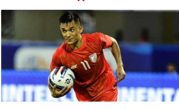
ఉడ్ లైక్ టు సే నమ్ థింగ్' అనే క్యాప్షన్ ను జతచేశాడు.

భారత్ కు చెందిన ప్రముఖ వుట్ బాల్ డిగ్జం, భారత వుట్ బాల్ జట్టు కెప్టెన్ సునీల్ ఛెత్రి రిటైర్మెంట్ ప్రకటించాడు. అంతర్జాతీయ వుట్ బాల్ నుంచి తాను రిటైర్ అవుతున్నానని ఛెత్రి ప్రకటించారు. వచ్చే నెల 6న కోల్కతాలో కువైట్ తో జరగనున్న ఫిఫా వరల్డ్ కప్ అర్హత మ్యాచ్ తనకు ఆఖరి మ్యాచ్ అని ఆయన పేర్కొన్నారు. ఈ మేరకు సునీల్ ఛెత్రి తన సోషల్ మీడియా ఖాతాల్లో ఒక వీడియోను పోస్టు చేశారు. సునీల్ ఛెత్రి తన 20 ఏళ్ల కెరీర్ లో భారత్ తరఫున 145 అంతర్జాతీయ మ్యాచ్ లు ఆడాడు. కెరీర్ మొత్తంలో 93 గోల్స్ సాధించాడు. సునీల్ ఛెత్రి పోస్టు చేసిన 9.51 నిమిషాల నిడివిగల ఎమోషన్ వీడియో ఇప్పుడు ఇంటర్నెట్ లో వైరల్ గా మారింది. తన వీడియోకు ఛెత్రి 'ఐ