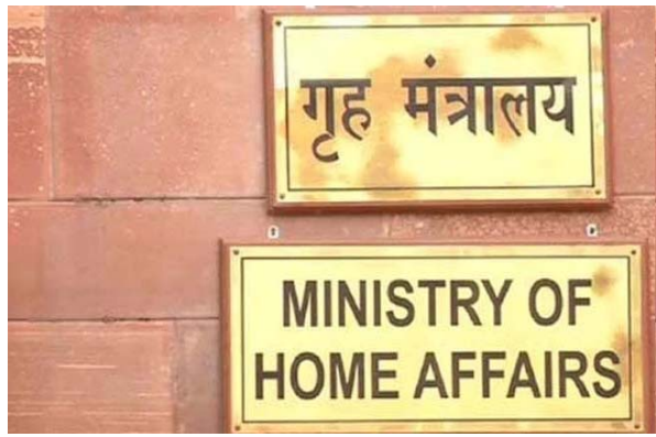
ఈ మూడు దేశాల నుంచి మన దేశానికి వచ్చిన హిందువులు, క్రైస్తవులు, సిక్కులు, జైనులు, బౌద్ధులు, పార్సీలకు ఇవి పర్మిట్లు. దరఖాస్తు ప్రక్రియ అంతా ఆన్లైన్లోనే ముగుస్తుంది.

దిల్లీ: లోక్ సభ ఎన్నికల వేళ కేంద్ర ప్రభుత్వం పౌరసత్వ సవరణ చట్టం-2019 ' అమలు ప్రక్రియను వేగవంతం చేసింది. ఇందులో భాగంగా ఆన్లైన్ దరఖాస్తు చేసుకున్నవారికి తొలి విడతలో 14 మందికి భారత పౌరసత్వం మంజూరు చేసింది. ఈ మేరకు కేంద్ర హోంశాఖ కార్యదర్శి అజయ్ కుమార్ భట్టా దిల్లీలో వారికి సీపీఎ కింద జారీ అయిన పౌరసత్వ సర్టిఫికేట్లను అందజేశారు. దేశంలో సీపీఎ అమలుపై ఈ ఏడాది మార్చిలో కేంద్ర ప్రభుత్వం నోటిఫికేషన్ జారీ చేసిన విషయం తెలిసిందే. 2019 డిసెంబర్లో ప్రతిపక్షాల తీవ్ర నిరసనల మధ్య సీపీఎ చట్టం -2019 పార్లమెంటు ఉభయసభల్లో ఆమోదం పొందగా.. దీనికి రాష్ట్రపతి సమ్మతి కూడా లభించింది. సీపీఎ చట్టం ప్రకారం.. పాకిస్తాన్, బంగ్లాదేశ్, అఫ్ఘానిస్తాన్ల నుంచి వలస వచ్చిన ముస్లింలకు కరణార్థం వద్ద తగిన పత్రాలు లేకపోయినా వారికి సత్కరమే భారత పౌరసత్వాన్ని ఇచ్చేలా కేంద్రం నిబంధనల్ని రూపొందించింది. 2014 డిసెంబరు 31 కంటే ముందు