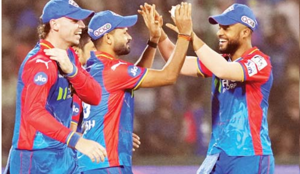
అయితే.. నవీన్ శర్ హక్ బౌలింగ్లో భారీ షాట్ ఆడి బౌండరీ వద్ద పూర్వ చేతికి దొరికాడు. ఆ తర్వాత షారు హామ్(38) అండగా పోరల్ స్కోర్ బోర్డును పరుగులు పెట్టించాడు. బౌలర్ మానినా బంతి లక్నో బౌండరీయే అన్నట్లుగా చిచ్చరేపిడుగు చెలరేగాడు. హెంకా సైతం ధనా ధన్ ఇన్నింగ్స్ తో రాణించడంతో వీరిద్దరూ రెండో వికెట్కు 92 పరుగులు జోడించారు. ప్రమాదకరంగా మారుతున్న ఈ ద్వయాన్ని బిష్ఫోరు విడదీశాడు. హామ్ బెటయ్యూక్ క్రీజులోకి వచ్చిన కెప్టెన్ రిషభ్ పంత్(33) అచితుచి అడాడు. ఆ తర్వాత క్రీజ్లో నిలడక్కకున్నాక బ్యాట్ రుఖిపించాడు. 23బంతుల్లో 5ఫోర్లు సాయంతో 33పరుగులు చేసి నవీన్-శర్-హక్ బౌలింగ్లో బెటయ్యూడు. చివరో స్టట్స్(57నాటౌట్) 25బంతుల్లో 3ఫోర్లు, 4సీక్వర్లు, అక్షర్ పటేల్(14నాటౌట్) రాణించడంతో ఢిల్లీ జట్టు భారీస్కోర్ నమోదు చేసింది. ఈ సీజన్లో ఢిల్లీ జట్టుకు ఇదే ఆఖరి మ్యాచ్ కాగా.. ఆ జట్టు 12పాయింట్లతో 6వ స్థానంలో కొనసాగుతోంది. లక్నో బౌలర్లు నవీన్-శర్ హక్కు రెండు, బిష్ఫోరు, అర్షద్ ఖాన్లకు ఒక్కో వికెట్ దక్కాయి. స్కోర్బోర్డు ఢిల్లీ క్యాపిటల్స్ ఇన్నింగ్స్: ఫ్రేజర్ (సి)నవీన్-శర్-హక్ (బి)అర్షద్ ఖాన్ 0, అభిషేక్ పోరల్ (సి)పూర్వ (బి)నవీన్-శర్-హక్ 58, హెంకా (సి)రాహుల్ (బి)రవి బిష్ఫోరు 38, రిషభ్ పంత్ (సి)దీపక్ చాదా (బి)నవీన్-శర్-హక్ 33, స్టట్స్ (నాటౌట్) 57, అక్షర్ పటేల్ (నాటౌట్) 14, అదనం 8, (20 ఓవర్లలో 4వికెట్ల నష్టానికి) 208పరుగులు. వికెట్ల పతనం: 1/2, 2/94, 3/111, 4/158 బౌలింగ్: అర్షద్ ఖాన్ 3-0-45-1, ముమిసిన్ ఖాన్ 4-0-29-0, యుద్ధవీర్ సింగ్ 2-0-28-0, నవీన్-శర్-హక్ 4-0-51-2, రవి బిష్ఫోరు 4-0-26-1, కృనాల్ పాండ్య 2-0-20-0, దీపక్ చాదా 1-0-9-0