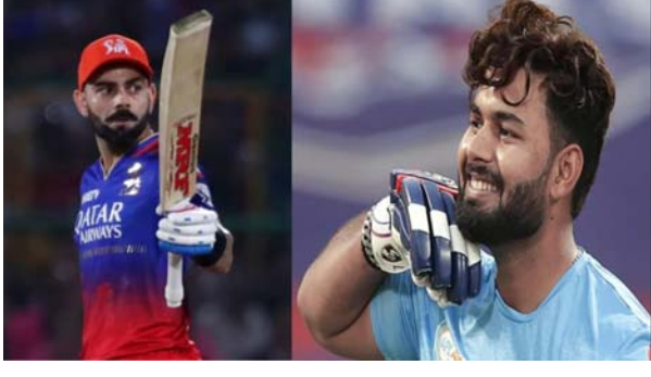
వెంటనే పంత్ వెళ్లి కూర్చోన్నాడు. తరువాత తాను కూర్చున్నట్లుగా సైగ్ చేశాడు. ఇందుకు సంబంధించిన వీడియో ప్రస్తుతం సోషల్ మీడియాలో వైరల్ గా మారింది. దీనిపై నెటిజన్లు సరదాగా కామెంట్లు చేస్తున్నారు. వద్దు కోహ్లి భయం.. ఇప్పటికే సంవత్సరం దాటిపోయింది.. పంత్ను ప్రపంచకప్ ఆడనివ్వు అని అంటున్నారు. రోడ్డు ప్రమాదం కారణంగా 16 నెలలు టీమ్ఇండియాకు దూరంగా ఉన్న పంత్ టీ20 ప్రపంచకప్కు ఎంపికైన సంగతి తెలిసిందే. విరాట్ కోహ్లి, రోహిత్ శర్మ వంటి సీనియర్ ఆటగాళ్లు ఇదే చివరి టీ20 ప్రపంచకప్ అని ప్రచారం జరుగుతోంది. దీంతో ఎలాగైనా సరీ పొట్టి ప్రపంచకప్లో భారత్ విజయం సాధించాలని సగటు భారత క్రికెట్ ఫ్యాన్స్ కోరుకుంటున్నారు.

పరుగుల యంత్రం రికార్డుల రారాజు విరాట్ కోహ్లి మైదానంలో ఎలా ఉంటాడో ప్రత్యేకంగా చెప్పాల్సిన పని లేదు. రిషభ్ పంత్ మాత్రం పరిస్థితులతో దాదాపుగా సంబంధం లేకుండా చాలా సరదాగానే కనిపిస్తుంటాడు. ఇక టీమ్ఇండియా తరుపున కలిసిన ఆడుతున్న పంత్, కోహ్లిల మధ్య చాలా చక్కని స్నేహ బంధం ఉంది. ఐపీఎల్లోనూ ఇది కనిపిస్తూనే ఉంటుంది. ఆదివారం (మే 12న) చిన్నస్వామి వేదికగా రాయల్ ఛాలెంజర్స్ బెంగళూరుతో ధిల్లీ క్యాపిటల్స్ తలపడింది. ఈ మ్యాచ్లో ఆరెంజీ మొదట బ్యాటింగ్ చేసింది. నిర్ణీత 20 ఓవర్లలో 9 వికెట్లు కోల్పోయి 187 పరుగులు చేసింది. బెంగళూరు బ్యాటర్లలో రజత్ పాటిదార్ (32 బంతుల్లో 52), విల్ జాక్స్ (29 బంతుల్లో 41), కామెరాన్ గ్రీన్ (24 బంతుల్లో 32), విరాట్ కోహ్లి (13 బంతుల్లో 27) లు రాణించారు. లక్నో ఛేదనలో ధిల్లీ క్యాపిటల్స్ 19.1 ఓవర్లలో 140 పరుగులకే కుప్పకూలింది. దీంతో ఆరెంజీ 47 పరుగుల తేడాతో విజయం సాధించింది. స్కో ఓవర్ కారణంగా ఓ మ్యాచ్ నిషేధం పడడంతో ధిల్లీ క్యాపిటల్స్ కెప్టెన్ అయిన రిషభ్ పంత్ ఈ మ్యాచ్లో ఆడలేదు. కాగా.. ఈ మ్యాచ్లో ఓ సరదా సన్నివేశం చోటు చేసుకుంది. ఆరెంజీ ఇన్నింగ్స్ సందర్భంగా విరాట్ కోహ్లి బ్యాటింగ్ చేస్తున్న సమయంలో డ్రెస్సింగ్ రూమ్ వద్ద ఉన్న పంత్ బాల్యాటిలోకి వచ్చి కోహ్లి మాస్తా నవ్వుతూ ఉన్నాడు. దీన్ని గమనించిన కోహ్లి కాస్త కోపాన్ని ప్రదర్శిస్తూ నవ్వడం ఆపి వెళ్లి కూర్చో.. లేదంటే బ్యాట్తో కాడతా అన్నట్లు పైగ్ చేశాడు.