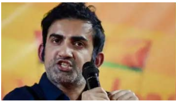
'ఏబీ డివిలియర్స్, కెవిన్ పీటర్సన్లను ఇతర కెప్టెన్లతో పోలిస్తే.. పరిస్థితి దారుణంగా ఉంటుంది. వ్యక్తిగత సోర్లతో డివిలియర్స్ కమ్మన గెలిపించిన సందర్భాలు లేవు. పీటర్సన్ కూడా అంతే. హార్దిక్ పాండ్యకు అలాంటి పరిస్థితి లేదు. గుజరాత్ ట్రైటాన్స్ జట్టును అతడు విజేతగా నిలిపాడు. కాబట్టి మీరు ఆరెంజీలను ఆరెంజీలతోనే పోల్చాలి. యాపిల్తో ఆరెంజీలను పోల్చకూడదు. ఇకనైనా హార్దిక్ను ఎగతాళి చేయడం, విమర్శించడం ఆపిస్తే మంచిది' అని గంభీర్ ఘాటుగా బదులిచ్చాడు.

ఐపీఎల్ 2024లో ముంబై ఇండియన్స్ షేఆఫ్స్ చేరకుండానే నిష్క్రమిస్తున్న విషయం తెలిసిందే. ముంబై ఇప్పటి వరకు ఆడిన 13 మ్యాచుల్లో కేవలం నాలుగు విజయాలను మాత్రమే నమోదు చేసి.. 9 పరాజయాలతో మూల్యం చెల్లించుకుంది. మే 17న లక్నోతో లీగ్ చివరి మ్యాచ్ ఆడి.. ఇంటిదారి పడుతుంది. లీగ్ ఆరంభం నుంచే కెప్టెన్ హార్దిక్ పాండ్యపై విమర్శలు వస్తున్నాయి. అభిమానులతో పాటు మాజీలు ముంబై సారథి హార్దిక్ను ఎగతాళి చేయడం. అతడి వ్యక్తిగత ప్రదర్శనను విమర్శించడంపై టీమిండియా మాజీ ఓపెనర్ గౌతమ్ గంభీర్ అసహనం వ్యక్తం చేశాడు. హార్దిక్ పాండ్య సారథ్యంపై మొత్తం 360 ఏబీ డివిలియర్స్, ఇంగ్లండ్ మాజీ కెప్టెన్ కెవిన్ పీటర్సన్ ఘాటుగా స్పందించిన సంగతి తెలిసిందే. ముఖ్యంగా ఏబీడీ ఘాటు వ్యాఖ్యలపై గౌతమ్ గంభీర్ కాంటర్ చేశాడు. ఆరెంజీలను ఆరెంజీలతోనే పోల్చాలని, యాపిల్తో ఆరెంజీలను పోల్చాద్దని గౌతమ్ కీలక వ్యాఖ్యలు చేశాడు. స్కోర్స్ కీడాలో గంభీర్ మాట్లాడుతూ ఏబీ డివిలియర్స్, కెవిన్ పీటర్సన్ కెప్టెన్లుగా ఉన్నప్పుడు ఎలాంటి ప్రదర్శన చేశారు. ఏబీడీ, కెవిన్ గొప్పగా ఏమీ ఆడలేదు. వారి గణంకాలను మీరు ఓసారి పరిశీలించండి. ఒక్కసారి కూడా టైటిల్ సెగ్గెన్ కెప్టెన్లు కాదు వారిద్దరు' అని అన్నాడు.