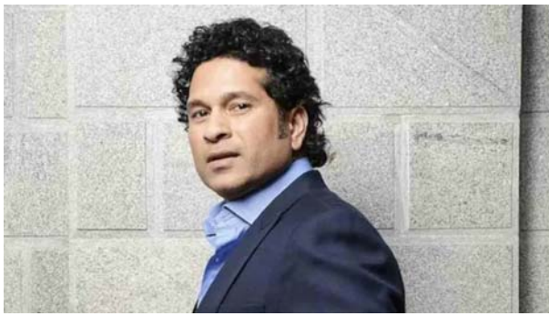
ద్వారా గుర్తించారు. కాస్తే మృతదేహానికి అలాపీ చేస్తున్నారు. వీవీఐపీకి సెక్యూర్టీ కల్పిస్తున్న వ్యక్తి ఆత్యహత్య చేసుకోవడం వల్ల ఎన్ఆర్పీఎఫ్ వ్యక్తిగతంగా ఈ కేసును దర్యాప్తు చేయనున్నది.

జలాల్: మాజీ క్రికెటర్ సచిన్ టెండూల్కర్కు భద్రత కల్పిస్తున్న దళంలోని స్టేట్ రిజర్వ్ పోలీస్ ఛోర్స్ జవాన్ ఆత్యహత్య పాల్పడ్డారు. జామ్షేర్ పట్టణంలోని తన స్వంత ఇంట్లో అతను కాల్చుకున్నట్లు తెలుస్తోంది. బలవన్పరణానికి పాల్పడిన ఆ పోలీసును ప్రకాశ్ కాష్టేగా గుర్తించారు. తన ఛార్జీకుల గ్రామానికి వెళ్లేందుకు అతను కొన్ని రోజుల నుంచి బీచ్లో ఉన్నట్లు తెలుస్తోంది. సర్వీస్ గన్తోనే తన మెడలో కాల్చుకున్నాడు. అతని వెంట వయసు ముగ్గురు పేరెంట్స్ ఉన్నారు. భార్య, ఇద్దరు పిల్లలు, ఓ సోదరుడు కూడా ఉన్నారు. బుధవారం రాత్రి 1.30 నిమిషాలకు అతను ఆత్యహత్య చేసుకున్నట్లు జామ్షేర్ పోలీసు స్టేషన్ ఇన్స్పెక్టర్ కిరణ్ షిండే తెలిపారు. సూసైడ్ వెనుక ఉన్న కారణాలను కనుగొనేందుకు పోలీసులు విచారణ చేపడుతున్నారు. వ్యక్తిగత కారణాల వల్ల ఆ జవాన్ బలవన్పరణానికి పాల్పడినట్లు ప్రాథమిక విచారణ