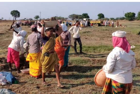
వాటర్ బాటిల్ ని తెచ్చుకొని తమ పనులను చేసుకుంటున్నారని ఆయన అన్నారు.