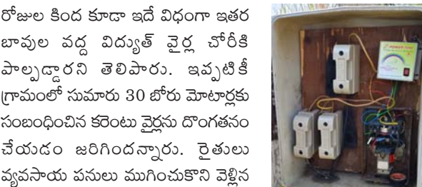
రోజుల కింద కూడా ఇదే విధంగా ఇతర భావుల వద్ద విద్యుత్ వైర్ల చోరీకి పాల్పడారని తెలిపారు. ఇప్పటికీ గ్రామంలో సుమారు 30 బోర్ మోటార్లకు సంబంధించిన కరెంటు వైర్లు దొంగతనం చేయడం జరిగిందన్నారు. రైతులు వ్యవసాయ పనులు ముగించుకొని వెళ్లిన అనంతరం అర్ధరాత్రి వేళలో గుర్తు తెలియని దుండగులు ఈ తరహా చోరీలకు పాల్పడుతున్నారని అన్నారు. భావుల వద్ద భద్రత లేకపోవడం అందుకాగా చేసుకునే దుండగులు ఇలాంటి దొంగతనాలకు పాల్పడుతున్నారని స్థానిక పోలీసులు చోరీకి పాల్పడిన వారిని గుర్తించి చర్యలు తీసుకోవాలని బాధిత రైతులు కోరుతున్నారు.