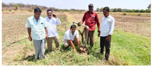
ఇబ్రహీంపట్నం, మే 03(తీనూర్ న్యూస్): రంగారెడ్డి జిల్లా, ఇబ్రహీంపట్నం మండలం, ఉప్పరగూడ గ్రామంలోని వ్యవసాయం భావుల వద్ద గుర్తు తెలియని దుండగులు బోర్ మోటార్ల విద్యుత్ వైర్ల చోరీకి పాల్పడుతున్నారని తెలిపారు. శుక్రవారం ఉదయం రైతులు పోలీసికి నీరు పెట్టేందుకు కరెంటు స్ట్రాగర్ వద్దకు వెళ్లి చూసేసరికి స్ట్రాగర్ నుండి మోటార్ వరకు ఉండే కరెంటు వైర్లు కట్ చేసి దొంగిలించబోయారని ఆవేదన వ్యక్తం చేశారు. గ్రామంలో రెండు