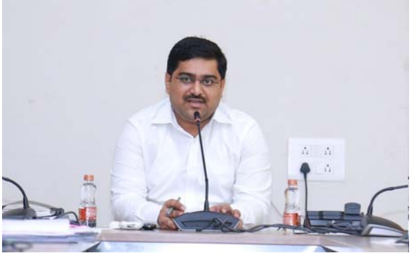
తీసుకోవాలని, " సువిధ " యావ్ ద్వారా రాజకీయ సభలు, ర్యాలీలు, వివిధ శాఖలు ఇవ్వాలి అనుమతులను నిబంధనల ప్రకారం సకాలంలో ఇచ్చేలా చర్యలు తీసుకోవాలని, నిబంధనల ప్రకారము జప్తు చేసిన నగదు, వస్తువులను స్వాధీనీయము, పోలింగ్ అధికారులు సమన్వయంతో సీజర్ యాస్ లో సమారు చేయాలని సూచించారు. నియోజకవర్గాలకు సంబంధించిన ఎంపిసి టీములు సమన్వయం చేసుకోవాలని సూచించారు. ఎండల తీవ్రత ఎక్కువగా ఉన్నది కాబట్టి ప్రతి ఒక్క పోలింగ్ కేంద్రాలలో ఓటర్లకు కాగనీరు సౌకర్యం, నీడ, ఫన్స్ ఎయిడ్ కిట్ ఉండాలని, సెలైన్ కిట్, ఓఆర్ఎస్, పాకెట్స్ ఉంచాలని, ఓటర్లకు ఎలాంటి ఇబ్బంది లేకుండా చూడాలని, ప్రత్యేకంగా దివ్యాంగులకు వీల్ చైర్ లను ఏర్పాటు చేసుకోవాలని సూచించారు. ప్రతి ఒక్కరు ఓటు వేసేలా స్వీప్ ప్రచార కార్యక్రమాలు ముమ్మరం చేయాలని, నోడల్ అధికారులు సమన్వయంతో ఎన్నికల ప్రక్రియను విజయవంతంగా పూర్తి చేయాలని అన్నారు. హీట్ వే ఉంది కాబట్టి అగ్నిమాపక సిబ్బంది అప్రమత్తంగా ఉండాలని సూచించారు.

భువనగిరి జిల్లా ప్రతినిధి, మే 03(తీనూర్ న్యూస్): ఎన్నికల నిబంధనలను పక్కంటిగా అమలు చేయాలని జిల్లా ఎన్నికల అధికారి, కలెక్టరు హనుమంతు కే.జేందగే నోడల్ అధికారులకు సూచించారు. శుక్రవారం నాడు కాన్పల్స్ హాలులో ఆయన నోడల్ అధికారులతో ఎన్నికల ఏర్పాట్లను సమీక్షిస్తూ ఎన్నికల నిబంధనలను ఖచ్చితంగా అమలు చేసేందుకు క్షేత్రస్థాయిలో అన్ని చర్యలను తీసుకోవాలని, నోడల్ అధికారుల విధి విధానాల మార్గదర్శకాల పట్ల క్షుణ్ణంగా అవగాహన కలిగి వుండాలని సూచించారు. ప్రతి ఒక్కరూ ఓటింగ్ లో పాల్గొనాలి, ఓటింగ్ శాతం పెరిగేలా స్వీప్ ప్రచార కార్యక్రమాలలో భాగస్వామ్యం కావాలని, పోలింగ్ సిబ్బందికి కావలసిన అన్ని రకాల మెటీరియల్ సిద్ధంగా ఉండాలని, ఎన్నికల నిబంధనల తరలింపే వాహనాల ఫిట్ నెస్ వరీక్షించి సిద్ధం చేయాలని, ఎన్నికల కోడ్ వర్కవేక్లిం చే టీములు ఎన్నికల ప్రవర్తనా నియమావళిని అతిక్రమించకుండా తగిన చర్యలు తీసుకోవాలని, "సి"విజిల్ యాస్ ద్వారా వచ్చే ఫిర్యాదులను వంద నిమిషాలలో పరిష్కరించేలా చర్యలు