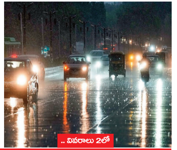
.. వివరాలు 2లో

రానున్న ఐదు రోజులపాటు ఉత్తర తెలంగాణలో మోస్తారు వర్షాలు రాష్ట్ర ప్రజలకు చల్లటి కబురు తెలిపిన వాతావరణ శాఖ