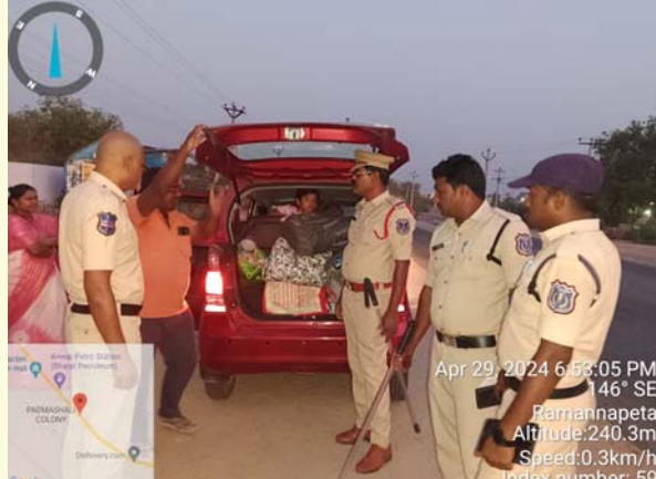
తనిఖీ నిర్వహిస్తున్న పోలీసులు