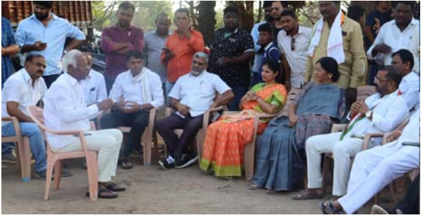
భారీగా తరలివచ్చి భవారంగ సభను విజయవంతం చేయాలనీ కోరారు. ఈ కార్యక్రమంలో ప్రజా ప్రతినిధులు, నాయకులు, కార్యకర్తలు తదితరులు పాల్గొన్నారు.