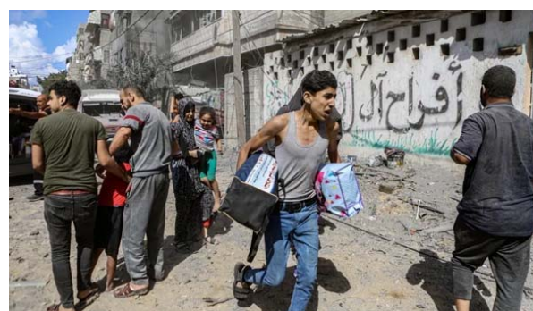
శిధిలాల కింద చిక్కుకుని ఉన్నారని అన్నారు.

టెల్ అవీవ్ : గాజాపై ఇజ్రాయిల్ దాడులు కొనసాగుతున్నాయి. గురువారం అర్ధరాత్రి గాజా నగరంలోని వాయువ్య ప్రాంతంలోని ఓ నివాస భవనం లక్ష్యంగా ఇజ్రాయిల్ వైమానిక దాడులు చేపట్టింది. ఈ దాడుల్లో 11 మంది మరణించినట్లు అధికారులు శుక్రవారం తెలిపారు. అల్-షిషాపై ఇజ్రాయిల్ చేపడుతున్న అమానుష దాడి బందోబాజీ చేరుకుంది. ఆస్పత్రి నుండి రోగులను తరలించడం ఇబ్బందికరంగా మారిందని అధికారులు తెలిపారు. వందలాది రోగులు, వైద్య సిబ్బందిని ఆస్పత్రిని వదిలి వెళ్లాలిందిగా ఇజ్రాయిల్ సైన్యం ఇటీవల ప్రకటించిన సంగతి తెలిసిందే. అల్-షిషా ఆస్పత్రి లోపలికి వెళ్లడం కష్టతరంగా ఉందని నివేది దిఫెన్స్ సిబ్బంది ప్రకటించింది. ఇప్పటికీ పరిస్థితి అందోళనకరంగానే ఉందని పేర్కొంది. పలువురు