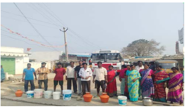
అధికారులు.. వారికి ట్యాంకర్ల ద్వారా నీటిని అందజేశారు

చేవెళ్ల: రంగారెడ్డి జిల్లా చేవెళ్ల మండలం ఆలూరు గ్రామంలోని దళిత వాడలో తీవ్ర నీటి ఎద్దడి ఉందని, సమస్యను పరిష్కరించాలని రోడ్డుపై జైలుయింది గ్రామస్థులు నిరసన తెలిపారు. ఈ సందర్భంగా వారు మాట్లాడుతూ.. గ్రామాల్లో ప్రత్యేక పాలన కొనసాగుతున్నందున ఎవరికి చెప్పాలో తెలియక, అధికారులు అందుబాటులో లేకపోవడంతో ఇబ్బందులు ఎదురవుతున్నాయని అన్నారు. మిషన్ భగీరథ నీళ్లు రాకపోవడంతో తీవ్ర ఇబ్బంది ఎదురైందని తెలిపారు. మార్పు నెలలోనే ఈ విధంగా ఉంటే ఏప్రిల్, మే నెలలో పరిస్థితి ఏంటని రాష్ట్ర ప్రభుత్వాన్ని ప్రశ్నించారు. కాగా, గ్రామస్థులు ఆందోళనతో స్పందించిన ప్రత్యేక