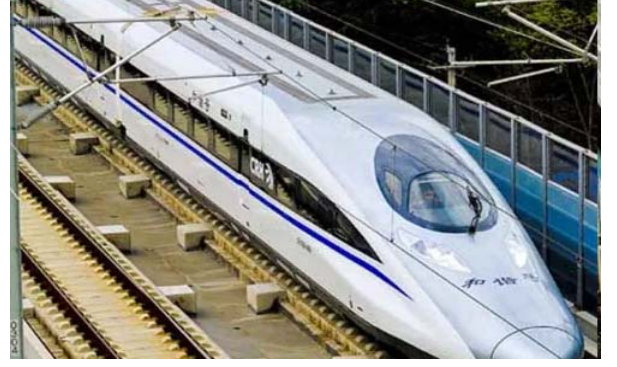
వాస్తవానికి ఈ ప్రాజెక్టు 2022లోనే పూర్తి కావాల్సి ఉన్నప్పటికీ, భూసేకరణలో సమస్యల కారణంగా నిలిచింది.

ముంబై-అహ్మదాబాద్ బుల్లెట్ రైలు ప్రాజెక్టు గురించి రైల్వే మంత్రి అశ్వినీ వైష్ణవ్ కీలక అవేదన వెల్లడించారు. ఇంతకాలం ఈ ప్రాజెక్టు జాప్యానికి కారణమైన ప్రధాన అడ్డంకి తొలగిందని చెప్పారు. ఈ ప్రాజెక్టుకు అవసరమైన భూసేకరణ ప్రక్రియ పూర్తయిందని చెప్పారు. గుజరాత్, మహారాష్ట్ర, దాద్రానగర్ హవేలీలో ఈ ప్రాజెక్టుకు సంబంధించి 100శాతం భూసేకరణ పూర్తయిందని నేషనల్ హైస్పీడ్ రైల్ కార్పొరేషన్ లిమిటెడ్ సోమవారం ప్రకటించింది. ఈ ప్రతిష్టాత్మక ప్రాజెక్టుకు అవసరమైన 1389.49 కెక్టార్ భూమిని సేకరించినట్లు చెప్పారు. మొత్తం భూమిలో గుజరాత్ 951.14 హెక్టార్లు, దాద్రానగర్ హవేలీలో 7.90 హెక్టార్లు, మహారాష్ట్రలో 430.45 హెక్టార్లు చొప్పున సేకరించినట్లు ఆయన తెలిపారు. ఈ మేరకు సేకరించిన భూమికి సంబంధించిన గణాంకాలతో ఉన్న ఓ చార్ట్ను ఆయన సామాజిక మార్గమం ఎక్స్ప్లో పంచుకున్నారు.