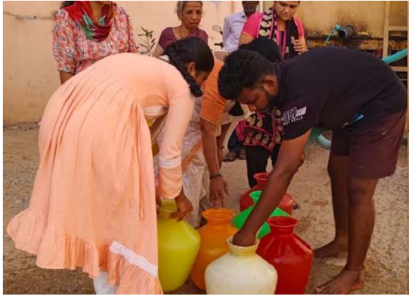
నీళ్ళ కోసం ఇబ్బందులు పడుతున్న దృశ్యం