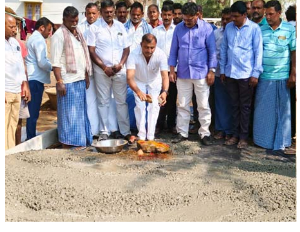
దక్ష, సైదా, రామారావు, పాండు, తదితరులు పాల్గొన్నారు.