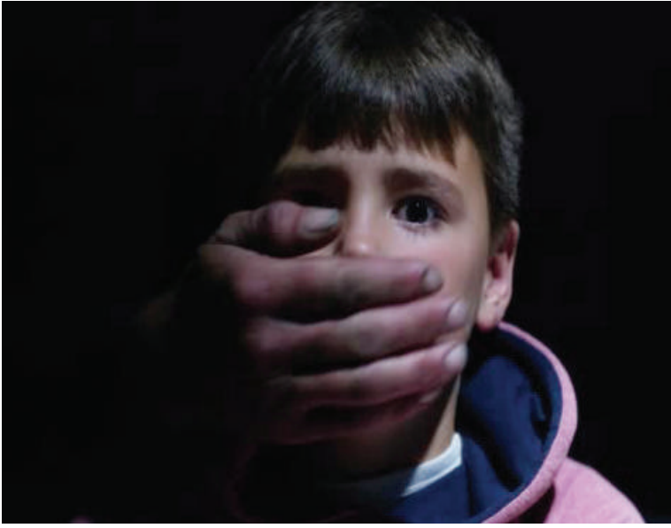
రామప్ప మండలం బురహాన్ పల్లిలో గల ప్రభుత్వ పాఠశాల వద్ద బుర్రా ధరించిన ఇద్దరు స్కూల్ పిల్లలను కిడ్నాప్ తల్లిదండ్రులు అధికారులను కోరుకుంటున్నారు.

తెలంగాణ బ్యూరో, ఫిబ్రవరి 09 (తీవ్రార్ న్యూస్): పరంగల్ మరియు పరంగల్ చుట్టూ పక్కలా ఓ వార్డులో ప్రచారం జరుగుతోంది.. అంతే కాకుండా తీవ్ర భయందోళనకు గురించేస్తున్నది. ఆ ప్రచార సమాచారం తెలిసిన వారిలో.. కొత్తవారిని ఎవరిని చూసినా ప్రజలు అనుమానం ఏకైక విధంగా పరిస్థితి చోటుచేసుకున్నది. దీనికి కారణం పరంగల్ జిల్లాలో తాజాగా జరుగుతున్న చిన్నపిల్లల కిడ్నాప్ ప్రచారం. ఈ ప్రచారం చిన్నారులకు, చిన్నపిల్లల తల్లిదండ్రులకు తీవ్ర భయందోళనలకు గురించేస్తున్నది. వివరాల్లోకి వెళ్తే.. పరంగల్ జిల్లాలో పిల్లల కిడ్నాప్ చేసే ముఠాలుగా సంచరిస్తున్నారని అన్న వార్త ప్రస్తుతం సంచలనంగా మారింది. కిడ్నాప్ ముఠాల పరంగల్ జిల్లా మరియు పరిసర ప్రాంతాల్లో సంచరిస్తున్నాయి అని గత కొద్ది రోజులుగా ప్రజల మధ్య అలాగే సామాజిక మాధ్యమాలలో ప్రచారం జరుగుతున్న నేపథ్యంలో పిల్లల తల్లిదండ్రులు భయపడుతున్నారు. ఇటీవలే