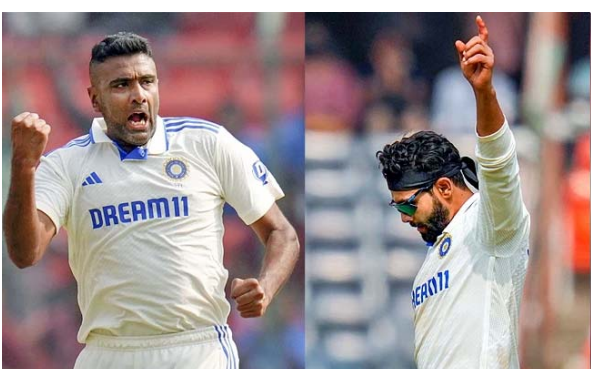
ఉంది. ఇదిలా ఉంటే.. ఇంగ్లాండ్తో తొలి టెస్టులో ఓపెనర్లు జాక్ క్రాల్(20), బెన్ డకెట్(35), మార్క్వుడ్(11) వికెట్లను అశూ పడగొట్టాడు.. ఒలి పోప్(1), జో రూట్(29), టామ్ హార్ట్లే వికెట్లను జడ్డా తన ఖాతాలో వేసుకున్నాడు. తుదిజట్టు: టీమిండియా రోహిత్ శర్మ (కెప్టెన్), యశస్వి జైస్వాల్, శుభమన్ గిల్, శ్రేయస్ అయ్యర్, కేవల్ రాహుల్, రవీంద్ర జడేజా, శ్రీకర్ భర్త, అక్షర్ పటేల్, రవిచంద్రన్ అశ్విన్, జస్ప్రీత్ బుధ్రా, మహ్మద్ సిరాజ్. ఇంగ్లాండ్ జాక్ క్రాల్, బెన్ డకెట్, ఒలి పోప్, జో రూట్, జానీ బెయిర్ స్టో, బెన్ స్టోక్స్ (కెప్టెన్), బెన్ ఫోక్స్ (వికెట్ కీపర్), రహ్మాన్ అహ్మద్, టామ్ టామ్ హార్ట్లే, మార్క్ వుడ్, జాక్ లీవ్.

ఇంగ్లాండ్తో మ్యాచ్ సందర్భంగా టీమిండియా స్పిన్ ద్వయం రవిచంద్రన్ అశ్విన్- రవీంద్ర జడేజా సరికొత్త చేలిత్ర సృష్టించారు. టెస్టులో అత్యధిక వికెట్లు కూల్చిన భారత బౌలింగ్ జోడీగా ఘనత సాధించారు. ఈ క్రమంలో టీమిండియా స్పిన్ దిగ్గజ జంట అనిల్ కుంభే - హర్షజన్ సింగ్ పేరిట ఉన్న రికార్డు బద్దలు కొట్టారు. కాగా భారత జట్టు స్వదేశంలో ఇంగ్లాండ్లో ఐదు మ్యాచ్ల సిరీస్ అడుతున్న విషయం తెలిసిందే. 246 పరుగులకు ఇంగ్లాండ్ ఆటోబై ఇందులో భాగంగా హైదరాబాద్ వేదికగా గురువారం మొదలైన తొలి టెస్టులో టాస్ ఓడిన టీమిండియా తొలుత బౌలింగ్ చేసింది. ఈ క్రమంలో బ్యాటింగ్కు దిగిన ఇంగ్లాండ్ను 246 పరుగులకు ఆటోబై చేసింది. భారత బౌలర్లలో రవిచంద్రన్ అశ్విన్ మూడు, రవీంద్ర జడేజా మూడు, అక్షర్ పటేల్ రెండు, జస్ప్రీత్ బుధ్రా రెండు వికెట్లు తీశారు. ఈ నేపథ్యంలో తొలి రోజు ఆటలో అశూ- జడ్డా మొదటి రోజు ఆటలో మొత్తం కలిపి ఆరు వికెట్లు తీశారు. దీంతో ఇప్పటి వరకు టెస్టుల్లో ఇద్దరూ కలిపి 505 వికెట్లు సంయుక్తంగా తమ ఖాతాలో వేసుకున్నారు. కుంభే- భజ్జీ రికార్డు బద్దలు తద్వారా టెస్టులో అత్యధిక వికెట్లు తీసిన భారత బౌలింగ్ జోడీగా నిలిచారు. అంతకు ముందు ఈ రికార్డు కుంభే- హర్షజన్ (501) పేరిట ఉండేది. ఇక ఈ జంటితో హర్షజన్ సింగ్- జహీర్ ఖాన్ జోడీ(474), ఉమేశ్ యాదవ్- అశ్విన్ జంట(431) నాలుగో స్థానంలో