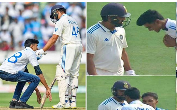
తలా 3 వికెట్లతో ఇంగ్లాండ్ పతనాన్ని శాసించగా.. అక్షర్ పటేల్, బుధ్రా చెరో రెండు వికెట్లు పడగొట్టారు.

హైదరాబాద్ వేదికగా తొలి టెస్టులో భారత్-ఇంగ్లాండ్ జట్లు తలపడుతున్నాయి. ఈ మ్యాచ్ తొలి రోజు ఆట సందర్భంగా ఓ అనూహ్య ఘటన చోటుచేసుకుంది. ఓ అభిమాని సెక్యూరిటీ సిబ్బంది కళ్ళుగప్పి మైదానంలోకి దూసుకెళ్ళాడు. గ్రౌండ్లోకి వచ్చిన సదురు అభిమాని టీమిండియా సారథి రోహిత్ శర్మ కాళ్ళు మొక్కాడు. హిట్ మ్యాన్ వద్ద వారిస్తున్నప్పటికీ అభిమాని మాత్రం వినిపించుకోలేదు. అయితే వెంటనే అప్రమత్తమైన సిబ్బంది అతడిని మైదానం నుంచి బయటకు తీసుకు వెళ్ళారు. కాగా గతంలో కూడా ఇటువంటి సంఘటనలు చాలా జరిగాయి. ఇక మ్యాచ్ విషయానికి వస్తే.. ఇంగ్లాండ్ తొలి ఇన్నింగ్స్లో 246 పరుగులకు ఆటోబైంది. ఇంగ్లాండ్ బ్యాట్లర్లలో బెన్ స్టోక్స్ 70 పరుగులతో కెప్టెన్ ఇన్నింగ్స్ ఆడాడు. భారత బౌలర్లలో రవీంద్ర జడేజా, అశ్విన్