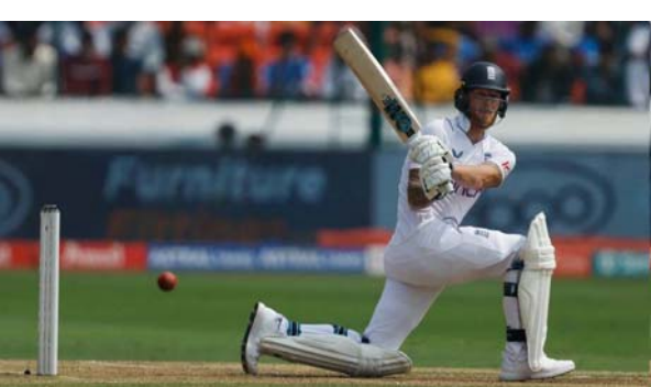
23, వుడ్ 11, లీవ్ 0 పరుగులు చేశారు. హైదరాబాద్ బౌలర్ సిరాజ్ కి ఉప్పల్ స్టేడియంలో ఒక్క వికెట్ కూడా పడకపోవడం గమనార్హం.

హైదరాబాద్ లోని రాజీవ్ గాంధీ అంతర్జాతీయ స్టేడియంలో భారత్-ఇంగ్లాండ్ మధ్య తొలి టెస్ట్ మ్యాచ్ జరుగుతోంది. టాస్ గెలిచిన ఇంగ్లాండ్ జట్టు తొలుత బ్యాటింగ్ ఎంచుకుంది. టీమిండియా బౌలర్ల ధాటికి ఇంగ్లాండ్ జట్టు 246 పరుగులకు ఆటోబై అయింది. జడేజా, అశ్విన్ చెరో మూడు వికెట్లు తీశారు. అక్షర్, బుధ్రాలకు 2 వికెట్లు తీశారు. లంన్ బ్రేక్ కి ముందు 3 వికెట్లు, లంన్ బ్రేక్ తరువాత 2, మొత్తానికి తొలిరోజే ఇంగ్లాండ్ ఆటోబై అయింది. బెన్ స్టోక్స్ అత్యధిక స్కోర్ 70 పరుగులు చేశాడు. ఇంగ్లాండ్ జట్టు స్కోరు ని పరిశీలించి నట్టుయితే.. 64.3 ఓవర్లలో 246 పరుగులకే ఆటోబై అయింది. ఓపెనర్లు క్రాల్, డకెట్ 20, 35 పరుగులు చేశారు. పోప్ 1, రూట్ 29, బెయిర్ స్టో 37, బెన్ స్టోక్స్ 70, ఫోక్స్ 4, అహ్మద్ 13, హార్ట్ లే