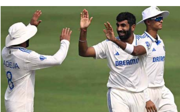
అడుకున్నారు. కానీ, లంన్ తర్వాత అక్షర్ పటేల్ దేంబరన్ బెయిర్స్టోను బౌల్ చేశాడు. ఆ కాసేపటికే జడ్డా బౌలింగ్లో రూట్ తనకు అచ్చొచ్చిన స్పిన్ షాట్ ఆడి బుధ్రాకు క్యాచ్ ఇచ్చాడు. దాంతో, 137 పరుగులకే ఆరు వికెట్లు కోల్పోయిన సమయంలో యంగ్స్టర్ టామ్ హార్ట్లే(23) ధనాధన్ ఆడి స్టోక్స్ పై అత్తిడిన తగ్గించాడు. హార్ట్లే బెటయ్యక గేర్ మార్చిన స్టోక్స్ హాఫ్ సెంచుతో స్కోర్ బోర్డును పరుగులు పెట్టించాడు. అయితే.. మరో ఎండ్లో సహకారం లభించకపోవడంతో ఇంగ్లాండ్ 246 రన్స్ తో పరిమితమైంది.

ఉప్పల్ స్టేడియంలో జరుగుతున్న తొలి టెస్టులో ఇంగ్లాండ్ 246 పరుగులకే ఆటోబయ్యింది. భారత స్పిన్నర్లు విజృంభించడంతో స్టోక్స్ సేసిన మొదటి రోజే మూడో సెషన్లో కుప్పకూలింది. కెప్టెన్ ఇన్నింగ్స్ ఆడిన బెన్ స్టోక్స్(70)ను బుధ్రా బౌల్ చేయడంతో ఇంగ్లాండ్ ఇన్నింగ్స్ ముగిసింది. భారత బౌలర్లలో జడేజా మూడు, అశ్విన్, అక్షర్ పటేల్, బుధ్రా రెండేసి వికెట్లు పడగొట్టారు. రెండోదాగా బాజ్ బాల్ ఆటతో ప్రత్యర్థులను పణికిస్తున్న ఇంగ్లాండ్ బ్యాట్లర్లు భారత గడ్డపై తేలిపోయారు. లంన్ తర్వాత తడబడిన ఇంగ్లాండ్ జట్టు టీ సమయానికి 215 స్కోర్ చేసింది. భారత స్పిన్ శ్రయం రవిచంద్రన్ అశ్విన్, రవీంద్ర జడేజా, అక్షర్ పటేల్ విజృంభణతో.. ఒకదశలో రెండోదల లోపే ఆటోబై అవుతుండునుకున్న జట్టును అతడు మార్క్ వుడ్ (7 నాటోట్), టామ్ హార్ట్లే(23)తో కలిసి విలువైన భాగస్వామ్యాల నెలకొల్పాడు. దాంతో, టీ టైమ్ కి ఇంగ్లాండ్ 8 వికెట్ల నష్టానికి 215 పరుగులు కొట్టింది. సొంతగడ్డపై బాజ్ బాల్ ఆటతో యాషెస్ సిరీస్ సమం చేసుకున్న ఇంగ్లాండ్ జట్టు భారత గడ్డపై తేలిపోయింది. తొలి సెషన్లోనే ఓపెనర్లు జాక్ క్రాల్(18), బెన్ డకెట్(35)లతో పాటు ఒలి పోప్(1)లు బెట్ కాపడడంతో.. ఇంగ్లాండ్ను జానీ బెయిర్స్టో(37), జో రూట్(29)