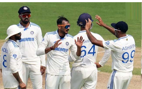
ఇంగ్లాండ్.. మరో 31 పరుగులు జోడించి చివరి రెండు వికెట్లు కోల్పోయింది. భారత బౌలర్లలో అశ్విన్ 3, జడేజా 3, అక్షర్ పటేల్ 2, జస్ప్రీత్ బుధ్రా 2 వికెట్ల పడగొట్టారు.

హైదరాబాద్: అయిదు టెస్టుల సిరీస్లో భాగంగా హైదరాబాద్లోని ఉప్పల్ స్టేడియంలో జరుగుతున్న తొలి టెస్టులో భారత్తో ఇంగ్లాండ్ తలపడుతోంది. టాస్ గెలిచి బ్యాటింగ్ ఎంచుకున్న ఇంగ్లాండ్.. తొలి ఇన్నింగ్స్లో 246 పరుగులకు ఆటోబైంది. స్పిన్కు అనుకూలించిన పీచ్పై భారత స్పిన్నర్లు విజృంభించారు. ఎనిమిది వికెట్లు వారికే దక్కాయి. పర్యాటక జట్టు బ్యాట్లర్లలో కెప్టెన్ బెన్ స్టోక్స్ (70వీ 88 బంతుల్లో 6 ఫోర్లు, 3 సిక్సులు) ఒక్కడే అర్ధ శతకంతో ఆకట్టుకున్నాడు. జానీ బెయిర్స్టో (37), బెన్ డకెట్ (35), జో రూట్ (29) చెప్పుకోదగ్గ స్కోర్లు చేశారు. అరంగేట్రం అటగాడు టామ్ హార్ట్లే 24 బంతుల్లో 23 పరుగులు చేశాడు. తొలి సెషన్లో మూడు వికెట్లు కోల్పోయి 108 పరుగులు చేసిన ఇంగ్లాండ్.. రెండో సెషన్లో మరింత తడబడింది. లంన్ బ్రేక్ అనంతరం ఐదు వికెట్లు నష్టపోయి 107 పరుగులు రాబట్టింది. 215/8 స్కోరుతో చివరి సెషన్ను ఆరంభించిన