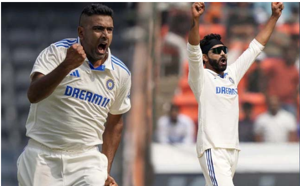
పలకగా.. అండర్సన్ మాత్రం కొనసాగుతున్నాడు. అయితే, భారత్తో హైదరాబాద్లోని ఉప్పల్ వేదికగా జరుగుతున్న మ్యాచ్లో అండర్సన్కు తుది జట్టులో స్థానం దక్కలేదు. ఆస్ట్రేలియా దిగ్గజాలు షేన్ వార్న్-గ్లెన్ మెకగ్రాథ్ 104 మ్యాచ్లలో 1,001 వికెట్లు తీశారు.

ఇంటర్నేట్ డెన్స్ టీమ్ ఇండియా స్పిన్ ద్వయం రవిచంద్రన్ అశ్విన్ - రవీంద్ర జడేజా అరుదైన ఘనత సాధించారు. భారత్ తరపున టెస్టులో అత్యధిక వికెట్లు తీసిన జోడీగా వీరు అవతరించారు. అనిల్ కుంభే - హర్షజన్ సింగ్ జోడీని అధిగమించారు. ఇంగ్లాండ్తో (%xవీణ జుచీ+% ) తొలి టెస్టులో అశ్విన్, జడేజా చెరో మూడేసి వికెట్లు తీశారు. దీంతో టెస్టుల్లో వీరిద్దరూ కలిసి 506 వికెట్లు తీసినట్లైంది. కేవలం 50 టెస్టుల్లోనే ఈ ఫీట్ను సాధించడం విశేషం. ఈ మ్యాచ్కు ముందువరకు అనిల్ కుంభే - భజ్జీ 501 వికెట్లతో అగ్రస్థానంలో ఉన్నారు. హర్షజన్-జహీర్ జోడీ 474 వికెట్లు, ఉమేశ్ యాదవ్ - అశ్విన్ కలిసి 431 వికెట్లు తీశారు. అంతర్జాతీయంగా వారే.. అత్యధిక వికెట్లు తీసిన బౌలర్లు మాత్రం ఇంగ్లాండ్కు చెందిన జేమ్స్ అండర్సన్-స్టవర్ట్ బ్రాడ్. వీరిద్దరూ కలిసి 139 మ్యాచ్లలో 1,039 వికెట్లు పడగొట్టారు. బ్రాడ్ ఇప్పటికే అంతర్జాతీయ క్రికెట్కు వీడ్కాల్