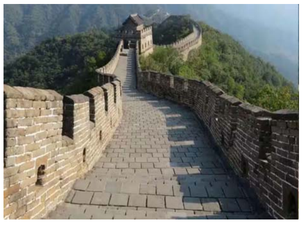
చేసుకోవడానికి పొడి వాతావరణం ఉన్న విభాగాలపై దృష్టి సారించింది. మట్టి నుండి ఇసుక, గులకరాళ్లు పొరల వరకు నిర్మాణ సామగ్రిని అధ్యయనం చేసిన అధ్యయనంలో శుష్క ప్రాంతాలతో సహా వివిధ పర్యావరణ సవాళ్లకు గ్రేట్ వాల్ అనుకూలతను వెల్లడిస్తుంది. అయితే గోడలోని చాలా పాత విభాగాల్లో నేల మీద బయోక్రస్ట్ లు కనిపించాయని వెల్లడించారు. ఈ సూక్ష్మజీవులు పూరావ నిర్మాణాల సరంక్షణ లేదా క్షీణతకు దోహదం చేస్తాయని అధ్యయనాలు సూచిస్తున్నాయి.

ప్రపంచంలో ఏడు వింతల్లో ఒకటి గ్రేట్ వాల్ చైనా.. అత్యంత పొడవైన ఈ గోడ గురించి ప్రతి ఒక్కరికీ తెలుసు.. దీనిని 'గ్రేట్ వాల్ ఆఫ్ చైనా' అని కూడా పిలుస్తారు. ఈ గోడ మొత్తం పొడవు 8,850 కిలోమీటర్లు. ఈ గ్రేట్ వాల్ నిర్మాణ పనులు క్రీస్తుపూర్వం ఐదవ శతాబ్దంలో ప్రారంభమై 16వ శతాబ్దంలో ముగియడం చెబుతారు. అంటే ఈ గోడ ఎంత పాతదో అర్థం చేసుకోవచ్చు.. ఈ గోడ శతాబ్దాలుగా తీవ్రంగా నిలబడి ఉంది. ఇప్పుడు శాస్త్రవేత్తలు ఈ గోడ వేల సంవత్సరాలుగా ఇలా నిలబడటానికి కారణాన్ని కనుగొన్నారు. సైన్స్ అల్లర్ల నివేదిక ప్రకారం చైనా, అమెరికా, స్పెయిన్ల పరిశోధకులు ఇటీవల నిర్వహించిన ఒక సహకార అధ్యయనం చారిత్రక కట్టడాలపై బయోక్రస్ట్ ప్రభావాలకు సంబంధించి కొత్త చర్చకు దారితీసింది. నిజానికి లైకెన్లు, బ్యాక్టీరియా, శిలీంధ్రాలు, నాలులు, చిన్న మొక్కలతో కూడిన బయోక్రస్ట్లు ఖనిజ ఉపతలాలపై పెరుగుతాయి. అయితే చారిత్రాత్మక ప్రదేశాల నిర్మాణ సమగ్రతకు ముఖ్యంగా పరిగణిస్తారు. ఈ జీవులు సాధారణ చివ్వులకు ముప్పు కలిగిస్తాయా..! లేదా రక్షిత కవచంగా పనిచేస్తాయా..! చారిత్రక నిర్మాణాల జీవితకాలాన్ని పెంచుతాయా అనే చర్చ ఎల్లప్పుడూ జరుగుతూనే ఉంది. నివేదికల ప్రకారం పరిశోధకుల బృందం గ్రేట్ వాల్ ఆఫ్ చైనాను సుమారు 600 కిలోమీటర్ల మేర సమగ్ర సర్వేను నిర్వహించింది. బయో క్రస్ట్లు పూరావస్థ ప్రదేశాలను ప్రభావితం చేసే నిర్దిష్ట పరిస్థితులను అర్థం