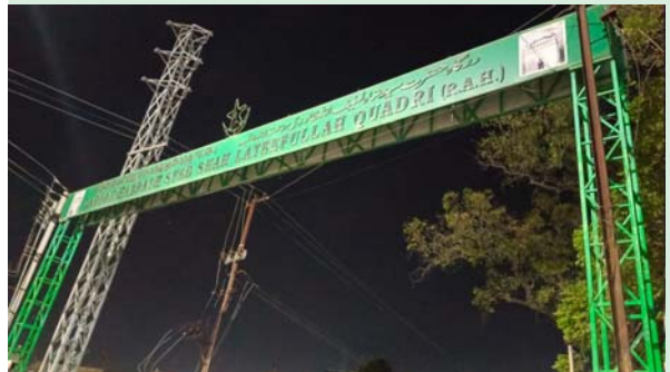
అమూల్యమైన విలువైన భూ సంపద అన్నారు. వేలాది కోట్ల రూపాయల ఈ భూమి కేవలం మీ అవసరాల కోసం అనగా ముస్లింల విద్య, వైద్యం, మౌలిక సదుపాయాలు, దార్శినిక కార్యక్రమాలు ఇతర

దర్గా దగ్గర అక్రమంగా తిష్ట వేసి తమ అయ్య తాత జాగీర్లుగా చెప్పుకుంటూ భూముల అమ్ముకుంటున్న దర్గాకు ఎలాంటి సంబంధం లేని వ్యక్తులు దూస్తికేట్ ముజావర్దని/ఇనాంధారులని & ప్రతి సంవత్సరం కోట్లాది రూపాయల ఉర్బు ఆదాయాన్ని మింగుతున్న వాళ్ల అక్రమ ఉరుసు కమిటీని తరిమేద్దాం వేల కోట్ల విలువైన మస (ముస్లింల) సంపదను, ఆదాయాన్ని మనమే రక్షించుకుని, ఆ భూములను పేద ముస్లింలకు పంచదామన్నారని. మీకు తెలుసు మీ సంక్షేమం కోసం, మీ అభివృద్ధి కోసం, కేవలం మీ పిల్లల భవిష్యత్తు కోసం, మీ జాతి అభివృద్ధి కోసం, మీ కోసం మీ పూర్వీకులు ఒక్క నల్లగొండ పట్టణ పరిధిలోనే 1000 (వేలు) ఎకరాలు పైగా వేలాది కోట్ల రూపాయల విలువైన భూమిని ఆల్లా పేరట మీ కోసం, మీ పిల్లల భవిష్యత్తు కోసం, మీ అవసరాల కోసం వక్స్ చేసి వెళ్ళారని గుర్తు చేశారు. ఇందులో ముఖ్యమైన నల్లగొండ నల్ల నదుమ ఉన్న కొన్ని వేలకోట్ల రూపాయల విలువైన లటిఫ్ సాహెబ్ గుట్ట భూములు (536 ఎకరాలు), అనేక వేల కోట్ల రూపాయల ఈ దర్గా ఆస్తి మీ