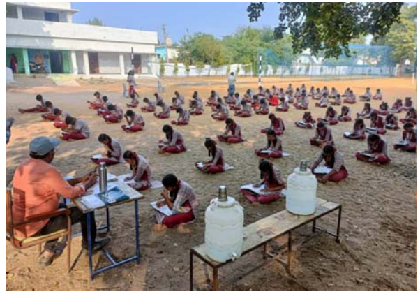
ఖమ్మం జిల్లా ప్రతినిధి, జనవరి 23(తీనూర్ న్యూస్): భారత ప్రభుత్వం నెహ్రూ యువ కేంద్రం నేషనల్ యూత్ వీక్ లో భాగంగా ప్రజ్వల యువజన సంఘం ఆధ్వర్యంలో బాల కార్కులపై మరియు హెన్ ఐవి వ్యాధి పై వ్యాసరచన పోటీలు నిర్వహించి విజేతలకు బహుమతులు అందజేశారు. ఈ కార్యక్రమంలో భాగంగా ఎన్ కె ఎన్, మహిళా శిశు సంక్షేమ శాఖ మరియు కైలాస అత్యధిక చిల్డ్రన్ ఫౌండేషన్ ఎయిడ్ ఆర్గనైజేషన్ మీరు సంయుక్తంగా బాణాపురం గ్రామం జిల్లా పరిషత్ హైస్కూల్లో బాల బాలికల సంక్షేమం కోసం ప్రభుత్వం ఏర్పాటు

- వ్యాసరచన పోటీలు నిర్వహన - బహుమతులు అందజేత