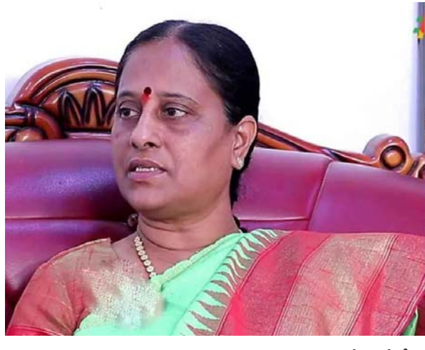
తెలిపారు. ప్లాస్టిక్ బాటిల్స్ బదులుగా గ్లాస్ బాటిల్స్ లేదంటే స్టీల్ వస్తువుల వాడకాన్ని పెంచాలని ఆమె సూచించారు.

హైదరాబాద్, జనవరి 12 (తీవ్రార్ న్యూస్): భవిష్యత్ తరాలకు నివాసయోగ్యమైన పరిసరాలను అందించటం మన అందరి బాధ్యత అని అటవీ పర్యావరణ, దేవదాయ శాఖ మంత్రి కొండా సురేఖ అన్నారు. పచ్చదనం పెంపునకు ఎంతగా ప్రాధాన్యతను ఇస్తున్నామో, నిత్య జీవితంలో ప్లాస్టిక్ వాడకాన్ని కూడా వీలైనంతగా తగ్గించాలని ఆమె విజ్ఞప్తి చేశారు. సింగిల్ యూజ్ ప్లాస్టిక్ వల్ల అనేక అసర్వాల ఉన్నాయని తెలిపారు. అవగాహన లేకుండా విపరీతంగా వాడుతున్న ప్లాస్టిక్ వ్యర్థాలను మన పరిసరాలు, గాలి, నీరు కలుషితం చేస్తున్నాయని మంత్రి చెప్పారు. ప్రభుత్వ ప్రయత్నాలకు తోడు, ప్రజలందరూ ప్లాస్టిక్ వినియోగం తగ్గించు విధానం చేపట్టాలని పిలుపు నిచ్చారు. తన సెక్రటేరియట్ కార్యాలయంతో పాటు, నివాసంలోనూ వీలైనంతగా సింగిల్ యూజ్ ప్లాస్టిక్ ను నియంత్రించేందుకు నిర్ణయం తీసుకున్నామని