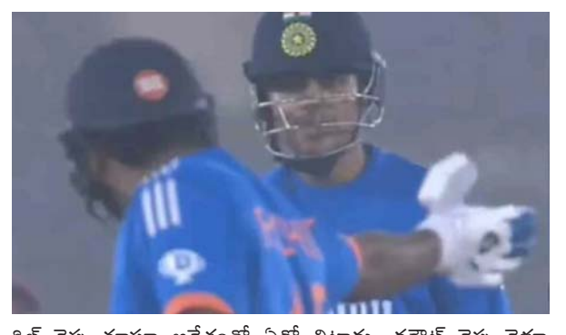
గిల్ వైపు చూస్తూ ఆవేళంతో ఏదో తిట్టాడు. డకౌట్ వైపు వెళ్తూ గిల్ కు సంతకం చేశాడు. సింగిల్ తీసుకోవడానికి గిల్ రెడ్డిగా లేకున్నా రోహిత్ మాత్రం నాన్ స్ట్రయిక్ దిశకు పరుగు తీశాడు.

మొహాలీ: అప్పనిస్టాన్ తో జరిగిన తొలి టీ20 మ్యాచ్ లో.. రోహిత్ శర్మ రనౌటయ్యాడు. దాదాపు 14 నెలల గ్యాప్ తర్వాత మళ్లీ టీ20 ఫార్యాట్ ఆడుతున్న అతను తొలి మ్యాచ్ లోనే డకౌటయ్యాడు. టీ20 వరల్డ్ కప్ జరగనున్న నేపథ్యంలో అతను ఈ ఫార్యాట్ పై మళ్లీ ఫోకస్ పెట్టాడు. అయితే అప్పన్ లో మ్యాచ్ లో అనూహ్యంగా రనౌటయ్యాడు. తొలి ఓవర్ రెండో బంతితో అతను నిద్రమించాడు. ఫజల్ ఛోపరాకి వేసిన ఆ ఓవర్ లో.. మిడాఫ్ వైపు భారీ పాట్లీ పరుగు తీయబోయాడు. అయితే నాన్ స్ట్రయిక్ ఛుక్కమన్ గిల్ మాత్రం ఒక్క అంగుళం కూడా ముందుకు జరగలేదు. రోహిత్ మాత్రం నాన్ స్ట్రయిక్ వైపు పూర్తిగా వచ్చేశాడు. అప్పన్ ఫీల్డర్ చాలా చాకచక్యంగా తన చేతుల్లోని బంతిని స్ట్రయిక్ ఎండ్ కు విసిరాడు. దీంతో రోహిత్ రనౌటయ్యాడు. ఆ సమయంలో కెప్టెన్ రోహిత్ ఆగ్రహానికి గురయ్యాడు.