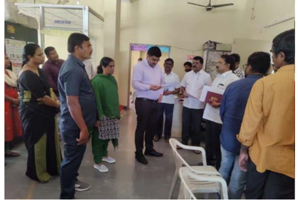
భువనగిరి జిల్లా ప్రతినిధి, జనవరి 12(తీవ్రార్ న్యూస్): అభయ హస్తం ఆరు గ్యారంటీల పథకంలో భాగంగా ప్రజా పాలన కార్యక్రమంలో వచ్చిన దరఖాస్తులు ఆన్లైన్ లో జాగ్రత్త గా చేయాలని అధికారులకి జిల్లా కలెక్టర్ జెడెంగే హనుమంతు కొడింబా పలు సూచనలు చేశారు. శుక్రవారం నాడు రామన్నపేట మండల తహశీల్దార్, ఎంపిడిఓ కార్యాలయంలో ఏర్పాటు చేసిన దరఖాస్తుల ఆన్లైన్ విధానం ను పరిశీలించారు. ఆన్లైన్ చేసిన దరఖాస్తులను జాగ్రత్త గా భద్రపరచాలి

- అధికారులకి పలు సూచనలు చేసిన జిల్లా కలెక్టర్ జెడెంగే హనుమంతు కొడింబా