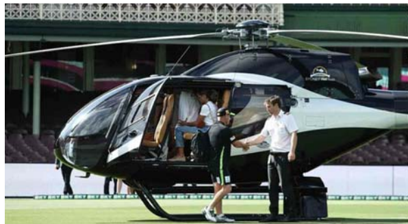
మ్యాచ్ అనంతరం ఇంటర్వ్యూవల్ టీ20 లీగ్ కోసం వార్నర్ యునైటెడ్ అరబ్ ఎమిరేట్స్ వెళ్ళనున్నాడు. అక్కడ డేవిడ్ భాయ్ దుబాయ్ క్యాపిటల్స్ జట్టు తరఫున బరిలోకి దిగనున్నాడు. రెండు ఫార్యాట్లనుంచి తప్పుకున్న వార్నర్ స్వదేశంలో వెస్టిండీస్ తో జరిగే టీ20 సిరీస్ లో ఆడి చాన్స్ ఉంది. ఫిబ్రవరి 9 నుంచి 13 వరకూ పాట్లీ సిరీస్ కు క్రికెట్ ఆస్ట్రేలియా అతడి పేరును పరిశీలిస్తున్నట్లు సమాచారం.

సుదీర్ఘ ఫార్యాట్ తో పాటు వన్డేలకు వీడ్కోలు పలికిన ఆస్ట్రేలియా అటామిక్స్ డేవిడ్ వార్నర్ ఇక టీ20 లీగ్ లో మెరవనున్నాడు. అది కూడా సొంత గడ్డపై జరుగుతున్న బిగ్ బాష్ లీగ్ లో ఈ స్టార్ బ్యాటర్ ఆడనున్నాడు. బీబీఎల్ లో తొలి మ్యాచ్ కోసం ఈ డాషింగ్ బ్యాటర్ ఓ రేంజ్ లో వెళ్ళాడు. అప్పుం హాబీవుడ్ హీరో మాదిరిగా హాలిక్వాస్టర్ లో వచ్చిన వార్నర్ సిడ్నీ మైదానంలో దిగాడు. ఆ వీడియో ప్రస్తుతం వైరల్ అవుతోంది. జనవరి 12 శుక్రవారం సాయంత్రం సిడ్నీ సిక్వెన్స్ వార్నర్ మ్యాచ్ ఆడాల్సి ఉంది. ఉదయాన్నే హంటర్ స్పృహ ప్రాంతంలో వార్నర్ సోదరుడి పెండ్లికి హాజరైన వార్నర్.. అక్కడి నుంచి 250 కిలోమీటర్ల దూరంలో ఉన్న సిడ్నీ క్రికెట్ గ్రౌండ్ కు ప్రైవేట్ హాలిక్వాస్టర్ లో సిడ్నీకి బయలుదేరాడు. టెల్ ఫోన్ లో హాలిక్వాస్టర్ ల్యాండ్ కాగానే దిగి గలగల బ్యాటింగ్ ప్రాక్టీస్ కు సిద్ధమయ్యాడు. స్టీవ్ స్మిత్ నేతృత్వం వహిస్తున్న సిడ్నీ సిక్వెన్స్ వార్నర్ తొలి మ్యాచ్ ఆడనున్నాడు. అయితే.. లీగ్ దశలో తేలిపోయిన సిడ్నీ ధర్మన్ జట్టు విపరీతంగా మ్యాచులో గెలిస్తేనే షే ఆఫ్స్ చేరుతుంది. ఈ మూడు