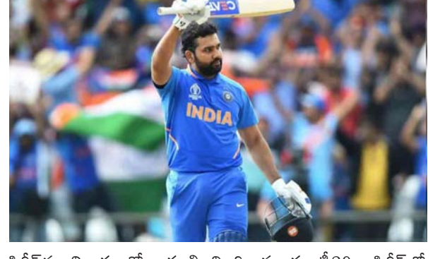
సిరీస్ ను విజయంతో ఆరంభించింది. మూడు టీ20ల సిరీస్ లో భాగంగా మొహాలీలో జరిగిన తొలి టీ20లో భారత్ 6 వికెట్ల తేడాతో ఇబ్రహీం జర్నాన్ సేను చిత్తు చేసింది. అప్పన్ నిర్దేశించిన 159 పరుగుల ఛేదనలో యువ కెరటాలూ శివం దూబే (60 నాటోబీ), జితేష్ శర్మ (31) లు దంపికొట్టడంతో 17.3 ఓవర్లలో గెలుపొందింది. దాంతో, సిరీస్ లో 1-0 తో అధిక్తుల్లోకి దూసుకెళ్లింది.

భారత కెప్టెన్ రోహిత్ శర్మ వచ్చే రాగానే పాట్లీ క్రికెట్ లో అరుదైన ఫీట్ సాధించాడు. పురుషుల టీ20లో అత్యధికంగా 100 విజయాల్లో భాగమైన క్రికెటర్ గా హిట్ మ్యాన్ చరిత్ర సృష్టించాడు. స్వదేశంలో అప్పనిస్టాన్ తో జరిగిన తొలి టీ20లో టీమిండియా ఘన విజయం సాధించింది. దాంతో, రోహిత్ విజయాల సెంచరీ కొట్టేశాడు. టీ20లో ఎక్కువ విజయాల్లో భాగమైంది ఎవరో తెలుసా..? ఇంగ్లండ్ బ్యాటర్ డానీ వ్యాట్. ఆమె 111 వికెట్లతో టాప్ లో ఉంది. ఆస్ట్రేలియా కెప్టెన్ అలీసా హెబ్, ఆల్ రౌండ్ రోజర్ ఫెడరర్ లు 100 విజయాలతో సంయుక్తంగా రెండో స్థానంలో కొనసాగుతున్నారు. పురుషుల క్రికెట్ లో అత్యధిక విజయాల్లో భాగమైన క్రికెటర్ జంబితాలో వాళ్లలో పాట్లీ హిట్ మ్యాన్ ఆల్ రౌండ్ రోజర్ ఫెడరర్ రెండో స్థానంలో నిలిచాడు. టీమిండియా రన్ మేషిన్ విరాట్ కోహ్లి 73, ఇక అప్పనిస్టాన్ మాజీ సారథి మహ్మద్ సబీ 70 విజయాలతో వరుసగా మూడు, నాలుగు స్థానాల్లో ఉన్నారు. ఇక పాక్ మాజీ కెప్టెన్ మహ్మద్ హఫీజ్ 70 విజయాలతో ఐదో స్థానం దక్కించుకున్నాడు.