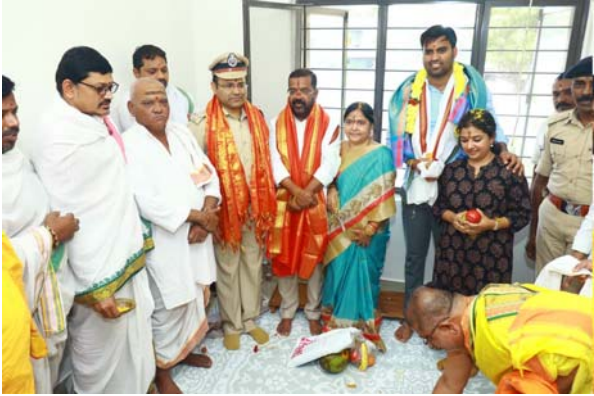
హన్మకొండ, జనవరి 08(తీనూర్ న్యూస్): హనుమకొండ బాలసముద్రం లోని ఎమ్మెల్యే క్యాంపు కార్యాలయంలో ఈ రోజు తెల్లవారుజామున పరంగల్ పశ్చిమ నియోజకవర్గం శాసనసభ్యులు నాయిని రాజేందర్

- క్యాంపు కార్యాలయానికి ప్రజా భవన్ గా నామకరణం