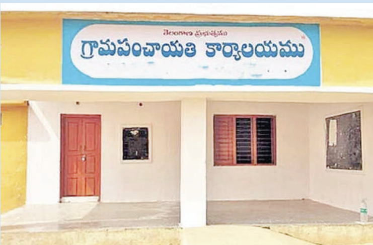
విస్తరించుకున్నారు. సర్పంచుల దిమాండ్లలో ముఖ్యమైన అంశాలు * పదవీ కాలాన్ని జూన్ వరకు పొడిగించాలి.

తెలంగాణ బ్యూరో, జనవరి 28 (తీవ్రార్ న్యూస్): తెలంగాణ రాష్ట్రంలో గ్రామ పంచాయతీ సర్పంచుల పదవీ కాలం ఈ ఏడాది ఫిబ్రవరి 01లో ముగియనున్నది. కాగా గ్రామాలను అభివృద్ధి సర్పంచులు తలకు మించిన అప్పలు చేశారు. ఎంతకూ నిధులు విడుదల కాకపోవడం వల్ల అప్పలు బాధలు భరించలేక కొంతమంది సర్పంచులు ఆత్మహత్యలు కూడా చేసుకున్నారు. రాష్ట్రవ్యాప్తంగా ఉన్న గ్రామ పంచాయతీలకు సుమారు రూ.1,200 కోట్ల బకాయిలు సర్పంచులకు రావాల్సి ఉండగా రాష్ట్ర ఆర్థిక సంఘం నిధులు 30 నెలలుగా నిలిపివేసింది. రాష్ట్రంలో గ్రామ పంచాయతీ సర్పంచుల పదవీ కాలం ఈ ఫిబ్రవరి 01లో ముగియనున్న నేపథ్యంలో సర్పంచులు ఆందోళనకు గురవుతున్నారు. అభివృద్ధి కోసం చేసిన అప్పలపై రాష్ట్ర ప్రభుత్వం స్పష్టత ఇవ్వకపోవడం పై తీవ్ర ఆవేదనకు గురవుతున్నారు. ఈ సందర్భంగా రాష్ట్ర ప్రభుత్వాన్ని సర్పంచులు ప్రభుత్వాన్ని తమ దిమాండ్లతో