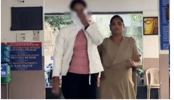
స్వాధీనం చేసుకున్నారు. ఆ నిందితులను జుబ్బీహిల్స్ పోలీసులు రిమాండ్కు తరలించారు.

హైదరాబాద్: మాజీ ప్రేమికుడిపై ఓ ప్రియురాలు పగబట్టిన ఫుటన ఆసక్తిగా మారింది. ఏకంగా కారులో గంజాయి ప్యాకెట్లు పెట్టి మాజీ ప్రియుడి జైలుకు పంపాలని పన్నాగం పన్నింది. పోలీసుల దర్యాప్తులో కథ అడ్డం తిరిగింది. వివరాలికి వెళితే.. కొన్నాళ్లుగా తనను దూరం పెడుతున్నారని లా స్టాడెంట్ అయిన యువతి తన మాజీ ప్రియుడిపై పగ పెంచుకుంది. ఈ నేపథ్యంలోనే తనను ఎలాగైనా పోలీసులకు పట్టించాలని భావించి నిర్ణయం తీసుకుంది. ఈ క్రమంలోనే ఆ యువకుడి కారులో గంజాయిని పెట్టి, పోలీసులకు ఆమె సమాచారం ఇచ్చి పట్టించేలా చేసింది. విచారణలో యువతే రూ.4 వేలు పెట్టి గంజాయి కొనుగోలు చేసి.. కారులో పెట్టించిందని తెలిపింది. దీంతో ఆ యువతితో పాటు మరో ఏడుగురు వ్యక్తులను అరెస్టు చేశారు. వీరి వద్ద నుంచి 40 గ్రాముల గంజాయిని పోలీసులు