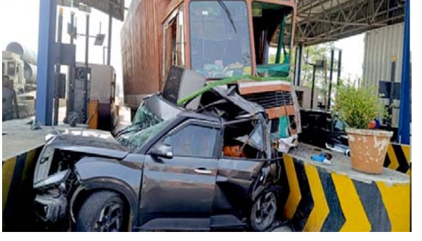
నమోదు చేసి దర్యాప్తు చేస్తామని పోలీసులు తెలిపారు.

నిజామాబాద్: నిజామాబాద్ జిల్లాలో ఓ లాల్ బిభత్సం సృష్టించింది. మంగళవారం ఇందల్యాయి టోల్ ప్లాజా దగ్గర వేగంగా వచ్చి ఓ లాల్, ముందు వెళ్తున్న కారును డీకొట్టింది. దీంతో కారు.. టోల్ ప్లాజా కౌంటర్ లోకి దూసుకెళ్లింది. ఈ ఘటనలో ముగ్గురు తీవ్రంగా గాయపడ్డారు. సమాచారం అందుకున్న పోలీసులు వెంటనే అక్కడికి చేరుకుని సహాయక చర్యలు చేపట్టారు. క్షతగాతులను చికిత్స కోసం జిల్లా ప్రభుత్వ ఆస్పత్రికి తరలించారు. లాల్ డ్రైవర్ పోలీసులు అదుపులోకి తీసుకున్నారు. డ్రైవర్ మధ్యం మత్తులో ఉండటం వల్లే ఈ ప్రమాదం జరిగినట్లు పోలీసులు తెలిపారు. గాయపడిన వారిలో ఇద్దరు టోల్ ప్లాజా సిబ్బంది, కారులో ప్రయాణిస్తున్న మరో వ్యక్తి ఉన్నారుని చెప్పారు. ఈ ఘటనపై కేసు