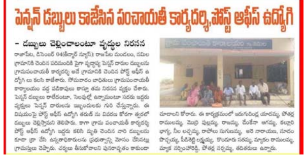
పెన్షన్ డబ్బులు కాజీసిన పంచాయతీ కార్యదర్శి, పోస్ట్ ఆఫీస్ ఉద్యోగి

డబ్బులు చెల్లించాలంటూ వృద్ధుల నిరసన" వార్తకు అధికారులు స్పందించగా వెంటనే లబ్ధిదారుల ఇంటికి వెళ్లి కాజీసిన పెన్షన్ డబ్బులను అందజేశారు. ఈ విషయంపై తమ డబ్బులను పొందిన లబ్ధిదారులు " తీనూర్ వార్త" దినపత్రికలో సమాచారం అందించి, ప్రత్యేక కృతజ్ఞతలు తెలియజేశారు.