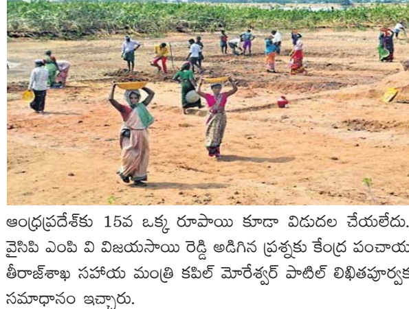
ఆంధ్రప్రదేశ్కు 15వ ఒక్క రూపాయి కూడా విడుదల చేయలేదు. వైసిపి ఎంపి వి విజయములు రెడ్డి అడిగిన ప్రశ్నకు కేంద్ర పంచాయతీరాజ్ శాఖ సహాయ మంత్రి కవిత మోరేశ్వర్ పాటిల్ లిఖితపూర్వక సమాధానం ఇచ్చారు.

న్యూఢిల్లీజాతీయ గ్రామీణ ఉపాధి హామీ పథకాన్ని నిర్వీర్యం చేసే కుట్ర లను కేంద్రంలోని బిజెపి ప్రభుత్వం కొనసాగిస్తోన్నప్పుడు. ఉపాధి హామీ చట్టం ప్రకారం ఈ పథకానికి నిధులు సమకూర్చాలిన కేంద్ర ప్రభుత్వం కనీసం ఉపాధి కార్యక్రమాలకు ఇవ్వాల్సిన వేతనాలకు సంబంధించిన డబ్బులు కూడా ఇవ్వడం లేదు. దీంతో యెటికేకూ కేంద్రం ప్రభుత్వం 'ఉపాధి' బకాయిలు పేరుకుపోతున్నాయి. ఆంధ్రప్రదేశ్కు రూ. 110.56 కోట్ల ఉపాధి హామీ వేతనాల బకాయిలు ఉన్నాయని కేంద్ర గ్రామీణాభివృద్ధిశాఖ సహాయ మంత్రి సాధ్య నిరంజన్ జ్యోతి తెలిపారు. రాజ్యసభలో ఒక ప్రశ్నకు ఆమె లిఖితపూర్వక సమాధానం ఇచ్చారు. 2023 నవంబర్ 29 వరకు ఎపికి రూ. 110.56 కోట్లు వేతనాలకు సంబంధించిన బకాయిలు పెండింగ్లో ఉన్నాయని ఆయన పేర్కొన్నారు. తెలంగాణకు రూ.10.96 కోట్లు బకాయిలు ఉన్నాయని తెలిపారు.రూపాయి కూడా విదిల్చిన కేంద్రం : విజయసాయిరెడ్డి