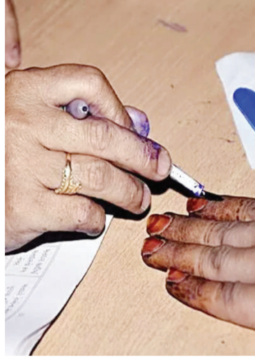
సీఈవో వికాస్ కోఆర్డినేట్ అయ్యారు. రాష్ట్రంలో పలు చోట్ల ఈవీఎల మొరాయిస్తున్న కాంగ్రెస్ పార్టీ స్పందించింది. సమస్యలను ప్రస్తావిస్తూ సీఈవో వికాస్ కోఆర్డినేట్లకు ఫిర్యాదులు చేశారు. ఈవీఎలలో ఉన్న సమస్యలను పరిష్కరించాలని కోరంది. లేని పక్షంలో పోలింగ్ కేంద్రాలలో పోలింగ్ సమయం పెంచాలని కాంగ్రెస్ పార్టీ నేతలు సీఈవోలకు కోరారు.

తెలంగాణ బ్యూరో, నవంబర్ 30 (తీవ్రార్ న్యూస్): తెలంగాణ రాష్ట్ర అసెంబ్లీ ఎన్నికలు ముగిశాయి. సాయంత్రం 5 గంటలకు పోలింగ్ ముగిసింది. 5 గంటలలోపు క్యూలో నిలబడి ఉన్నవారికి ఓటు వేసే అవకాశం కల్పించారు. గురువారం (నవంబరు 30) రాష్ట్ర వ్యాప్తంగా 119 నియోజకవర్గాల్లో పోలింగ్ జరిగింది. ఉదయం 7 గంటలకు మొదలైన ఓటింగ్ ప్రక్రియ సాయంత్రం 5 గంటల వరకూ సాగింది. సమస్యాత్మక ప్రాంతాలు గుర్తించిన 13 నియోజకవర్గాల్లో మాత్రం పోలింగ్ సు గంట ముందు సాయంత్రం 4 గంటలకే ముగించారు. మహిళాస్థ ప్రభావిత ప్రాంతాలుగా ఎన్నికల సంఘం గుర్తించిన సమస్యాత్మక ప్రాంతాల్లో సాయంత్రం 4 గంటలకే పోలింగ్ ముగిసింది. కేవలం 13 ప్రాంతాల వారికి మాత్రం సాయంత్రం 4 గంటల వరకే ఓటు వేసే అవకాశం ఉంటుంది. సిర్కూర్, చెన్నూరు, బెల్లంపల్లి, మంచిర్యాల, ఆసిఫాబాద్, మంధని, భూపాలపల్లి, ములుగు, పినపాక, ఇల్లంపల్లి, కొత్తగూడెం, అశ్వారావుపేట, భద్రాచలం నియోజక వర్గాల్లో సాయంత్రం 4 గంటలకే పోలింగ్ ముగించే విధంగా ఏర్పాట్లు చేశారు. ఆ ప్రకారం ఈ ప్రాంతాల్లో మొత్తం 600 పోలింగ్ కేంద్రాల్లో సాయంత్రం 4 గంటలకే పోలింగ్ ముగిసింది. 4 గంటలలోపు క్యూలో ఉన్నవారిని ఓటు వేయడానికి అధికారులు అనుమతిస్తున్నారు. పలుచోట్ల మొరాయిచిన ఈవీఎల కోన్ని చోట్ల 12 గంటల తరువాత ఓటర్లు బయటకు వచ్చారు. పోలింగ్ కేంద్రాల వద్ద ఓటర్లు బారులు తీరారు. అక్కడక్కడ స్వల్ప ఉద్రిక్తతలు మినహా రాష్ట్ర వ్యాప్తంగా పోలింగ్ ప్రశాంతంగా సాగుతోంది. పలుచోట్ల ఈవీఎల మొరాయిస్తున్నాయి. దీంతో ఓటర్లు అసహనం వ్యక్తం చేశారు. కొన్ని చోట్ల ఓటు వేయడానికి కనీసం 10 సెకన్ల సమయం పడుతోందని ఓటర్లు అభిప్రాయం వ్యక్తం చేస్తున్నారు. దీనిపై జిల్లా ఎన్నికల అధికారులకు, స్టేట్ ఎన్నికల కమిషన్కు ఫిర్యాదులు అందుతున్నాయి. ఈ విషయంపై డీఈవోలతో