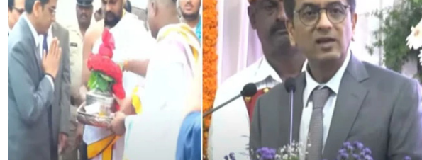
మంగళగిరి: కేసుల పరిష్కారంలో జాప్యాన్ని నివారించాలని సుప్రీంకోర్టు ప్రధాన న్యాయమూర్తి జస్టిస్ డివై చంద్రచూడ్ సూచించారు. గుంటూరు జిల్లా మంగళగిరిలోని కాజ వద్ద నిర్వహించిన ఏపీ జ్యూడీషియల్ అకాడమీ భవనాన్ని ఆయన ప్రారంభించారు. హైకోర్టు రికార్డుల డిజిటలైజేషన్ ప్రాజెక్టుతో పాటు ఆన్లైన్ సర్టిఫైడ్ కాపీల జారీకి సంబంధించిన సాఫ్ట్వేర్ అప్డేట్ చేస్తున్న కూడా సీజేపి ప్రారంభించారు. అనంతరం న్యాయమూర్తి డివి చంద్రచూడ్ ఆడిటోరియంలో ఏర్పాటు చేసిన కార్యక్రమంలో ఏపీ హైకోర్టు మొదటి వార్షిక నివేదికను ఆయన

విడుదల చేశారు. ఈ సందర్భంగా న్యాయమూర్తులు, న్యాయవారులను ఉద్దేశించి సీజేపి మాట్లాడారు. “న్యాయవ్యవస్థను పరిరక్షించేందుకు అందరి సహకారం అవసరం. పెండింగ్ కేసులను సత్వరమే పరిష్కరించాలి. కేసుల సత్వర పరిష్కారానికి సాంకేతిక పరిష్కారం చాలా ఉపయోగపడుతుంది. న్యాయవ్యవస్థ వేగంగా సేవలందించాలంటే మౌలిక వసతులు మెరుగుపరచాలి. నూతన సాంకేతికతకు అనుగుణంగా మార్పులు చేసుకోవడం చాలా ముఖ్యం. న్యాయవారులు తెల్లచౌకలపై నల్ల కోటు ధరిస్తారు. తెలుపు, నలుపులను ఆత్మవిశ్వాసం, క్రమశిక్షణలకు గుర్తులుగా పరిగణిస్తారు. న్యాయమూర్తులకు సొంత సామర్థాలపై విశ్వాసం ఉండాలి. నిత్య విద్యార్థులుగా ఉంటూ వృత్తి నైపుణ్యం పెంచుకోవాలి. న్యాయవ్యవస్థలో కేసుల సంఖ్య కంటే నాణ్యతకు ఎక్కువ ప్రాధాన్యత ఉంటుంది. ఉత్తమ వర్గతలను వరసరం వంతుకోవడం ద్వారా లక్ష్యాన్ని సాధించవచ్చు” అని సీజేపి జస్టిస్ చంద్రచూడ్ తెలిపారు. ఈ కార్యక్రమంలో ఏపీ హైకోర్టు ప్రధాన న్యాయమూర్తి జస్టిస్ ప్రశాంత్ కుమార్ మిశ్రాతో పాటు న్యాయమూర్తులు పాల్గొన్నారు.