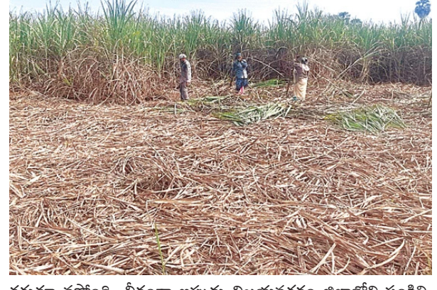
తగ్గుతూ వస్తోంది. వీరుతా ఇప్పుడు విజయనగరం జిల్లాలోని సంగలి సుగర్ ప్యాక్టరీకి చెరకును పంపిస్తున్నారు. చెరకు కటింగ్ ఆర్డర్ వరకు రైతులకు ఇబ్బంది ప్రస్తుతం 30 టన్నులకు మించి దిగుబడి రావడంలేదని వాపోతున్నారు. ఎకరా చెరకు సాగుకు రూ.15వేలకు పైబడి, కటింగ్, ట్రాన్స్పోర్ట్కు టన్నుకు మరో రూ.2,500 ఖర్చు చేయాల్సి వస్తోందని ఆవేదన వ్యక్తం చేస్తున్నారు. ఈ పరిస్థితుల్లో టన్నుకు రూ.2,850 ధర చెల్లిస్తే పంటను సాగుచేసేదెలా అని రైతులు ప్రశ్నిస్తున్నారు. మద్దతు ధరను పెంచాలని కోరుతున్నారు. ప్రస్తుత వైసీపీ ప్రభుత్వంలో రైతులకు దాదాపు రాయితీలన్నీ నిలిపివేశారు. గతంలో పంట పొలంలో బావి తవ్వడానికి, ఆయిల్ ఇంజన్లు, పవర్ లీటర్లు, ఎరువులు, వురుగుల మండలపై రాయితీలు ఇచ్చేవారు. ప్రస్తుతం ఎలాంటి రాయితీలు లేకపోవడంతో సాగు చేయడానికి ఆర్థికంగా ఇబ్బందులు ఎదుర్కొంటున్నారని రైతులు ఆవేదన వ్యక్తం చేస్తున్నారు. ఇదే పరిస్థితి కొనసాగితే రానున్న రోజుల్లో చెరకును సాగు చేసేవారు కనుమరుగయ్యే ప్రమాదముందని చెబుతున్నారు. చెరకుకు సరైన గిట్టుబాటు ధర కల్పించకపోవడంతో రైతులు ఆర్థికంగా ఇబ్బందులు ఎదుర్కొంటున్నారు. గతంలో ఇచ్చిన రాయితీలు కూడా నిలిపివేశారు. దీంతో చెరకు సాగు చేయడం మరింత కష్టమైంది. రైతులను ప్రోత్సహించకపోతే భవిష్యత్లో చెరవు సాగు క్రమేణా తగ్గే అవకాశం ఉంది.