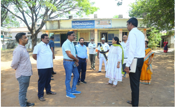
చే ఎన్నికల సిబ్బంది పి.ఓ.లకు, ఏ.పి.ఓ.లకు, ఓ పి ఓ లకు మొదటి రోజు 450 మందికి, రెండవ రోజు 350 మంది సిబ్బందికి శిక్షణ తరగతులు నిర్వహించనున్నట్లు వారు తెలిపారు.

ములుగు, అక్టోబర్ 27 (తీనూర్ న్యూస్): ఎన్నికల సిబ్బంది పి.ఓ., ఏ.పి.ఓ.లకు నిర్వహించనున్న శిక్షణ తరగతులకు కావలసిన అన్ని ఏర్పాట్లను పూర్తి చేయాలని జిల్లా ఎన్నికల అధికారి, జిల్లా కలెక్టర్ ఇలా త్రిపాఠి సంబంధిత అధికారులను ఆదేశించారు. శుక్రవారం జిల్లా ఎన్నికల అధికారి, జిల్లా కలెక్టర్ ఇలా త్రిపాఠి జిల్లా కేంద్రంలోని ప్రభుత్వం ఉన్నత పాఠశాల, జిల్లా పరిషత్ బాలికల ఉన్నత పాఠశాల, జిల్లా పరిషత్ బాలికల ఉన్నత పాఠశాలలో ఎన్నికల సిబ్బంది పి.ఓ., ఏ.పి.ఓ.లకు నిర్వహించనున్న శిక్షణ తరగతుల గమలను పరిశీలించారు. ఈ సందర్భంగా జిల్లా ఎన్నికల అధికారి, జిల్లా కలెక్టర్ ఇలా త్రిపాఠి మాట్లాడుతూ రాష్ట్ర ఎన్నికల సంఘం ఆదేశాల మేరకు జిల్లాలో మొదటి స్థానంలో ప్రతీయ పూర్తి చేసామని అన్నారు. ఈ నెల 28, 30 తేదీలలో శనివారం, సోమవారం రెండు రోజులు మాస్టర్ ట్రైనర్స్