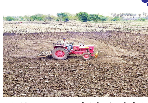
నరసరావుపేట : వరుసగా పంటలు సాగు చేసే క్రమంలో రసాయన ఎరువులు వాడకం వల్ల నేలలో కొన్ని మూర్తలు చోటుచేసుకుంటాయి. భూమిలో మూలకాలు ఎంత మేరకు ప్రభావితం అవుతున్నాయి. ఏ పోషకాలు క్షీణించి ఏమి లోపించాయనే అంశాలు భూసార పరిష్కల ద్వారా తెలుస్తాయి. దీని ఆధారంగానే ఏ పంటలు మేసుకోవాలి? కూడా నిర్ణయించుకోవచ్చు. ప్రధాన పోషకాలైన నత్రజని, భాస్వరం, పొటాష్ పరిమాణాల్లో మార్పులను గ్రహించవచ్చు. ఇంతటి కీలకమైన పరిష్కలు మూడిళ్ళుగా చేయకపోవడంతో భూమిలో పోషకాలకు సంబంధించి

రైతులకు సమాచారం తెలియడం లేదు. సూక్ష్మపోషకాల లోపంతో పంట దిగుబడులు పై ప్రభావం పడుతోంది. పంటలు వేరుదానికి ముందుగా భూసారం పరిష్కలు తెలుసుకోవడం అత్యంత అవసరం. భూమిలో కొన్ని మూర్తలు చోటుచేసుకోవాలి. వేసవి కాలంలో వ్యవసాయ శాఖ ప్రత్యేక కార్యక్రమంగా చేపట్టి.. ఖరీఫ్ సీజన్ మొదలయ్యే సమయానికి రైతులకు ఫలితాలు అందించాలి. గత మూడిళ్ళు గా భూసార పరిష్కలు వ్యవసాయ శాఖ శీతకన్ను వేసింది. ప్రస్తుతం రబీ పంటలు కూడా చేతికందే సమయం ఆసన్నమైంది. రెండు నెలలపాటు వేసవిలో పొలాలు ఖాళీగా ఉంటాయి. దీంతో భూసార పరిష్కలు చేయించడానికి అనుకూల సమయమిది. భూసార ప్రయోగశాలల్లో యంత్రాలు, పనిముట్లు ఉపయోగంతో ఉంచటం.. మట్టి సమూహాలు సేకరణ, తరలింపు, పరిశీలన చదవం.. ఫలితాలు రైతులకు చేర్చటానికి అవసరమైన ముందు కార్యాచరణ సిద్ధం కాలేదు. నేలలోని మూలకాల తీరు తెలుసుకు, భూమిలో అలోగ్యాన్ని నిర్ధారించుకుని.. అవసరమైన పోషకాలను అందజేయడానికి భూసార పరిష్కలు అవసరం. ప్రతి మూడిళ్ళకొకసారి ఈ పరిష్కలు తప్పనిసరి రీతి చేయించాలి. వరుసగా పంటలు సాగు చేస్తున్నందున మూలకాల స్థితిలో మార్పులు చోటుచేసుకుంటాయి. 2020 నుంచి భూసార పరిష్కలు మరుగున పడ్డాయి.