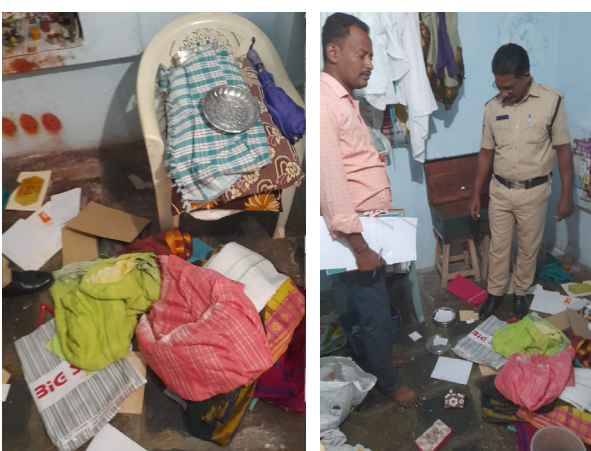
ఘటనపై నేరేడువర్ర పోలీసు వారు కేసు నమోదు చేసి దర్యాప్తు చేస్తున్నట్లు తెలియజేశారు.