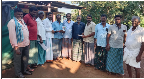
ములుగు, అక్టోబర్ 27 (తీనూర్ న్యూస్): శుక్రవారం జిల్లాలోని అభ్యూహం గ్రామపంచాయతీ పరిధిలో గల అభ్యూహం, శ్రీరామలపల్లి, బాణాలపల్లి, కుమ్మరిపల్లిలో గల కాంగ్రెస్ గ్రామ కమిటీ ఆధ్వర్యంలో రాజీవ్ అసెంబ్లీ ఎన్నికల్లో కాంగ్రెస్ విజయం ద్యేయంగా కాంగ్రెస్