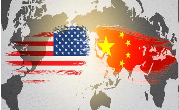
అభివృద్ధిని సాధించింది. చైనాకి చెందిన బయటి నిపుణులు అమెరికాలో ఉద్యోగాలు సంపాదించి, తమ రవాణాను రవాణాగా చైనాకు చేరమొనరుతుంటూ అప్పట్లో ట్రంప్ ఆరోపించారు. ఇది పూర్తిగా అసత్యం కాకపోయినా, ఇరు దేశాల సంబంధాలపై పెద్దగా ప్రభావం చూపలేదు. చైనా తెవాన్ ను తమ దేశంలో కలుపుకునేందుకు చాలా కాలంగా ప్రయత్నిస్తోంది. ఇందుకు అమెరికా అడ్డుపడటంతో ఇరు దేశాల మధ్య సంబంధం ఢాల్చి ఉద్రిక్తతలు పెరిగాయి. అమెరికా చట్టసభల అధ్యక్షురాలు నాన్సీ పేలోసీ తెవాన్ ను సందర్శించడం చైనాకు కంటంపొంపు అయింది. తెవాన్ చుట్టూ అమెరికా సైనిక విన్యాసాలను నిర్వహించింది. తెవాన్ తమ దేశంలో అంతర్జాగమంగా పదే పదే ప్రకటనలు చేయడం, వాటిని తెవాన్ ఖండించడం, తెవాన్ కి అమెరికా అండగా నిలవడంతో అగ్రరాజ్యం, చైనా మధ్య దూరం మరింత పెరిగింది. అప్పటి నుంచి చైనా అమెరికాపై ద్వేషాన్ని కక్కుతోంది. ఈ నేపథ్యంలో ఉక్రెయిన్ యుద్ధంలో చైనా రష్యాకు భారీగా ఆయుధాలను, ఆయుధ సామగ్రిని సరఫరా చేయడంతో అదే స్థాయిలో అమెరికా, దాని మిత్ర దేశాలు ఉక్రెయిన్ కి ఆయుధాలను, క్షిపణులను అందిస్తున్నాయి.