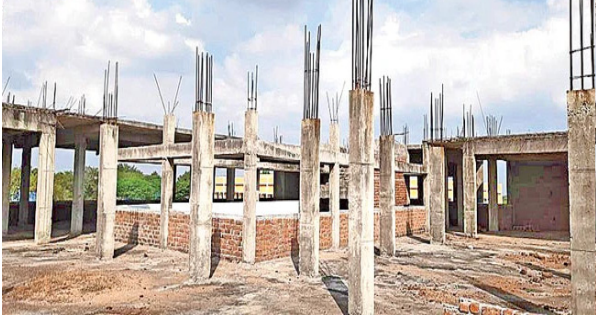
సంవత్సరంలో ఒక్కో వసతి గృహానికి రూ. 1.50 కోట్ల చొప్పున కేటాయింపారు. ఆయా నిధులు పూర్తి స్థాయిలో విడుదల కాకపోవడం.. కొందరు గుత్తేదారులకు గిట్టబాటు కాకపోవడంతో చాలా చోట్ల పనులు నత్తనడకనే సాగుతున్నాయి. అధికారుల పర్యవేక్షణ లేకపోవడం కారణమనే విమర్శలు వస్తున్నాయి. అందోలను మండలం అహ్మీద్ పల్లి, రాయకోడ్, పుల్లెట్ మండలం బస్టాప్ లో వసతి గృహాలను నిర్మాణ దశలోనే ఉన్నాయి. జిన్నారం, నాగేగడ్డ మండలం మోర్లలో పనులు పూర్తయినా వినియోగంలోకి తీసుకురాలేదు. వలేపల్లి మండలం పోతుగట్ల గుడ శివారులో రంగులు వేసే పనులు మాత్రమే మిగిలి ఉన్నాయి. హత్తూరు మండలం గుండ్ల మాచనూరులోని ఆరోజ్ కిందట నిర్మాణం పూర్తయినా ఇప్పటికీ వినియోగంలోకి రాలేదు.

సంగారెడ్డి : అక్షరాస్యత తక్కువగా ఉన్న మండలాల్లో ప్రభుత్వం ఆదర్శ పాఠశాలలను ఏర్పాటు చేసింది. బాలికలకు వసతి కల్పించి, బాలురకు డే స్కూల్ కింద బోధన చేయాలన్న లక్ష్యంతో వీటికి శ్రీకారం చుట్టారు. జిల్లాలో పది ఆదర్శ పాఠశాలలున్నాయి. రెండు చోట్ల మినహా మిగతా విద్యాలయాల్లో విద్యార్థినులకు వసతి గృహాలు అందుబాటులోకి రాలేదు. ఈ బడుల్లో చదవడానికి ఆరో తరగతిలో ప్రవేశానికి పరీక్ష నిర్వహించి విద్యార్థినులను ఎంపిక చేస్తారు. ప్రవేశం పొందిన చాలా మంది విద్యార్థినులు దూర ప్రాంతాల నుంచి రాకపోకలు సాగుస్తూ ఇబ్బంది పడుతున్నారు. జిల్లాలో 10 ఆదర్శ పాఠశాలలున్నాయి. వీటిలో రామనంద్రాపురం, మునిపల్లిలో మాత్రమే వసతి గృహాలు వినియోగంలోకి వచ్చాయి. ఈ పాఠశాలల్లో 6 నుంచి 10వ తరగతిలో పాటు ఇంటర్మీడియట్ వరకు మొత్తం 3,695 మంది బాలికలకు చదువుతున్నారు. వసతి సౌకర్యం లేకపోవడంతో దూర గ్రామాల నుంచి బాలికలు రాకపోకలకు తీరంగా ఇబ్బంది పడు తున్నారు. కొందరు ఆలోలను ఆశ్రయిస్తుండగా, మరికొందరు బస్సుల్లో వస్తున్నారు. 2022-23 విద్యా సంవత్సరం మరో నెలతో పూర్తికానుంది. వచ్చే విద్యా సంవత్సరం ప్రారంభం నాటికైనా అన్ని చోట్ల భవన నిర్మాణ పనులు పూర్తి చేసేలా అధికారులు చొరవ చూపితే.. విద్యార్థినుల కష్టాలు దూరమయ్యే అవకాశం ఉంటుంది. తెలంగాణ రాష్ట్ర విద్య, మాళిక సదుపాయాల సంస్థ ఆధ్వర్యంలో ఆదర్శ పాఠశాలల వసతి గృహాలు నిర్మిస్తున్నారు. 2012