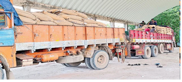
విరుద్ధంగా తక్కువగా బియ్యం రావడం పరిపాటిగా మారింది. నవంబరు 2022లో మంచిర్యాల పట్టణంలో ఓ డీలర్ దుకాణాన్ని పౌరసరఫరాశాఖ అధికారులు తనిఖీ చేయగా, 50 కిలోల సంచిత బియ్యం అందులో 40 కిలోలుగా ఉన్నట్లుగా అధికారులు గుర్తించినా, ఎంఎల్ఎస్ పాయింట్ బాధ్యులపై ఎలాంటి చర్యలు చేపట్టలేదు. ఆదిలాబాద్ జిల్లా ఇండ్రవెల్లి మండల కేంద్రంలో డీలర్ లబ్ధిదారులకు ఇస్తున్న బియ్యంలో ప్రతి ఒక్కరికి ఒకటి రెండు కిలోలు తక్కువ వచ్చిందని తూనికలు కొలతలశాఖ అధికారులు గత నెలలో గుర్తించారు. తూకం ప్రక్రియనే లేకపోవడంతో ఎంఎల్ఎస్ పాయింట్లలో హమాల్ ఛార్జీలకు రెక్కలు వస్తున్నాయి. ఉమ్మడి జిల్లావ్యాప్తంగా ఉన్న 24 ఎంఎల్ఎస్ పాయింట్లలో ఒక్క బస్తా కిలోల తూకం వేసినందుకు రూ. 11 చొప్పున అంటే, రెండుసార్లు తూకం వేసినందుకు రూ. 22 ఖర్చు చేస్తున్నారు. నాలుగు జిల్లాల్లో ఒక్క నెలకు 1,30,25,770 కిలోల బియ్యం కేటాయిస్తుండగా, ఇందుకు రూ. 28 కోట్ల వరకు హమాల్ ఖర్చులే చెల్లిస్తున్నారు.

భారీగా తరుగు వస్తున్న బియ్యం అసిఫాబాద్ : నిరుపేదల ఆకలి తీర్చే రేషన్ బియ్యం అసిఫాబాదుగా పక్కదారి పట్టడం సర్వ సాధారణంగా మారింది. నిత్యం వందల క్వింటాళ్ల బియ్యం పొరుగు రాష్ట్రానికి రోడ్డు, రైలు మార్గంలో అక్రమంగా తరలుతుండగా, మరోవైపు డీలర్లకు వచ్చే బియ్యం గణనీయంగా తక్కువగా వస్తుండటం లబ్ధిదారులకు శరాభాటలా మారతోంది. తూకం ప్రక్రియ ఎక్కడా సక్రమంగా అమలు కాకపోవడం వల్ల చివరికి ప్రజలే నష్టపోతున్నారు. పర్యవేక్షణ చేయాల్సిన అధికారులు పట్టనట్లుగా వ్యవహరిస్తుండటంతో రేషన్ బియ్యం పంపిణీలో అక్రమాల చోటు చేసుకుంటున్నాయి. అనేక చోట్ల లబ్ధిదారులకు వచ్చే బియ్యంలో కిలో, రెండు కిలోలు తక్కువగా వస్తున్నాయి. ఉమ్మడి జిల్లాలోని ఎంఎల్ఎస్ (మండలస్థాయి నిల్వ) గోదావరికి ఎఫ్ డి కార్పొరేషన్ ఆఫ్ ఇండియా) నుంచి బియ్యం వస్తాయి. వెంటనే తూకం వేసి తీసుకోవాలి. ఇక్కడి నుంచి రేషన్ డీలర్లకు బియ్యం వెళ్తాయి. మరోసారి తూకం వేసి తీసుకోవాలి. ఈ రెండు సార్లు నిబంధనలకు అధికారులు నీళ్లు పడుతున్నారు. లారీల నుంచి నేరుగా అలాగే డీలర్లకు పంపించడంతో 50 కిలోల ఒక్కో సంచిత నాలుగు కిలోల చొప్పున క్వింటాళ్లకు 8 కిలోల మేరకు తరుగు వస్తోంది. పౌర సరఫరాలశాఖ అధికారుల తనిఖీల్లో ఈ విషయం బయటపడినా, ఎలాంటి చర్యలు చేపట్టడం లేదు. గోనె సంచి సైతం ఆర కిలో వరకు ఉంటుంది. వాస్తవంగా డీలర్లకు నిక్షిప్త బియ్యం కంటే ఆర కిలో బియ్యం ఎక్కువ రావాల్సి ఉండగా, అందుకు