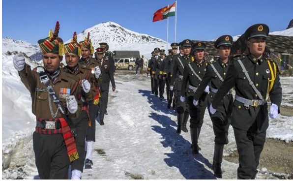
జనాలకు ప్రత్యక్ష ముప్పు ఉండే అవకాశం ఉందని, ఫలితంగా అమెరికా జోక్యం అవసరమవుతుందని పేర్కొంది. ఉగ్రవాదులకు మద్దతివ్వడంలో పాకిస్తాన్కు సుదీర్ఘ చరిత్ర ఉందని, పాకిస్తాన్ రెచ్చగొట్టే చర్యలకు ప్రధాన మంత్రి నరేంద్ర మోదీ నేతృత్వంలోని ప్రభుత్వం సైనిక బల ప్రయోగానికి దిగి అవకాశాలు ఉన్నాయని హెచ్చరించింది. పాక్ కేంద్రంగా పని చేస్తున్న ఉగ్రవాద సంస్థల కశ్మీరులో అశాంతిని, హింసను సృష్టించినాభి భారత దేశంలో ఉగ్రవాద దాడి జరిగినా మోదీ ప్రభుత్వం పాకిస్తాన్ పై విరుచుకుపడే అవకాశం ఉందని పేర్కొంది.

న్యూఢిల్లీ : పాకిస్తాన్, చైనాతో భారత దేశ సంబంధాల్లో ఇబ్బందులు కొనసాగి అవకాశం ఉందని అమెరికన్ సేషన్ల ఇంటెలిజెన్స్ అంచనా వేసింది. 2020లో గాల్ఫ్ స్టేట్ జరిగిన ఘర్షణ పరిస్థితులు కొనసాగుతాయని, పాకిస్తాన్లోని ఉగ్రవాద సంస్థల కశ్మీరులో హింసాత్మక చర్యలకు పాల్పడితే, పాక్ పై భారత దేశం ప్రతీకార చర్యలకు దిగి అవకాశం ఉందని అంచనా వేసింది. వార్షిక ముప్పు అంచనా నివేదికలో అమెరికన్ సేషన్ల ఇంటెలిజెన్స్ డైరెక్టర్ ఈ వివరాలను వెల్లడించారు. రష్యా-ఉక్రెయిన్ యుద్ధం నేపథ్యంలో పాకిస్తాన్ చైనా, భారత దేశం మధ్య ఘర్షణలు జరిగి అవకాశం ఉందని, అటువంటి పరిస్థితుల్లో అమెరికా తక్షణమే దృష్టి సారించవలసిన అవసరం ఏర్పడవచ్చునని ఈ నివేదిక పేర్కొంది. రష్యా-ఉక్రెయిన్ యుద్ధం నేటి కాలపు యుద్ధ లక్షణాలను నిర్వచించే యుద్ధమే చెప్తూ, అంతర్జాతీయ నిబంధనలను మార్చడం, పొరుగు దేశాలను బెదిరించడం వంటి చర్యలకు పాల్పడుతూ, నిబంధనల ఆధారిత ప్రపంచ పరిస్థితులను మార్చే సామర్థ్యం చైనాకు ఉందని తెలిపింది. వివాదాస్పద సరిహద్దుల వెంబడి భారత్, చైనా తమ తమ సైన్యాలను పెద్ద ఎత్తున మోహరించిన విషయాన్ని ఈ నివేదిక ప్రస్తావించింది. అణ్ణయూద్ధ సామర్థ్యంగా ఇరు దేశాల మధ్య ఘర్షణ జరిగే ప్రమాదం ఎక్కువగా ఉందని తెలిపింది. దీనివల్ల అమెరికన్లకు, అమెరికా ప్రయో