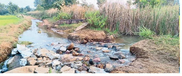
విస్తీర్ణంలో సాగువుతున్న పొలాలకు నీరు అందక ఎండిపోతున్నాయి. వాగుల్లో గుంతలు చేసి పొలాలకు నీరు అందిస్తున్నారు. బజార్ హత్తుర్ మండలం దేగామ ప్రాజెక్ట్ పరిస్థితి అధ్వానంగా మారింది. సరైన కాలువలు, తూములు లేక నీరంతా వృధాగా పోతోంది. చివరికి ఖరీఫ్ కాలంలో రైతుల పొలాలకు నీరు అందడం లేదు. కాలువల్లో చేరిన పూడిక తీసేందుకు రైతులు ఏటా అదనంగా ఖర్చు చేయాల్సి వస్తుంది. అనుకున్న సాగు కంటే మూడింటంల తక్కువ విస్తీర్ణంలోనే ఈ నీటితో పంటలు సాగు చేస్తున్నారు. ఈ ప్రాజెక్టును పూర్తిస్థాయిలో అభివృద్ధి చేస్తే బజార్ హత్తుర్ మండలంలోని 70 శాతం గ్రామాల్లో పాటు ఇచ్చోడ మండలంలోని కొన్ని గ్రామాలకు పూర్తిస్థాయిలో నీరు అందుతుంది. ప్రస్తుతం కొన్ని గ్రామాల రైతులకు మాత్రమే నీరు అందడంతో ఆశించిన ఫలితం ఉండడం లేదు.

ఇచ్చోడ : మూడు కాలాల పాటు పంటలు పండాలంటే పుష్కలంగా నీరు ఉండాలి. కష్టపడేతప్పం రైతుకు ఉన్నా సాగు నీరు అందించే పరిస్థితి లేక ఇక్కట్లు పడుతున్నాయి. చిన్నపాటి ప్రాజెక్టులు నీటిని అందించే పరిస్థితి లేక పరిస్థితి అందోళనకరంగా మారింది. మరోవైపు నీటి కోసం గ్రామాల్లో రైతులు గొడవలకు దిగడం, సమస్యను పాలకులు, అధికారుల దృష్టికి తీసుకెళ్లడం పరిపాటిగా మారతోంది. మొదటి పంటపై కాలం కనికరించక.. రెండో పంటపైనే రైతులు ఆశలు పెంచుకుంటున్నారు. ఇలాంటి పరిస్థితిలో నీరు అందక పంట ఎండలు ముఖం పడుతుండటంతో కన్నీరు పెట్టుకుంటున్నారు. బోఫ్, బజార్ హత్తుర్, సిరికొండ మండలంలో నిర్మించిన ప్రాజెక్టుల నీరు అందని దయనీయ పరిస్థితి నెలకొంది. సిరికొండ మండలంలో నిర్మించిన చిక్ మాన్ ప్రాజెక్టును 3 వేల ఎకరాలకు సాగు నీరు అందించే లక్ష్యంగా 2007లో నిర్మించారు. సరైన తూములు లేకపోవడం, నీరంతా వృధాగా పోతుండటంతో ఆయకట్టు రైతుల పొలాలకు నీరు అందక తీవ్ర ఇబ్బందులు పడుతున్నారు. కాలువల పరిస్థితి అధ్వానంగా మారింది. సిరికొండ మండలంలో 15 వేల ఎకరాలు ఉండగా, ప్రతి రైతు పొలానికి సాగు నీరు అందించే సామర్థ్యం చిక్ మాన్ జలాశయానికి ఉంది. పాలకులు, అధికారులు దృష్టి సారించి ఆయకట్టును పెంచేలా చర్యలు చేపడితే ఈ మండలంలో పాటు మట్టు పక్క మండలాల రైతులకు ఎంతో మేలు జరిగి ఆస్కారముంటుంది. ఉన్న కొద్ది పాటి