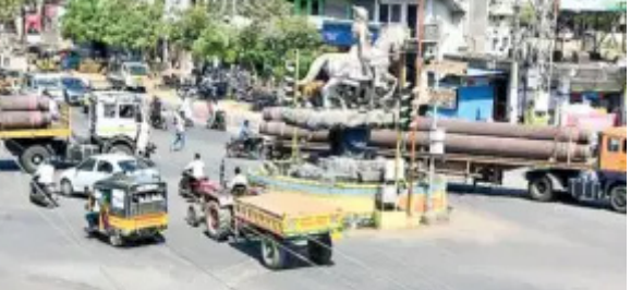
నిర్మల్ : మారుతున్న కాలానికనుగుణంగా ప్రజల అవసరాలు ఎక్కువయ్యాయి. ఫలితంగా వాహన వినియోగమూ పెరిగింది. దీనికనుగుణంగా రహదారుల విస్తరణ పూర్తిస్థాయిలో జరగకపోవడంతో ప్రధాన పట్టణాల్లో ట్రాఫిక్ తిప్పలు నిత్యతృప్తంగా మారాయి. కొన్నిచోట్ల సిగ్నల్స్ ఏర్పాటుచేసినా.. నిర్వహణను మర్చిపోవడంతో అవి నిరుపయోగమయ్యాయి. ఫలితంగా పరిస్థితి ఎక్కడవేసి గొంగలి అక్కడే అన్వయించడం మారింది. జిల్లాకేంద్రంలోని శివాజీపాక్ 44, 61వ జాతీయరహదారుల జంక్షన్. దీనికి తోడు నిర్మల్- రాయకల్ రోడ్లను కొత్త నేషనల్ హైవేగా ప్రకటించి విస్తరణ పనులు చేపట్టారు. అంటే.. ఇది మూడు జాతీయ రహదారులకు అడ్డా అవుతుంటుంది. నిత్యం వందలాది వాహనాలు ఈ మార్గంలో ప్రయాణిస్తుంటాయి. ట్రాఫిక్ నియంత్రణ కోసం చాలాలోజుల కిందటే ఇక్కడ సిగ్నల్స్ ఏర్పాటుచేశారు. అయితే నిర్వహణలోపం కారణంగా ఇవి తరచూ మొరాయిస్తున్నాయి. దీంతో

సిగ్నల్స్ వెలగక వాహనాల రాకపోకలు ఇష్టాధిని సాగుతున్నాయి. ఉదయం, సాయంత్రం వేళల్లో స్థానిక వాహనాల పెద్దసంఖ్యలో ఉండటంతో కొన్ని సందర్భాల్లో ప్రమాదాలు తప్పటం లేదు. ప్రాణాపాయం లాంటి ఘటనలు అరుదు అయినా.. గాయపడటం మాత్రం సర్వసాధారణం అన్నట్లుగా మారింది. పట్టణంలోని వివేకపాక్, జయశంకర్ స్కూల్, మినీట్యాంకిబండ్, డాక్ గాం ప్రాంతంలోనూ ట్రాఫిక్ సిగ్నల్స్ ఉన్నాయి. కానీ, చాలావరకు ఇవేమీ పనిచేయడం లేదు. నామ్ కే వాస్తో అన్నట్లుగా ఇవి కేవలం చూడటానికే పనికొస్తున్నాయి తప్ప వాహనాల రాకపోకలను నియంత్రించడంలో విఫలమవుతున్నాయి. వివేకపాక్ ప్రాంతంలోని ట్రాఫిక్ సిగ్నల్స్ ఓ బిల్లు కిందకు వేలాతుతోందంటే పరిస్థితి ఎలా ఉందో అర్థం చేసుకోవచ్చు. పోనీ, ట్రాఫిక్ సిబ్బందిని అందుబాటులో ఉంచినా పరిస్థితిని చక్కదిద్దుతున్నారా అంటే అదీ లేదు. సిగ్నల్స్ పనిచేయని కారణంగానే ఈ పరిస్థితి నెలకొందని కాదు. రహదారులు ఇరుకుగా మారడం, రోడ్లపైకి వస్తున్న దుకాణాలు, చిరువ్యాపారాల నిర్వహణ కారణంగా వాహనదారులకు ఆటంకం ఏర్పడుతోంది. బస్టాండ్ ప్రాంతంలో కేవలం ఒక వాహనం మాత్రమే సాఫీగా వెళ్లగలిగే పరిస్థితి కనిపిస్తుంది. మిగతా అంతా ఇష్టాధిని నిలిచిన వాహనాలు, చిరు వ్యాపారాలే కారణం. ఎప్పుడైనా ఏదైనా విమర్శలు వచ్చినా, ఫిర్యాదులొచ్చినా ఒకటి, రెండు రోజులు వాదావిడి చేయడం, ఆ తర్వాత పరిస్థితిని మర్చిపోవడం సర్వసాధారణం. బైంసా పట్టణంలోని శివాజీపాక్ లో వారం రోజుల క్రితం ఓ డ్యూప్లీకాహనదారుడు రోడ్డు దాటేందుకు ప్రయత్నిస్తుండగా లారీ డీకాట్లంది.