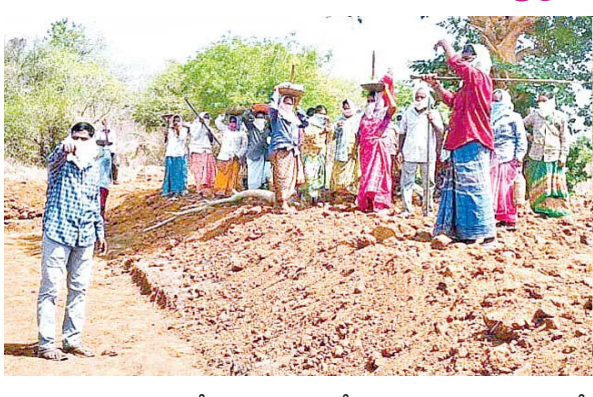
9.37 లక్షల మంది కూలీలందంగా వారిలో 5.21 లక్షల మంది మాత్రమే తరచూ పనులకు వెళ్తున్నారు. మిగతా 4.15 లక్షల మంది కూలీలు తీసుకున్న రోజు నుంచి ఇప్పటి వరకూ ఒక్క రోజు కూడా పని చేయని వారిని పరిగణనలోకి తీసుకున్నారు.లి కరోనా విజృంభణతో ఇతర చేతాలు, నగరాలు, పట్టణాలకు ఉపాధి కోసం వలస వెళ్లిన వారు గ్రామాల బాట పట్టారు. వీరిలో ప్రైవేటు సంస్థల్లో పని చేసే వారితోపాటు చదువుకునే యువత ఉన్నారు. కూలీ కావాలని అడిగిన ప్రతి ఒక్కరికీ జాబ్ కార్డుతోపాటు పని కల్పించారు. 2020-21లో ఉమ్మడి జిల్లా వ్యాప్తంగా 40 శాతానికి పైగా కొత్త వారు చేరారు.

సిరిసిల్ల: నిరుపేదల జీవన ప్రమాణాలను మెరుగుపరచాలనే లక్ష్యంతో మహాత్మాగాంధీ జాతీయ గ్రామీణ ఉపాధి హామీ చట్టం (ఎంజిఎస్ఐఆర్ కేజీ)లో కేంద్రం పలు మార్పులు చేపట్టింది. ఈ పథకం ప్రవేశపెట్టి 17 ఏళ్లు పూర్తయ్యాయి. గ్రామీణ ప్రాంతాల్లోని కుటుంబాల్లో వెలుగులు నింపుతున్న ఈ పథకం విస్తృత తగ్గుతోంది. ఇటీవల కేంద్ర బడ్జెట్లో నిధుల కేటాయింపుల్లో కోత విధించింది. అది మరవక ముందే పనికి వెళ్లని కూలీలను తొలగించే ప్రక్రియను ప్రారంభించింది. దీని ప్రభావం ఉమ్మడి జిల్లాలో 4.15 లక్షల మంది కూలీలపై చూపనుంది. కేంద్రం ఉపాధి హామీకి నిధుల కేటాయింపు తగ్గింపు ప్రభావం రాష్ట్రం, జిల్లాలపై చూపనుంది. ఇప్పటికే జాబితాలో సమైది చేసుకున్న కూలీలకు సరిపడా పనులు దొరకడం లేదు. కేంద్రం తాజా నిర్ణయంతో మరింత మంది ఉపాధి కోల్పోనున్నారు. ఉమ్మడి జిల్లాలో 1,215 గ్రామాల్లో ఇది అమలువుతోంది. 2019లో పురపాలక విస్తరణతో చాలా గ్రామాలు పట్టణాల్లో విలీనమయ్యాయి. ఇక్కడి వారు చాలా కాలంగా ఉపాధి హామీ పథకాన్ని అమలు చేయాలని కోరుతున్నారు. వీరి వినతులు బట్టడాఖలయ్యాయి. వచ్చే నెలతో అర్థిక సంవత్సరం ముగియనుంది. ఉమ్మడి జిల్లా వ్యాప్తంగా 2,531 కుటుంబాలు మాత్రమే వంద రోజులు పూర్తి చేసుకున్నాయి. దీనిలో అత్యధికంగా కరీంనగర్ జిల్లాలోనే ఉన్నాయి. పని చేసే వారికి ఉపాధి హామీ పథకం అమలు చేస్తూ.. అక్రమాలకు తావివ్వ కూడదని కేంద్రం భావిస్తోంది. ఉమ్మడి జిల్లాలో