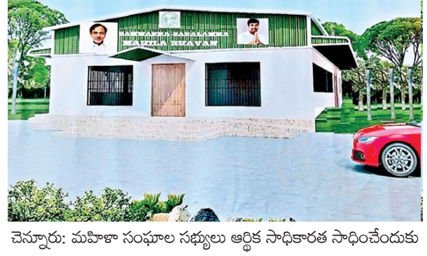
చెన్నూరు: మహిళా సంఘాల సభ్యులు ఆర్థిక సాధికారత సాధించేందుకు

ప్రభుత్వం అనేక సంక్షేమ పథకాలు అమలు చేస్తూ వారికి ఆర్థిక దన్నుగా నిలుస్తోంది. వారు సర్కారు నుంచి పొందుతున్న రుణాలు సద్వినియోగం చేసుకొని ఆర్థికాభివృద్ధి సాధిస్తున్నారు. ఆర్థిక ఎదుగుదలలో సమావేశాల నిర్వహణ చాలా కీలకం కాగా వీరికి నీడ లేకపోవడంతో ఇబ్బందులకు గురవుతున్నారు. ఇళ్లు, పాఠశాలలు, చెట్ల కింద ఇబ్బంది పడుతూ సమావేశాలు ఏర్పాటు చేసుకునే మహిళలకు అండగా నిలవాలని ప్రభుత్వం వివేక బాల్కు సమస్య సంతకించారు. రాష్ట్రంలోనే తొలిసారిగా సమృద్ధి-సారలమ్మ పేరిట మహిళా భవనాల నిర్మాణాలు చేపట్టారు. చెన్నూరు నియోజకవర్గంలో తొలివిడతగా 58 గ్రామాలను ఎంపిక చేసి ఒక్కో భవనానికి రూ. 18 లక్షలు నిధులు కేటాయిస్తున్నట్లు ఇటీవల ప్రకటించారు.