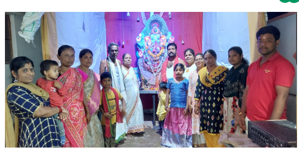
రామన్నపేట, సెప్టెంబర్ 23(తీవ్రార్ న్యూస్): రామన్నపేట మేజర్